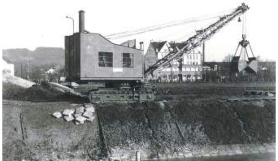
Kran mit Raupenschlepper im Einsatz (im Hintergrund das ehem. Kurheim Austria)