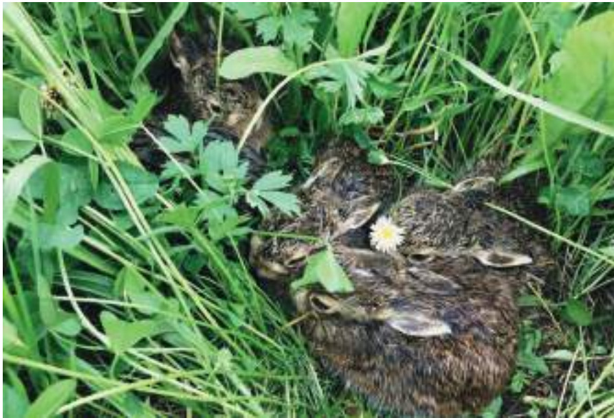
Jungtiere, wie hier ganz junge Feldhasen, und Gelege (Nester mit Eiern) auf keinen Fall berühren. Es handelt sich meist um keine Findelkinder und die tierischen Eltern sind nicht weit von ihren Schützlingen entfernt.