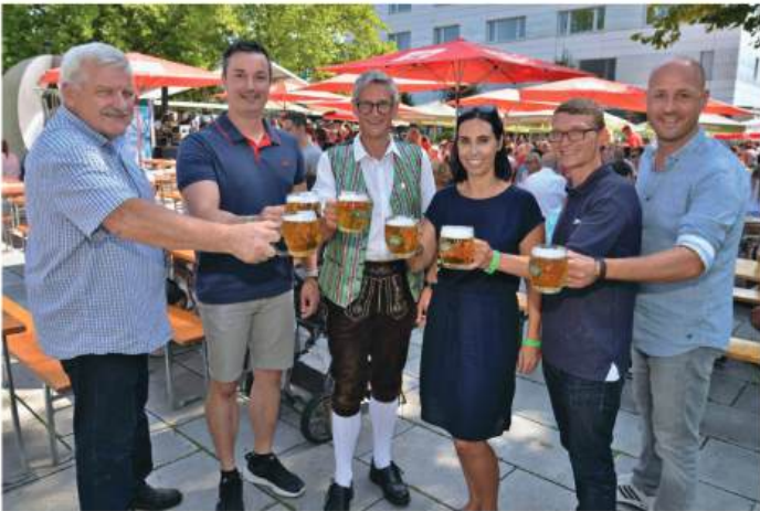
Verein der Kaufmannschaft, Gemeinde und Tourismusverband freuten sich über viele Besucher.