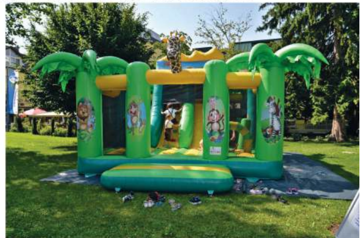
Das Kinderschminken, das Basteln und die Hüpfburg erfreute sich bei den Kleinsten größter Beliebtheit.