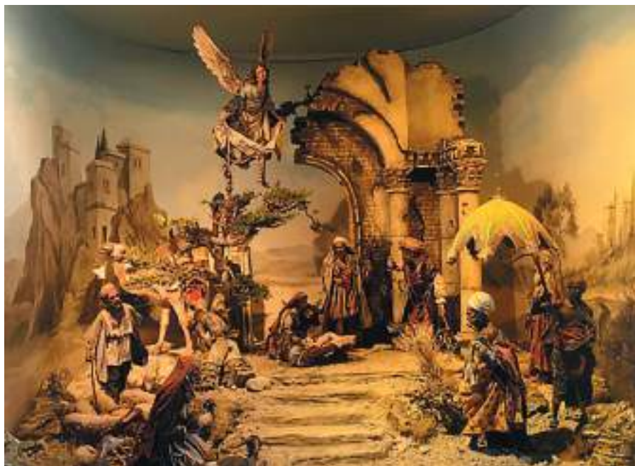
Orientalische Krippe in der Badstraße