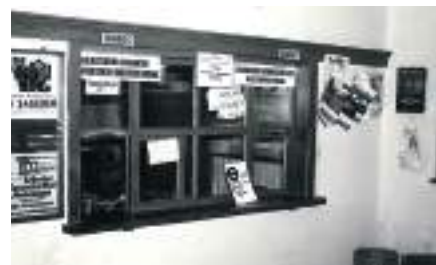
Das Postamt im Rathaus in den 1950er Jahren

1965 erfolgte dann der erste Spatenstich für ein neues Postamtsgebäude mit Wählamt in der Linzer Straße 4. Es wurde am 11.12.1967 eröffnet und war ab diesem Zeitpunkt an diesem Platz bis zum 14. Mai 2021 das Postamt Bad Schallerbach. Es gab also beinahe 100 Jahre ein eigenes Postamt in unserer Gemeinde. Unverständlich war daher dessen Schließung im Mai 2021 wegen angeblicher Unrentabilität. Als Ersatz dafür gibt es in der Badstraße in der Kur-Drogerie Resch wenigstens einen Postpartner.