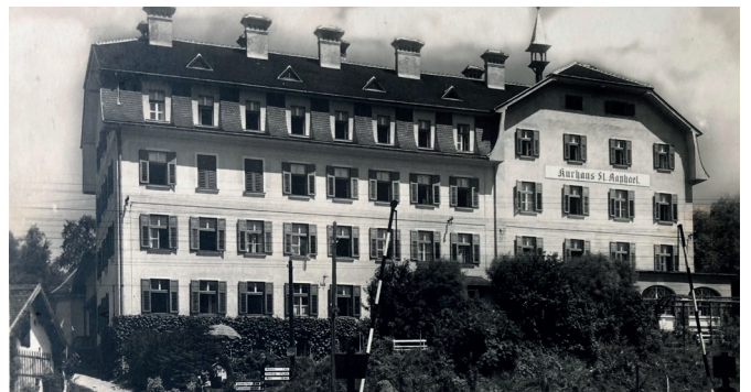
Eröffnet 1922 als Priesterkurhaus „St. Raphael“ in der Linzer Straße wurde dieses Haus schließlich abgerissen und es entstand dort das heutige Alten- und Pflegeheim der Kreuzschwestern „Wohnen mit Pflege St. Raphael“, welches 2015 eröffnet werden konnte und Platz für 78 Patient:innen bietet.