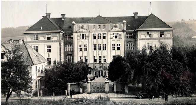
Kurheim 1: Errichtet 1924/25 von den Verbandskrankassen. Nach dem Neubau des Reha-Zentrums der PVA in der Schönauer Straße wurde dieses Haus in der Grieskrichner Straße 43 durch einen privaten Investor in ein Wohnhaus revitalisiert.

Kurz nach der Erschließung unserer Schwefel-Thermalquelle verbreitete sich die Kunde vom heilkräftigen Thermalwasser schnell und nach Untersuchungen wurde festgestellt, dass die Schwefel-Thermalquelle die Grundlage für ein Heilbad bildete. Schon bald begann die Berichterstattung über die sogenannte „Wunderquelle von Schallerbach“ in oberösterreichischen Zeitungen. Die Meldungen führten zu einem riesigen Zustrom Neugieriger und Heilung-Suchender. Dies wiederum führte dazu, dass in den 1920er-Jahren eine hektische Bautätigkeit ausgelöst wurde und sich zahlreiche Kuranstalten rund um die Thermalquelle ansiedelten. Zum Teil bestehen diese heute noch als Gesundheitseinrichtungen, zum Teil wurden diese mittlerweile in Wohngebäude bzw. zu Hotels umgebaut, zum Teil aber auch gänzlich geschliffen.