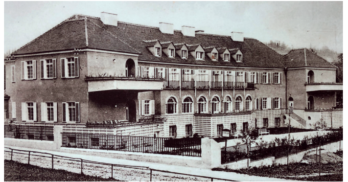
Kurheim 2: Errichtet 1924/25 von der Wiener Bezirkskrankenkasse. Dieses ehemalige Kurheim in der Schönauer Straße 16 ist im Besitz der Pensionsversicherungsanstalt (PVA) und dient bereits seit mehreren Jahrzehnten als Personalwohnhaus.