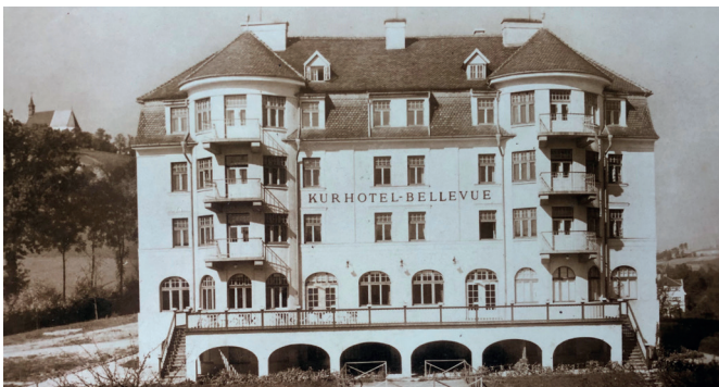
Errichtet 1922/23 von der „Schallerbach Hotel und Bau AG“, die aus der „Schallerbach Heilbad Ges.“ hervorging und 1928 wegen Liquidation an die „Hauptanstalt der Angestelltenversicherung“ verkaufte. Zuletzt als Ambulatorium der PV geführt, steht dieses Haus in der Magdalenbergstraße derzeit leer.