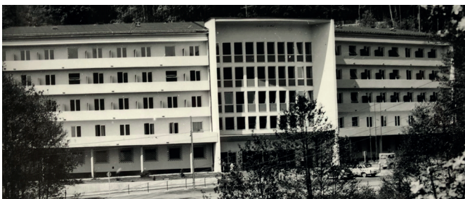
Errichtet 1966 - 1969 als Kurheim des Oö. Kriegeropferverbandes wurde dieses Objekt nach dessen Schließung durch die Innviertler Siedlungsgenossenschaft (ISG) erworben und revitalisiert. Heute befinden sich in dem Haus in der Schönauer Straße Mietwohnungen.