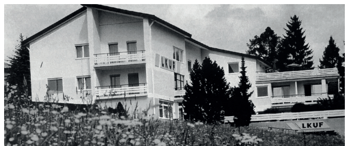
Errichtet 1959 - 1961 als Kurheim der Oö. Lehrer-Kranken- u. Unfallfürsorge (LKUF) wurde dieses Objekt in der Konradstraße schließlich abgerissen. Es erfolgte durch die PROVITA Projektges. an diesem Standort die Errichtung eines Wohnhauses mit 12 Wohnungen.