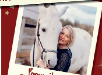
... Ponyreiten ... € 7,- 22./ 28./ 29./ 30.12.