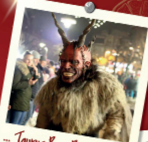
... Taurus Pass Perchten ... 07.12.

16 00 Silvester Warm-Up Party 18:00 Live-Musik: Barbados 18:30 LED-Stelzengeher 20:30 Feuershow