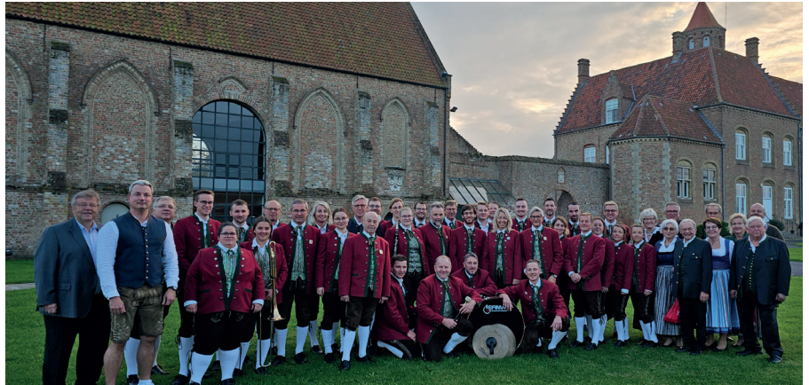
Die Delegation aus Bad Schallerbach wurde von der Marktkapelle begleitet.

Gemeinsam mit der Abordnung aus Politik und Öffentlichkeit reiste unsere Marktkapelle, die die Feierlichkeiten musikalisch begleitete. Was die Besuchsgruppe in Koksijde erwartete, war mehr als nur ein Programm – es war ein Gefühl von Freundschaft und gelebter Gemeinschaft. Die dreitägigen Feierlichkeiten boten auch eine einzigartige Gelegenheit, alte Freundschaften zu erneuern, neue Verbindungen