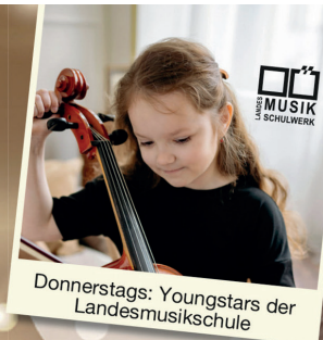
Donnerstags: Youngstars der Landesmusikschule