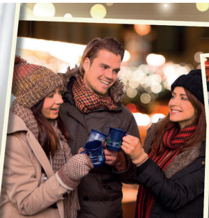
Do + Fr 16 - 21 Uhr Sa + So 15 - 21 Uhr