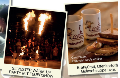
SILVESTER WARM-UP PARTY MIT FEUERSHOW

16 00 SILVESTER WARM-UP PARTY 18:00 Live-Musik: Barbados 18:30 Uhr LED-Stelzengheher 20:30 Uhr Feuershow