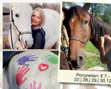
Ponyreiten: € 7,- 22.12. 28.12. 29.12. 30.12.