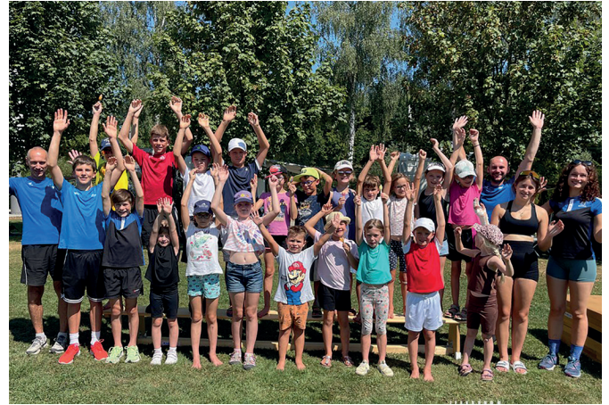
Bei der ÖTB-Ferienaktion wurden Wettbewerbe mit verschiedenen Stationen abgehalten. Dabei standen Geschicklichkeit und Schnelligkeit im Fokus.