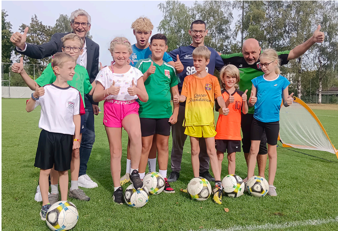
Bei der Ferienaktion des SV Bad Schallerbach bekamen die Kinder Einblicke in die Grundtechniken des Fußballs. Passen, Dribbeln und Schießen durften dabei natürlich nicht fehlen.