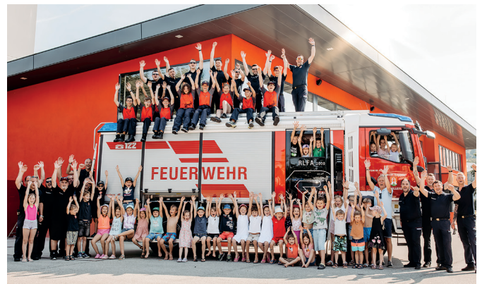
40 Kinder kamen zur Ferienaktion der örtlichen Feuerwehr. Großes Highlight waren für die Kinder Fahrten mit den Feuerwehrfahrzeugen. Zur Stärkung gab es ein Eis und zum Abschluss eine Urkunde.

An dieser Stelle wird festgehalten, dass stellvertretend für alle Aktionen nur ein Auszug der durchgeführten Aktionen als Bilddokumentation veröffentlicht wird.