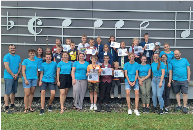
Der Nachmittag bei der Marktkapelle war gefüllt mit spannenden Programmpunkten, die den Teilnehmern einen vielseitigen Einblick in die Welt der Musik boten.

und Organisationen, die den Ferienpass durch ihre Bereitschaft, Ferienpassaktionen anzubieten und durchzuführen, erst ermöglicht haben.