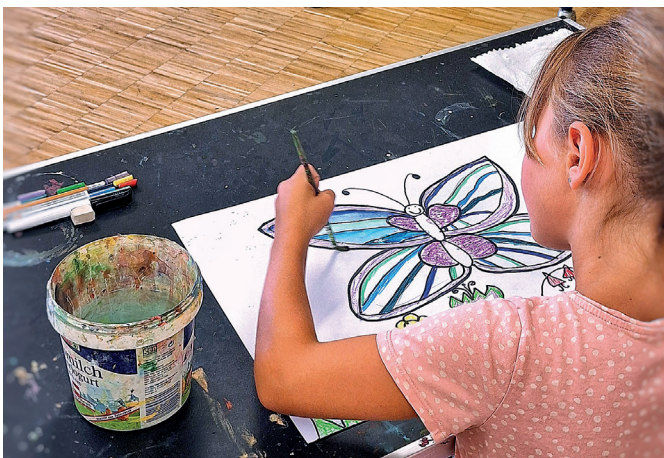
Auch heuer fanden wieder mehrere Malwerkstätten statt. Die Kinder konnten ihre Zeichenfähigkeiten verbessern und viele neue Geheimnisse erfahren, die echte Künstler nutzen.