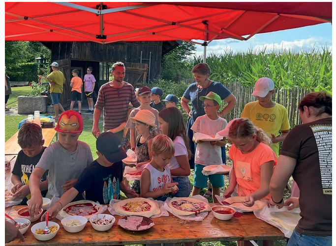
Zum Pizzabacken lud die SPÖ Bad Schallerbach ein. Die Kinder formten die Teiglinge und belegten diese mit allerlei leckeren Zutaten. Während der Wartezeit wurde im Pool geplantscht.