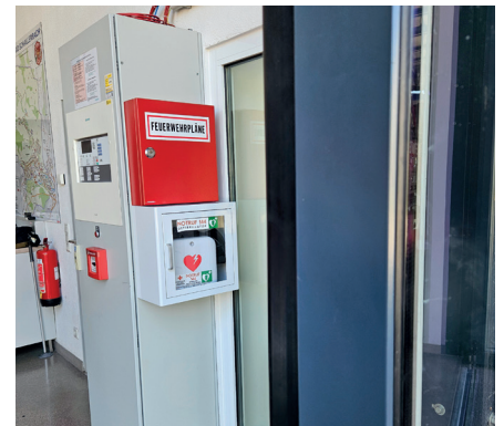
Ab Oktober ist im Eingangsbereich der Fahrzeughalle bei der Feuerwehr ein Defibrillator öffentlich zugänglich durch das Drücken einer Notfalltaste.