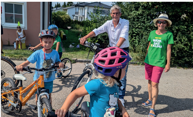
Beim "Kinderradspaß" der Grünen ging es darum, Spaß und Verkehrssicherheit zu vereinen. Das Erlernte konnten die 21 Kinder dann direkt auf den Parcours umsetzen.