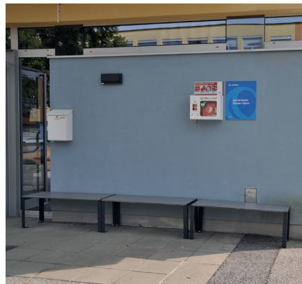
Neben dem Eingang zur Volksschule hängt ein Defibrillator, der stets zur Verfügung steht.