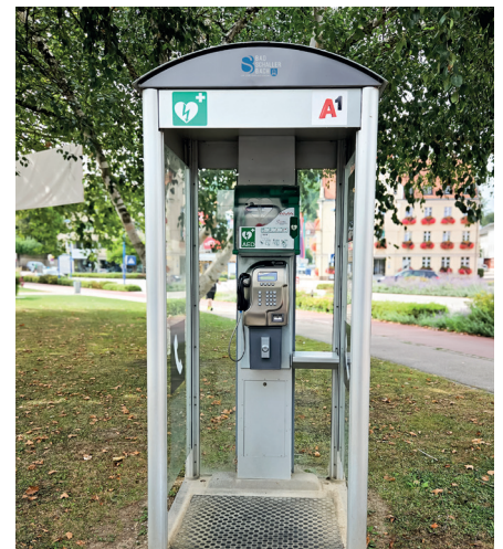
die Lebensretter-Säule am Rathausplatz