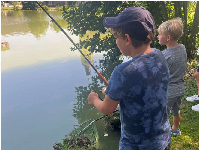
Zum "Fischen beim Moateich" wurde seitens der FPÖ Bad Schallerbach eingeladen. Dabei konnten so manche Angelerfolge verzeichnet werden.