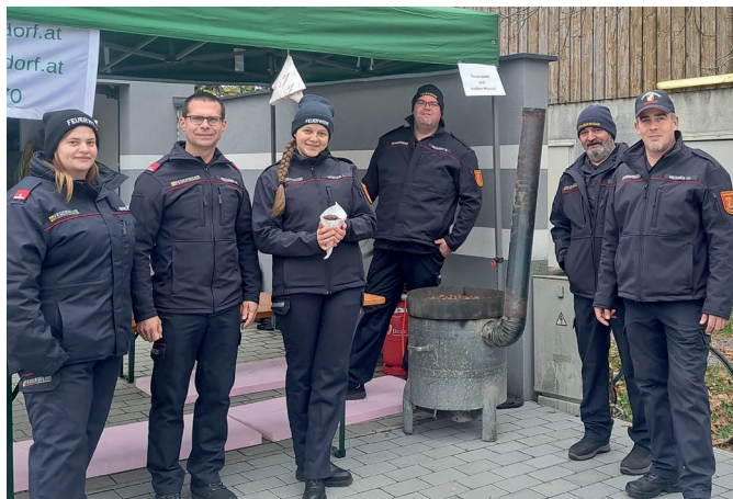
Die FF Nickelsdorf durfte die Gäste mit Maroni verköstigen.