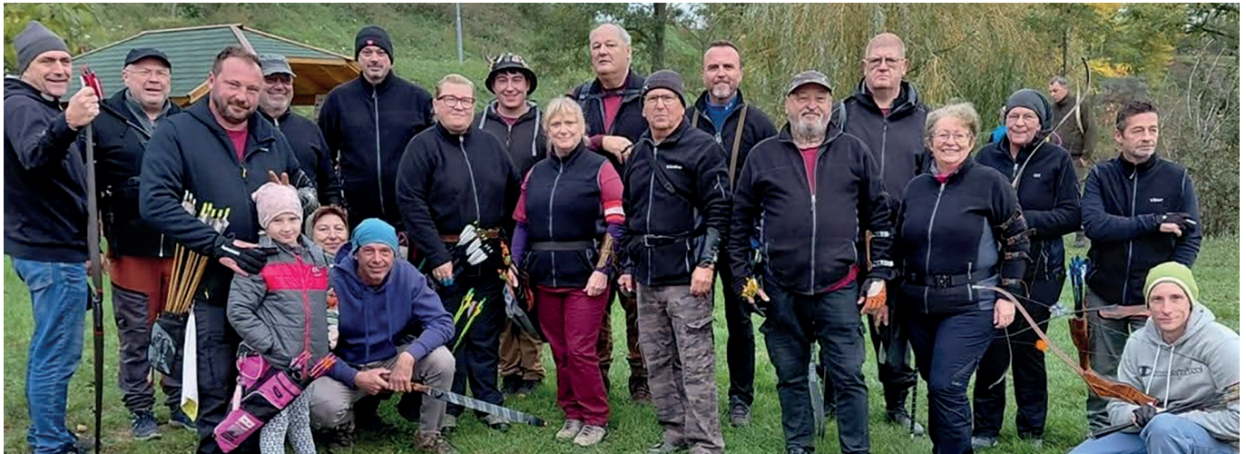
Text + Foto: BSV

Der BSV Nickelsdorf blickt stolz auf ein erfolgreiches Jahr 2025 zurück – und voller Motivation nach vorne!