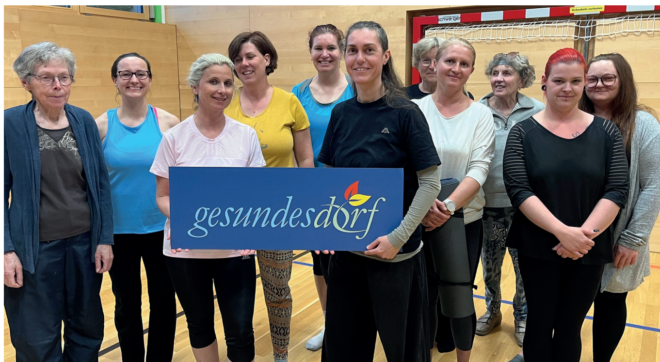
Text und Fotos: Volksschule

innere Ruhe finden und neue Kraft schöpfen kann. Die Teilnehmerinnen und Teilnehmer waren begeistert von den praxisnahen Anleitungen und der wohltuenden Atmosphäre. Viele äußerten den Wunsch nach einer Fortsetzung – ein Zeichen dafür, dass die Abende nicht nur entspannend, sondern auch nachhaltig bereichernd waren.