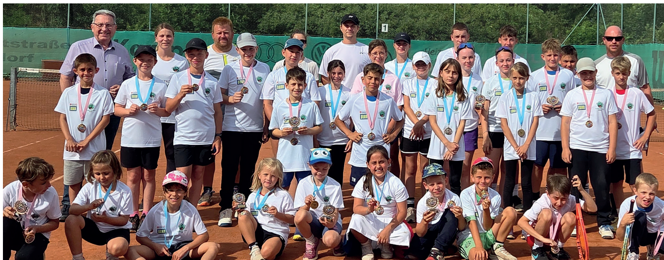
Text + Foto: Tennisclub

ein großer Erfolg für den Verein und ein starkes Zeichen für die Tennisbegeisterung in Nickelsdorf.