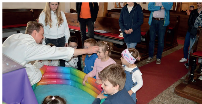
Text + Foto: Evangelische Pfarrgemeinde

So zeigte sich, dass Kirche Kunterbunt nicht nur ein Ort für Kinder ist, sondern für die ganze Familie: Ein Raum, in dem Glaube, Kreativität und Gemeinschaft auf wunderbare Weise zusammenfinden.