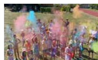
Wir bedanken uns recht herzlich bei den Vereinen und Firmen die dieses Jahr das Ferienspiel unterstützt haben.