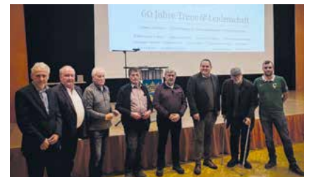
Ehrung 60 Jahre Mitgliedschaft