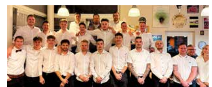
Weihnachtsfeier KM und Funktionäre