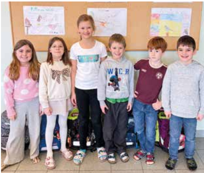
Vögel im Winter

Die 2. Klassen beschäftigten sich in den letzten Wochen intensiv mit dem Thema „Vögel im Winter“. Dabei lernten die Kinder verschiedene heimische Vogelarten kennen und erfuhren, wie diese die kalte Jahreszeit überstehen. Zum Abschluss gestalteten die Schülerinnen und Schüler kreative Plakate, die sie stolz präsentierten. Mit viel Begeisterung und Wissen zeigten die Kinder, was sie gelernt hatten.