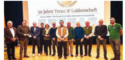
Ehrung 50 Jahre Mitgliedschaft