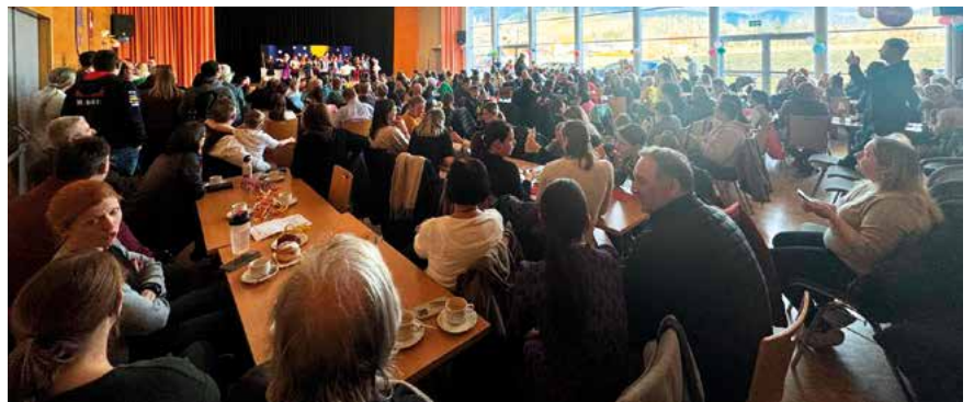
Volles Haus beim Faschingsfest