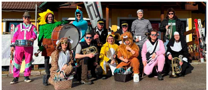
Der Faschingsamstag steht ganz im Zeichen der Guggamusi

Eintrittskarten sind in der Apotheke erhältlich!