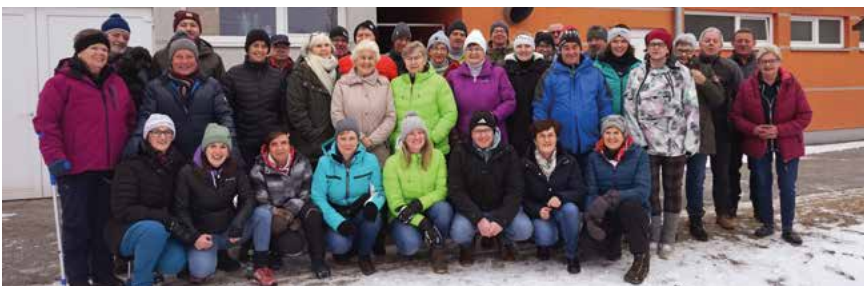
D'Walberger beim Sauschädleisschießen

Traditionsgemäß starteten die Walberger mit dem Sauschädl Eisschießen ins neue Jahr. So auch am 5. Jänner, wo viele Mitglieder der Einladung folgten. Trotz der schwierigen Wetterlage schafften es die Eismacher der Waldbahn und konnten dieses Jahr wieder auf Natureis den sportlichen Wettkampf starten. Nach einem spannenden, lustigen und unfallfreien steirischen Eisschießen fand das erste Treffen im neuen Jahr im Stüberl am Sportplatz seinen gemütlichen