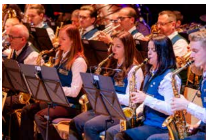
Beim Kirchenkonzert des Musikvereins...

Monate des Jahres stehen ganz im Zeichen des Frühjahrskonzertes am Palmwochenende . Der musikalische Höhepunkt des Jahres erfordert intensive, aber auch lohnende Probenarbeit. Schließlich soll bei den Konzerten jede Note richtig gesetzt werden, jeder Übergang getimed und jede Phrase so artikuliert werden, damit der Ausdruck und die Emotionen eines jeden Musikstücks auch im letzten Eck des Saales ankommen. Die diesjährigen Gäste sind heuer wie die belegten Brote in der Pause: regional. Der Chor „Nix fia unguat“ wird das Konzert mit bekannten Melodien und eingängigen Arrangements bereichern und vermutlich auch den einen oder anderen