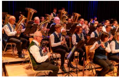
...war die Akustik der Kirche eine eigene Musikerin.