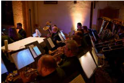
...wird der Musikverein ein hochklassiges Programm darbieten.

Monate des Jahres stehen ganz im Zeichen des Frühjahrskonzertes am Palmwochenende . Der musikalische Höhepunkt des Jahres erfordert intensive, aber auch lohnende Probenarbeit. Schließlich soll bei den Konzerten jede Note richtig gesetzt werden, jeder Übergang getimed und jede Phrase so artikuliert werden, damit der Ausdruck und die Emotionen eines jeden Musikstücks auch im letzten Eck des Saales ankommen. Die diesjährigen Gäste sind heuer wie die belegten Brote in der Pause: regional. Der Chor „Nix fia unguat“ wird das Konzert mit bekannten Melodien und eingängigen Arrangements bereichern und vermutlich auch den einen oder anderen