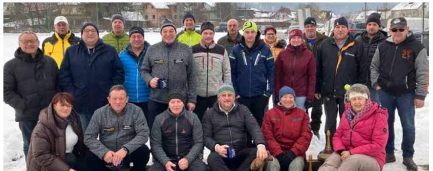
Dorfwirtshaus Petry und Cafe Barletti.

In der kalten Jahreszeit ist das Eisstockschießen ein beliebtes Hobby. Ob bei den Eisstockvereinen, wo interne Duelle ausgetragen werden, oder bei sonstigen Vereinen und Gasthäusern, die sich gegeneinander „matchen“. Und natürlich steht die Geselligkeit und die Freude am Sport in der Natur im Mittelpunkt. So fand auf der Eisbahn des ESV Waldbahn am Sportplatz das siebente „steirische Eisstockduell“ zwischen den Stammgästen vom „Cafe Barletti“ und dem „Dorfwirtshaus“ statt. Nach mehr