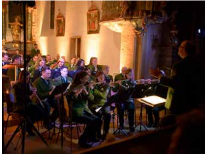
Beim Frühjahrskonzert am Palmwochenende...

Wenn die Tage wieder länger werden, werden auch die Freitage länger. Zumindest für die Musiker des Musikvereins Langenwang. Denn die ersten