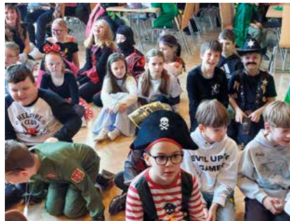
Faschingsfest im Volkshaus

ateraufführung und Darbietungen der einzelnen Klassen fand eine Zaubershow und ein buntes Narrentreiben mit Spiel und Spaß statt. Das Lehrerteam bedankt sich im Namen aller Kinder ganz besonders herzlich beim Elternverein für die Organisation dieses Festes!