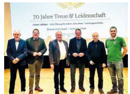
Ehrung 70 Jahre Mitgliedschaft