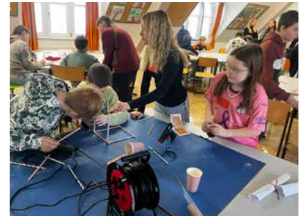
Tag der offenen Tür