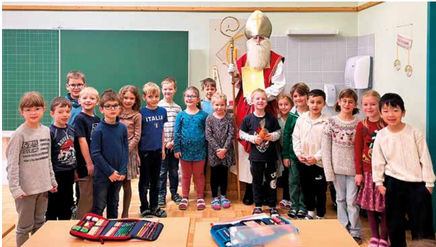
Besuch vom Nikolaus

Am 5. Dezember bekamen die Schüler Besuch vom Nikolaus . Alle Kinder wurden mit einem Sackerl gefüllt mit Süßigkeiten, Nüssen und Mandarinen beschenkt. Die Schülerinnen der 1a Klasse freuten sich besonders darüber, dass sie den Nikolausstab halten durften.