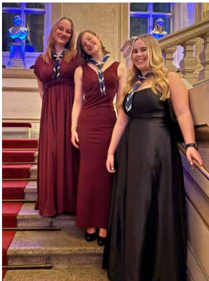
Pfadfinderball Palais Auersperg Wien

Die Guides und Späher (10-14 Jahre, Heimstunden samstags 15:00) erlebten wie immer ein sehr abwechslungsreiches Programm. Inmitten von Spielen, dem Stärken des Teamworks und dem Erlernen von verschiedenen Fertigkeiten im Wald dürfen Abenteuer nicht fehlen. Im Jänner durften sie etwas Besonderes erleben: eine „Wanderung“ zu den Seehütten der Pfadfindergruppe am Neusiedlersee . Aufgrund der tiefen Temperaturen wies der See eine sehr dicke Eisdecke auf, welche gefahrlos betreten werden konnte. Das letzte Mal, als das möglich war, war vor ungefähr zehn Jahren! Vom Hafen in Rust (leider im dichten Nebel) ging es flott in Richtung der Seehütten, in denen die mitgebrachte Jause verzehrt werden konnte. Die Guides und Späher konnten sich auf Europas größtem Eislaufplatz richtig austoben! Am 22. Februar ist der World Thinking Day der Pfadfinderbewegung, an dem der Geburtstag des Gründers, Robert Baden Powell, gefei-