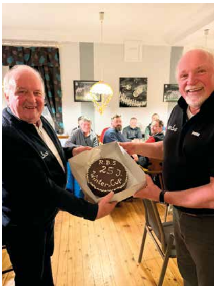
25 Jahre Kunsteisanlage Langenwang