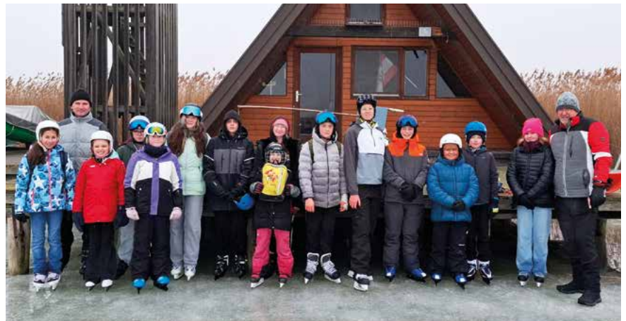
Ein ganz besonderes Abenteuer

ert wird. Um ihn auch in Langenwang zu feiern, machten die GuSp bei der deutschsprachigen Postkartenaktion mit, bei der sie Postkarten an andere Gruppen schrieben und dafür selbst auch welche bekommen.