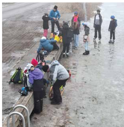
Alle sind startklar