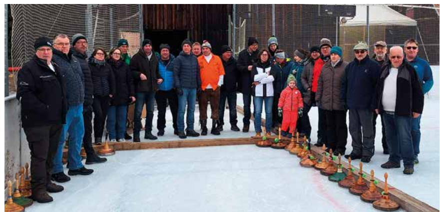
Schützenverein gegen Sowieso