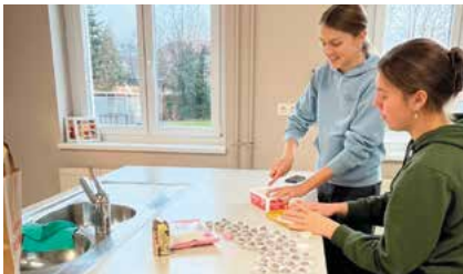
In der Backstube wurden leckere Kekse gezaubert

Mit einer gemütlichen Weihnachtsfeier im Gasthaus Sowieso ließ die Landjugend die Adventszeit ausklingen. Zur Einstimmung der Feier wurden bereits im Vorfeld in der Küche der Mittelschule Langenwang fleißig Kekse gebacken, die bei der Weihnachtsfeier verspeist wurden. Im Gasthaus sorgten weihnachtliche Stimmung sowie gutes Essen für ein angenehmes Beisammensein. Ein Highlight war wieder das Schrottwichteln, bei dem originelle Geschenke den Besitzer wechselten. Die Weihnachtsfeier war eine schöne Gelegenheit für Austausch, Gemeinschaft und geselliges Beisammensein.