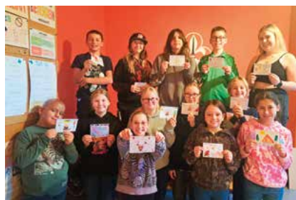
Postkartenaktion zum Weltpfadfindertag