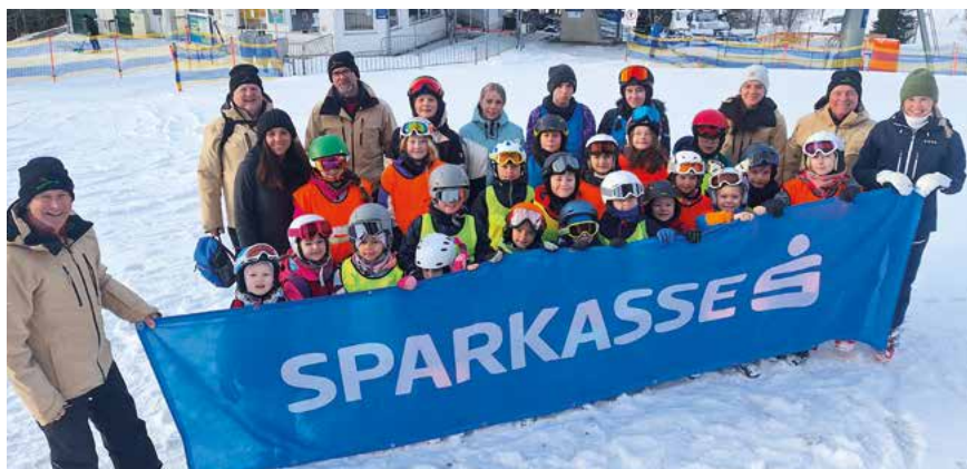
Gruppenfoto Skikurs Semesterferien

Dank gilt auch allen Eltern und Kindern für das entgegengebrachte Vertrauen! Berg frei!