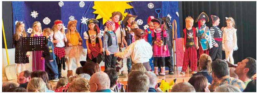
Darbietung der Kinder

Im Rahmen der Zusammenarbeit des Elternvereins und der Volksschule Langenwang wurde das erste Faschingsfest mit Darbietung eines Theaterstücks der 3. und 4. Klassen veranstaltet. Zusätzlich durften sich Eltern, Großeltern sowie die heurigen Schulanfänger über Gedichte und einstudierte Tänze und Lieder der anderen Klassen erfreuen. Als magischen Abschluss ließ „Zauberer Gabriel“ den gelungenen Nachmittag bei vollem Haus ausklingen.