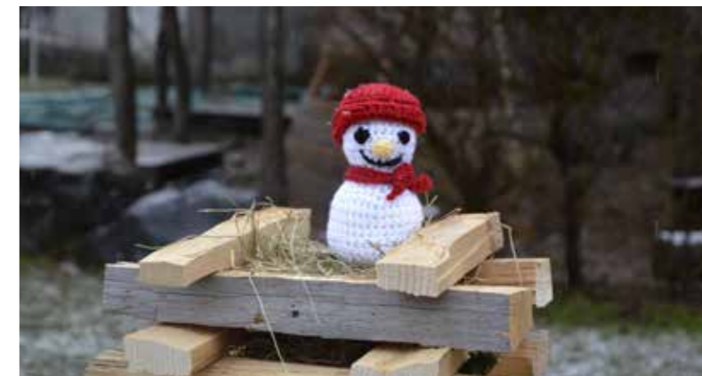
Der Funken im Kindergarten, mit einem kleinen Schneemann an der Spitze wurde zu einem schönen Fest für die Kinder.

Der Waldplatz ist für alle ein Ort voller Abenteuer, Lernen und Gemeinschaft. Er ist sehr beliebt und ermöglicht den Kindern, die Natur mit allen Sinnen zu erleben, Selbstvertrauen zu entwickeln und jeden Tag ein kleines Stückchen mehr über ihre Umwelt zu erfahren.