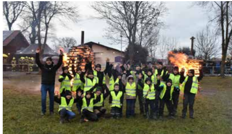
Das Funkenbauteam baute drei Kinderfunken.