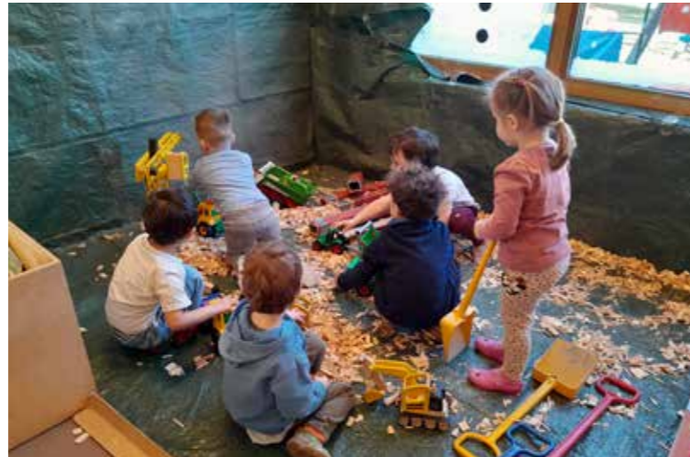
In der Hackschnitzlecke wird eifrig gebaut und transportiert.

So sammeln die Kinder täglich neue Erfahrungen, stärken ihre Selbstständigkeit, üben soziale Kompetenzen und lernen spielerisch die Welt um sich herum besser kennen.