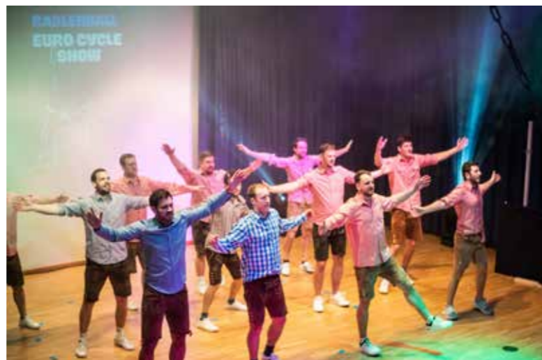
Ein buntes Showprogramm mit verschiedenen Tanzeinlagen erwartete das Publikum.

Der Radlerball 2026 war auch in diesem Jahr wieder ein voller Erfolg. Der ARBÖ RC Meiningen bedankt sich herzlich bei allen Mitwirkenden, Helfer:innen sowie bei den zahlreichen Gästen, die zum Gelingen dieses stimmungsvollen Abends beigetragen haben.