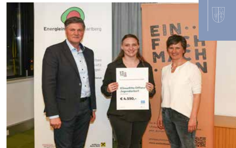
Das Projekt „Klimafitte OJA“ wurde durch den Klima- und Energiefonds sowie den Kleinprojektfonds von „einfach machen“ unterstützt.