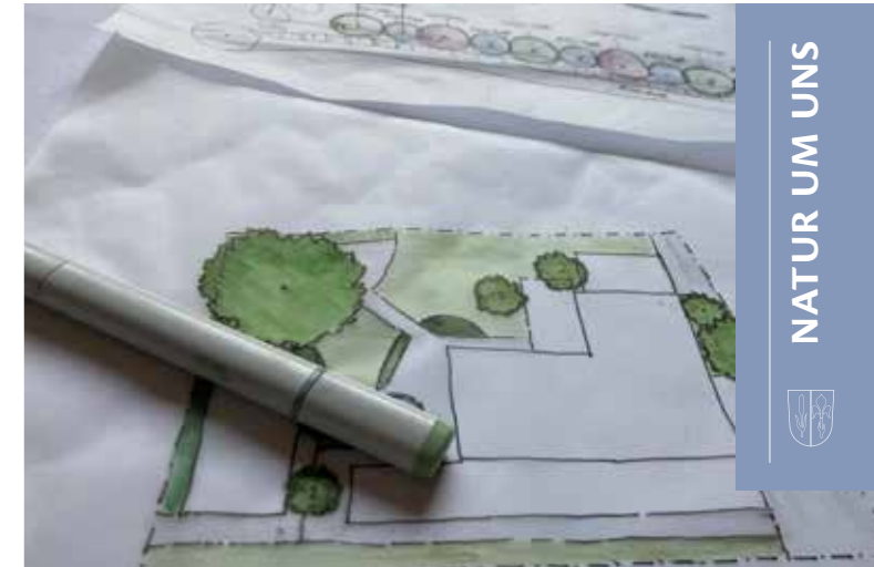
Gartenplanung mit ausreichend Platz für die Baumkronen.