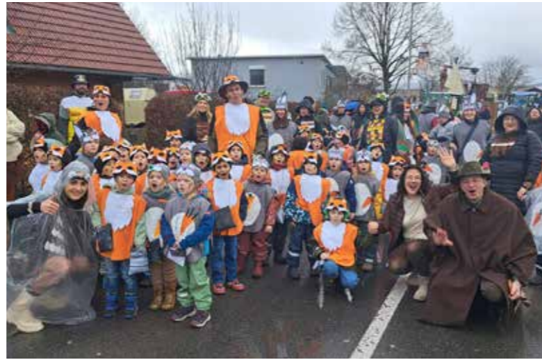
Die Kinder des Kindergarten Meiningen waren als "Waldtiere" verkleidet.