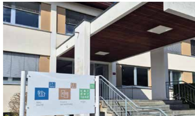
Das Team der Baurechtsverwaltung hilft bei Fragen gerne weiter.

Die Biotopexkursionen werden in Zusammenarbeit mit engagierten Vorarlberger Gemeinden angeboten. Weitere Informationen unter www.umweltv.at/veranstaltungen .