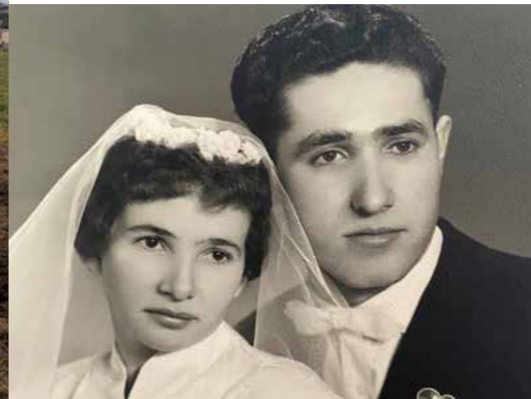
Das glückliche Paar an ihrem Hochzeitstag im Jahre 1961.

Mit den Jahren wurde die Familie größer: Enkelkinder und sogar Urenkel bereichern das Leben des Jubelpaares.