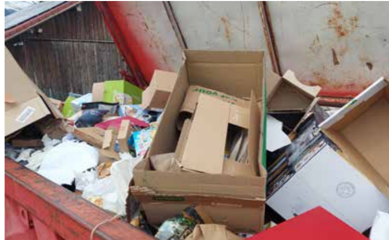
Der Papiercontainer beim Bauhof Meiningen ist des öfteren überfüllt. In Zukunft gibt es diesen Container nicht mehr.

Für die Gemeinde entstehen einmalige Investitionskosten in Höhe von rund 30.000 Euro, die im Budget 2026 vorgesehen sind. Somit leistet die Gemeinde einen wichtigen Beitrag zum Umwelt- und Klimaschutz sowie zu einer zukunftsorientierten Weiterentwicklung einer modernen kommunalen Infrastruktur. Mehr Details und Informationen zum Thema Papiertonne erfolgen zeitnah in einer Postwurfsendung sowie auf Cities.