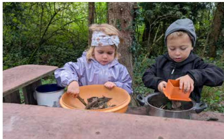
In der Matschküche und beim Messen die Natur erleben.