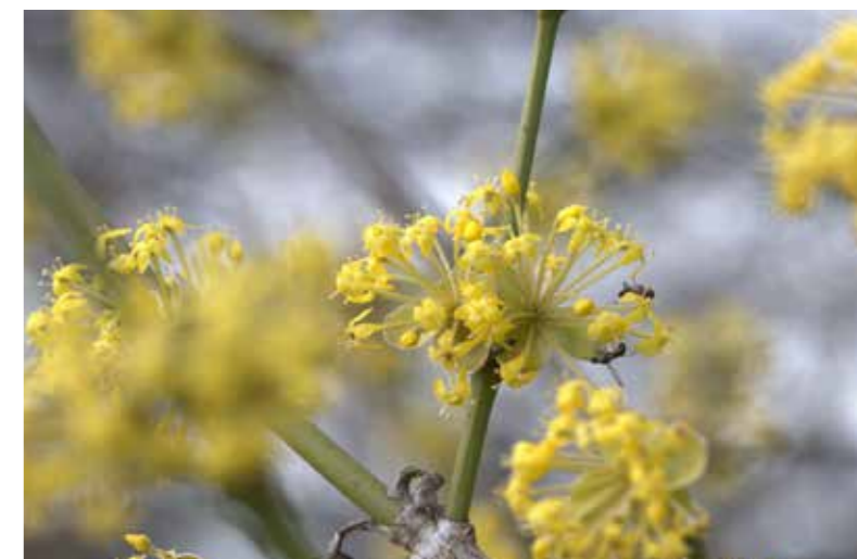
Die Kornelkirsche als eine der ersten Frühlingsboten.