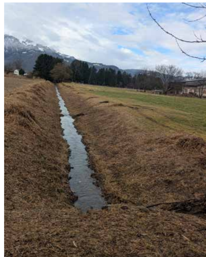
Entlang der Bachufer wird gemäht um einen ungehinderten Wasserabfluß sicherzustellen.