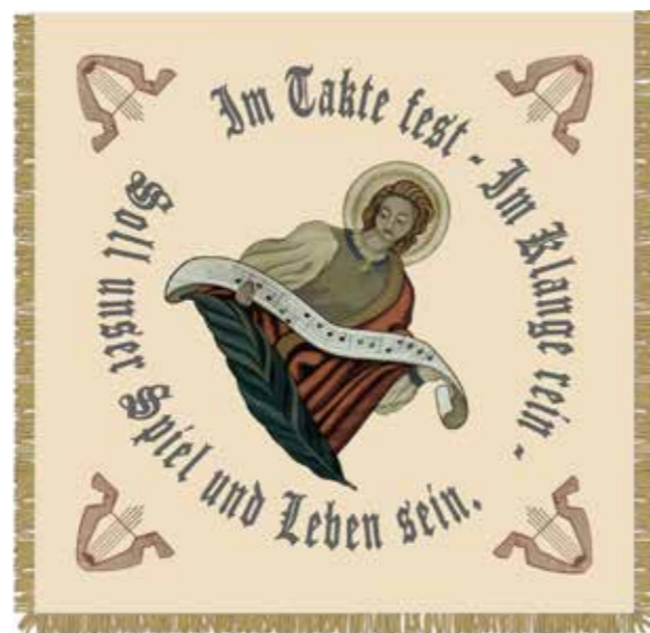
Die Fahne ist liebevoll gestaltet und begleitet den Musikverein seit 1964.