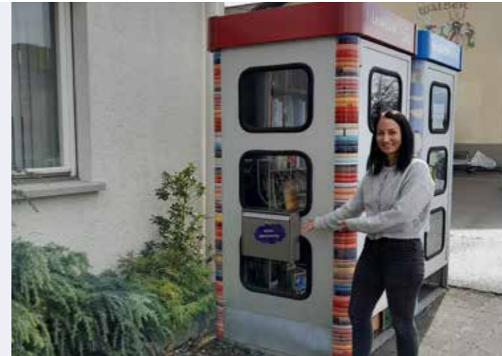
Der Ideenbriefkasten wartet auf eure Ideen und Anregungen.

Der Ideenbriefkasten der Gemeinde wartet auf eure Ideen, Wünsche und Anregungen.