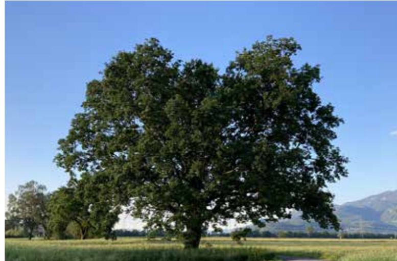
Eindrucksvolle alte Eiche als wertvolles lebendiges Ökosystem.

Darüber hinaus haben Bäume positive Effekte für Menschen und Umgebung. Sie verbessern das Mikroklima, kühlen die Umgebung, steigern das Wohlbefinden, reduzieren Stress und verleihen jedem Grundstück oder öffentlichen Bereich eine besondere Atmosphäre.