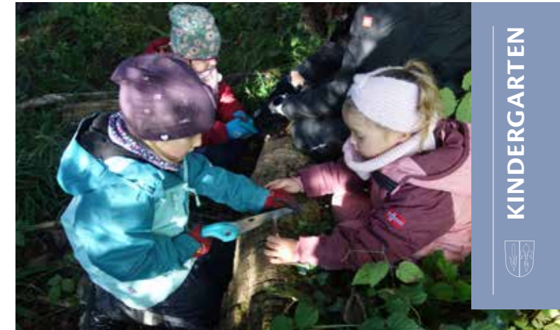
Die Kinder können den Umgang mit Werkzeug erproben, wie hier mit einer Säge.