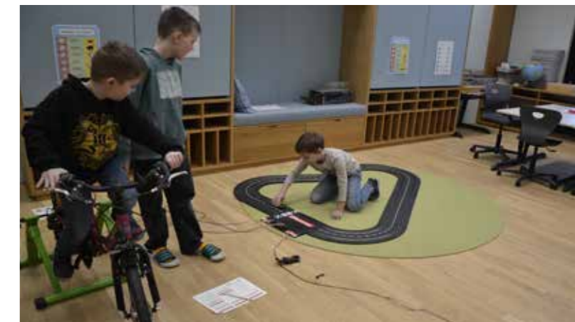
Die Kinder experimentierten an den verschiedenen Stationen.

Auch die Kraft der Sonne wurde mithilfe von Solarspielzeug erforscht. An einer anderen Station untersuchten die Kinder, durch welche Materialien Strom fließen kann – leitende Materialien ließen ein Summen erklingen, während bei nichtleitenden Materialien kein Geräusch zu hören war. Außerdem wurde die Kraft des Windes getestet: Dabei probierten die Kinder aus, ob eine Zeitung am Körper kleben bleibt, wenn man geht, läuft oder rennt. Der MINT-Entdeckertag machte den Schüler:innen großen Spaß und weckte ihre Neugier für Naturwissenschaft und Technik.