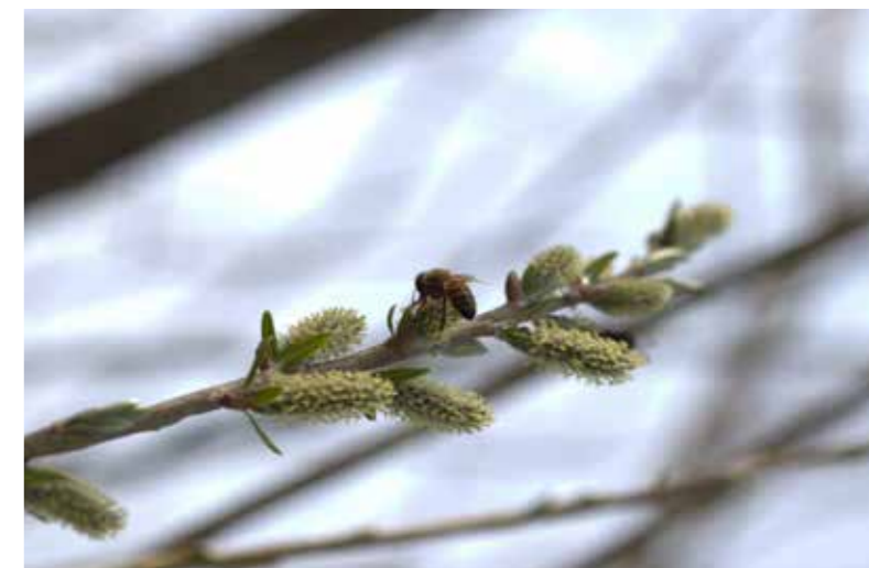
Die Weide als wichtiger Pollenlieferant für Insekten.