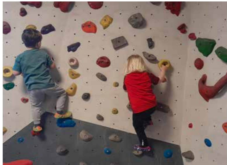
Beim Besuch in der Boulderhalle kann nach Herzenslust gekraxelt werden.

Die Kinder und Pädagog:innen freuen sich auf einen weiterhin sonnigen Frühling mit vielen gemeinsamen Erlebnissen.