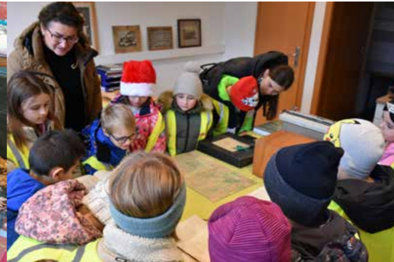
Die Schüler:innen der Volksschule Meiningen bestaunten die ausgestellten Schriftstücke.