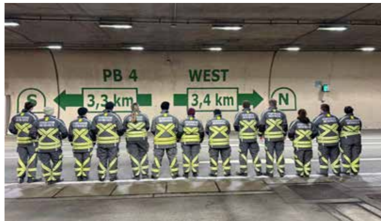
Tunnelbesichtigung mit der ASFINAG. | Foto: Ortsfeuerwehr Meiningen

Werner Pümpel engagiert sich seit 60 Jahren bei der Ortsfeuerwehr Meiningen. | Foto: Ortsfeuerwehr Meiningen