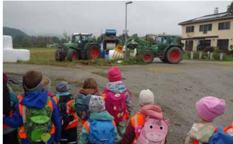
Die großen Maschinen werden bestaunt und beobachtet.

Am Waldplatz fühlen sich alle besonders wohl. Dort kann in der Grillschale ein Feuer gemacht werden, Würstchen gegrillt oder ein warmer Punsch getrunken werden. Manchmal wird auch einfach ein wärmendes Feuer genossen und gemütlich zusammengesessen. Diese Momente stärken das Gemeinschaftsgefühl und schaffen unvergessliche Erinnerungen.