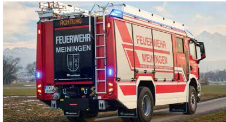
Das neue Löschfahrzeug der Feuerwehr Meiningen.

Am 20.06.2026 lädt die Ortsfeuerwehr herzlich zur Fahrzeugsegnung mit anschließendem Dämmershoppen ein. Das Fahrzeug ist ein MAN mit 4.000 Litern Wasser und 200 Litern Schaummittel an Bord, ausgebaut von der Firma Rosenbauer – ein beeindruckendes Stück Technik und Handwerkskunst! Für Stimmung ist gesorgt – mit musikalischer Begleitung, großem Festzelt, Weinlaube, Bar und natürlich der spektakulären Fahrzeugpräsentation. Die Ortsfeuerwehr freut sich auf euch.