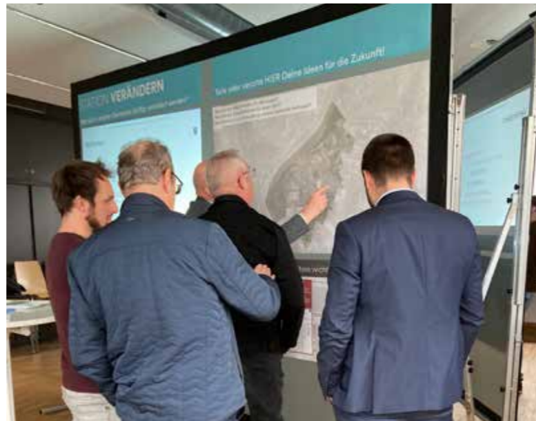
Bei den Informationsveranstaltungen konnte jeder sich einbringen.

Auch die Weiterentwicklung der Infrastruktur – insbesondere in den Bereichen Mobilität und Nahversorgung – nimmt eine zentrale Rolle ein. Kurze Wege, gute Erreichbarkeit und eine gesicherte Grundversorgung sind wesentliche Faktoren für die Lebensqualität der Bevölkerung. Als Teil der regionalen Kooperation im Rheintal ist Meiningen in einen abgestimmten Planungsprozess eingebunden.