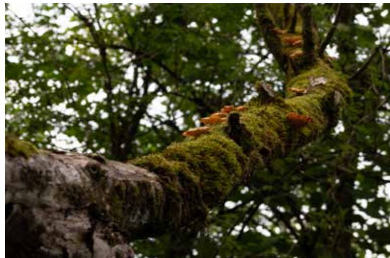
Oben: Mit Moos und Pilzen bewachsener Baum. Unten: Altes Holz als Nahrungsquelle für Spechte.