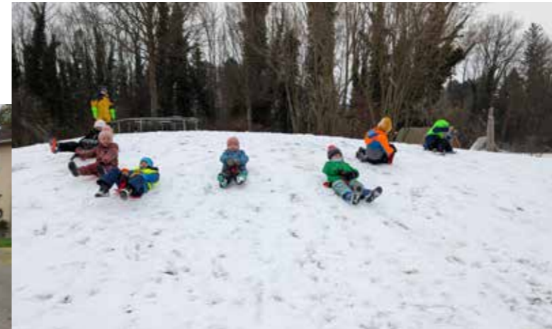
Im Winter wurde der Schnee ausgiebig zum Rutschen genutzt.