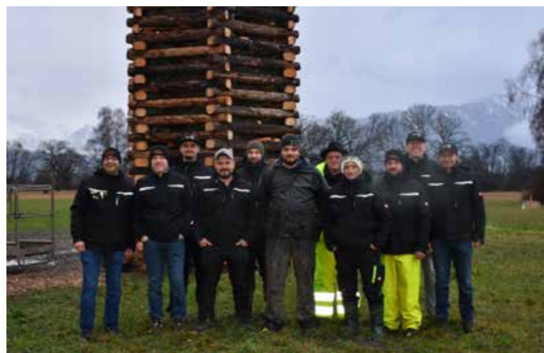
Die Funkenzunft Meiningen trotzte dem nasskalten Wetter.

Im Verlauf des Abends brannte der Funken zunächst bis etwa zwei Drittel der Höhe, bevor er einstürzte. Zu diesem Zeitpunkt hatte die Hexe noch nicht Feuer gefangen, das Feuerwerk war bereits gezündet und viele Besucher:innen rechneten bereits mit einer sogenannten Hexenbeer-digung. Schließlich kam es doch noch anders: Um 20:30 Uhr knallte es überraschend und sorgte so für großen Applaus und Erleichterung bei den zahlreichen Zuschauer:innen.