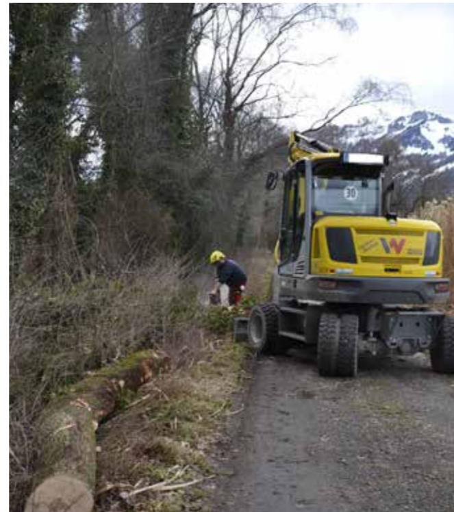
Holzarbeiten beim Ehbach-Kanal.

Durch diese Maßnahmen stellt die Gemeinde die laufende Pflege und Instandhaltung der Bäche und Gewässer sicher, stärkt die Sicherheit und trägt zum Erhalt der natürlichen Lebensräume bei.