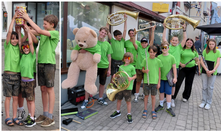
Die KLAMMAuken beim Young Brass Festival in Neunkirchen

Um die Spielestationen und Verpflegung besser planen zu können, bitten wir um Anmeldung bei Christina Steiner unter 0664 232 63 42.