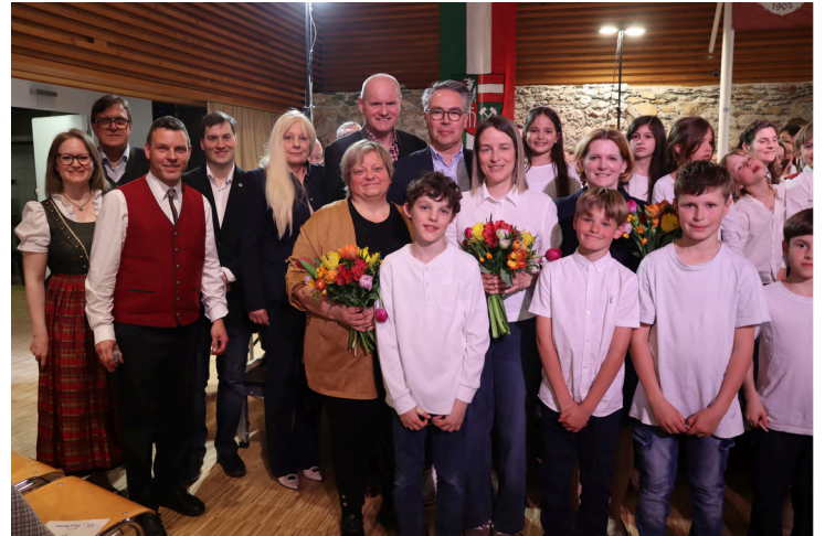
(Text/Foto © MV Kreuzberg)

Zum Abschluss musizierten der Kreuzberger Musikverein mit den KLAMMAuken und der Singklasse gemeinsam.