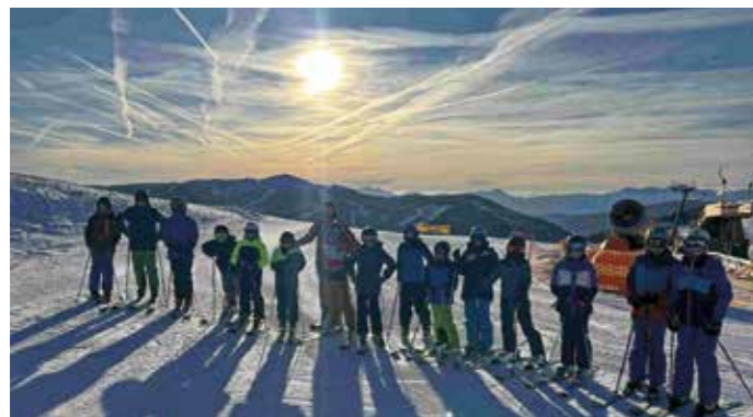
Wintersportwoche in St. Oswald