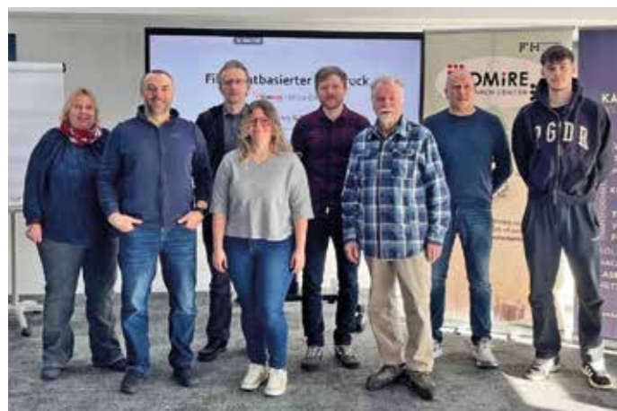
3D Druck - Lehrgang 1