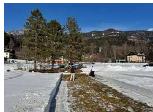
Schneeräumungsarbeiten am Sportplatz