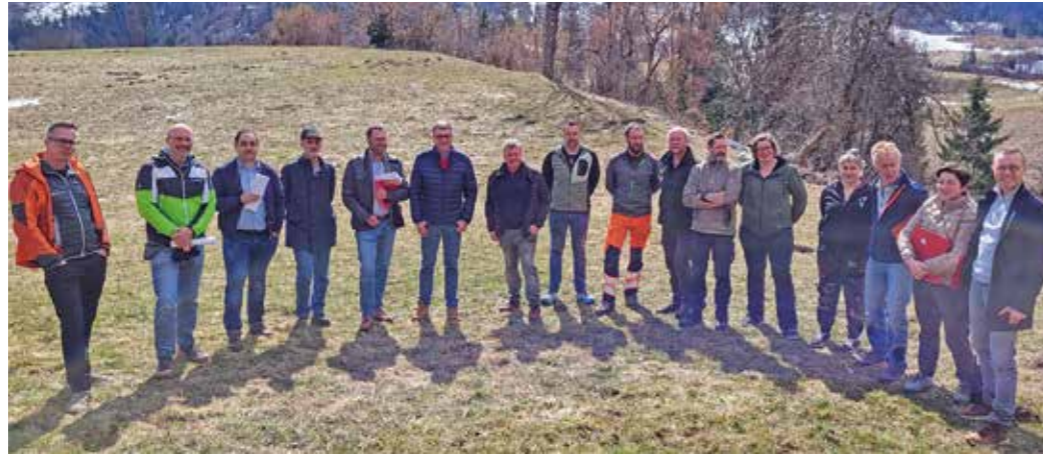
Ortsaugenschein mit der Vereinsgemeinschaft St. Jakob zur geplanten Sanierung der Veranstaltungsstätte