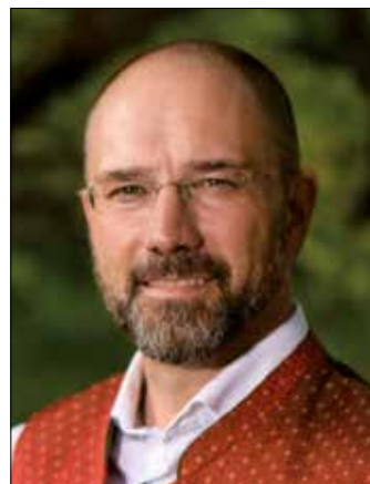
Bürgermeister Josef Zoppoth