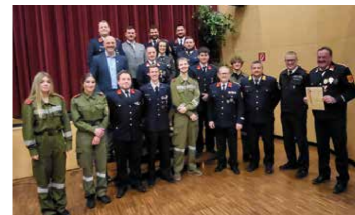
Jahreshauptversammlung der FF Kötschach-Mauthen mit Angelobungen und Ehrungen

Damit können unter anderem Straßen saniert, Hochwasserschutzprojekte umgesetzt, Schäden an Gebäuden behoben sowie gestalterische Projekte realisiert werden. Beispiele sind die Instandsetzung der Veranstaltungsstätte St. Jakob, die Anschaffung eines neuen Atemluftkompressors für die Feuerwehren oder die Errichtung des PV-Kraftwerks am Rathaus. Ebenso