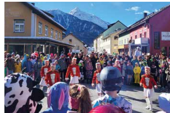
Faschingsumzug der Kindergärten und Schulen ins Zentrum von Kötschach

Eine große Hilfe dabei waren und sind zusätzliche