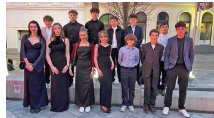
Wien-Aktion: Die 4c-Klasse vor dem Raimundtheater

Kurz vor Ostern gestaltete die 3m-Musikklasse mit Liedern im Klassenchor als auch in