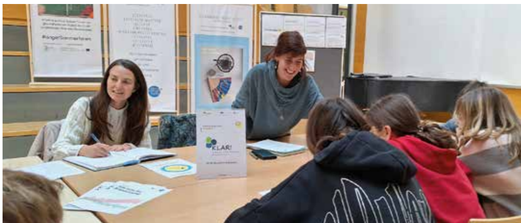
Workshop future jobs [school]

nachvollziehbar dokumentiert. Auch ein Cities-Kanal informiert über Veranstaltungen und aktuelle Themen. Seit Oktober 2025 ist zudem eine Folge des „ClimateCast“ des Klimabündnis online, die in Zusammenarbeit mit der KLAR! Karnische Anpassung am BORG Hermagor entstanden ist. Jugendliche setzten sich darin mit Klimagerechtigkeit und regionalen Auswirkungen auseinander und entwickelten persönliche „Klimawandel-Selfies“.