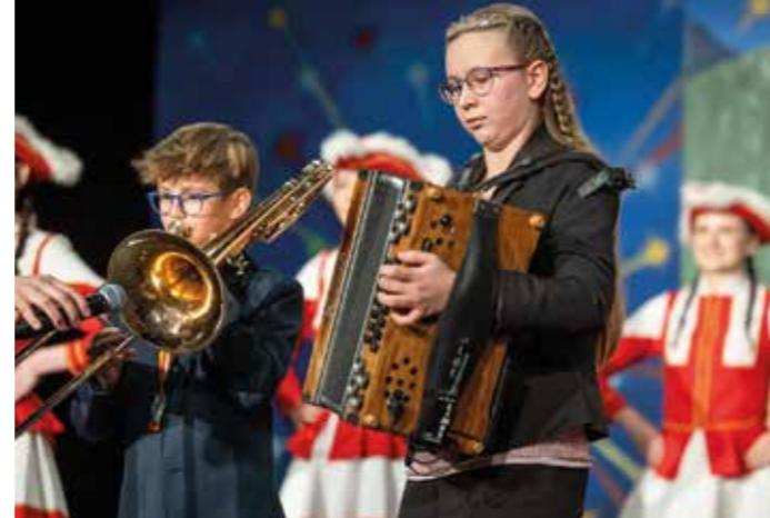
Das Kinderprinzenpaar spielte bei der Faschingssitzung auf