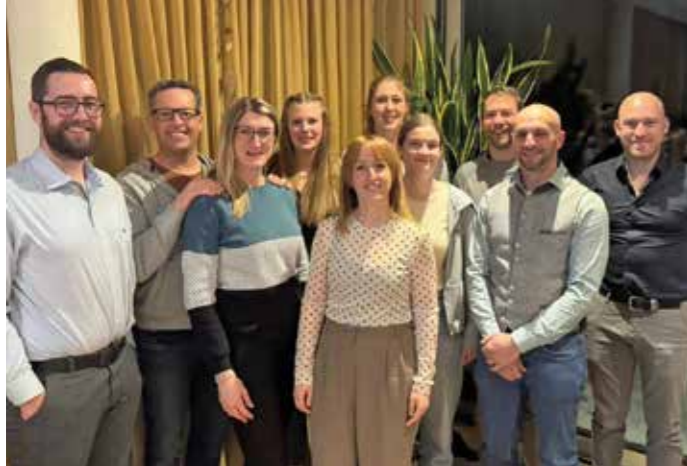
Der neue Vorstand der Trachtenkapelle Mauthen