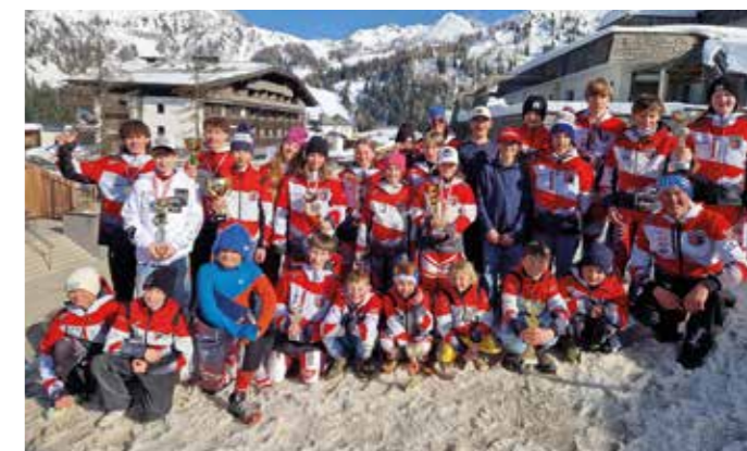
Sehr erfolgreich waren die jungen Sportlerinnen und Sportler beim Gailtalcup