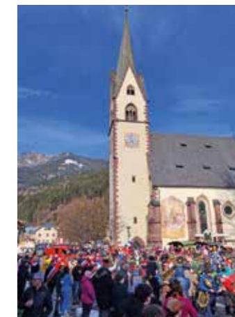
Großartiges Wetter und ausgelassene Stimmung beim Laaser Faschingsumzug

Ein besonderer Höhepunkt war der Laaser Faschingsumzug, der nur alle zehn Jahre stattfindet und zahlreiche Besucherinnen und