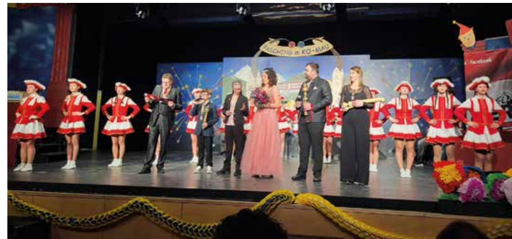
Die Faschingsgilde führte mit zwei großartigen Sitzungen durch die 5. Jahreszeit

Umso wichtiger ist es, dass wir unsere eigenen Möglichkeiten nutzen, um diese neuerliche Krise zu bewältigen. Wir leben in einem friedlichen und sicheren Land, und unsere Stärken sind der Zusammenhalt, die