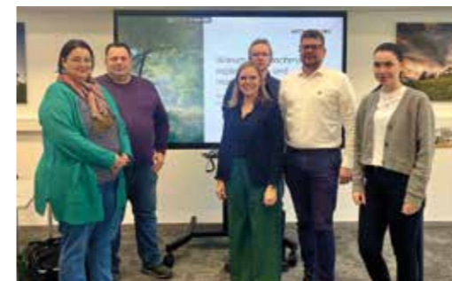
Gemeinsam für eine starke Region: „Natürlich Wir“ verbindet Betriebe und Menschen

Zwei Bildungsberaterinnen stehen vor Ort für individuelle Gespräche zur Verfügung. Der Beratungstag findet auch in Kooperation mit dem REGINA-Projekt für Wiedereinsteigerinnen