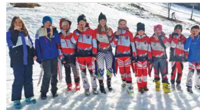
Erfolgreiche Teilnahme am Landesjugendskitag auf der Gerlitzen

Selbstverteidigungskurs. Es waren spannende und lehrreiche Stunden – doch alle waren sich einig: „Hoffentlich müssen wir das Erlernete nie anwenden!“