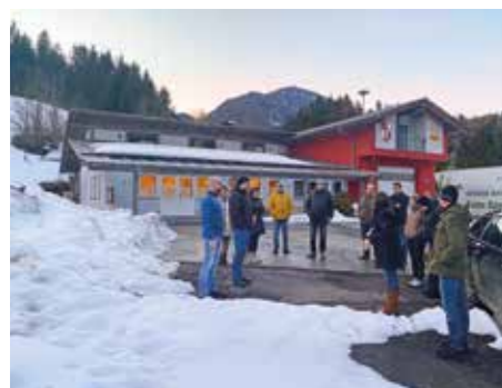
Angeregt und konstruktiv wurde am 26. Februar in Laas diskutiert, um den Ortskern und den Parkplatz beim Dorfgemeinschaftshaus zu verschönern

Auch ein zweites Vorhaben nahm Gestalt an: die Renaturierung eines Teils des Parkplatzes. Es soll ein gemütlicher Sitzgarten für das Dorfgemeinschaftshaus entstehen. Gleichzeitig soll damit ein Startpunkt für Wanderungen sowie ein schattenspendender Aufenthaltsplatz, insbesondere für Schulgruppen, geschaffen werden. Diese mussten bisher oft in der prallen Sonne bis zum Beginn der Wanderungen ausharren. Damit all das möglich ist, gilt der Marktgemeinde Kötschach-Mauthen sowie Manuel und Sabine Webhofer ein herzlicher Dank, da sie ihre Grundstücke für dieses Vorhaben zur Verfügung stellen.