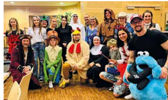
Traditioneller Kinderfasching der Bürgermeisterfraktion – herzlichen Dank allen HelferInnen!

In den vergangenen Wintermonaten konnten wir deut-