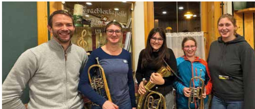
Neuzugänge bei der Trachtenkapelle

Aktuelle Informationen gibt es unter www.tk-mauthen.at und auf unserer Facebook Seite www.facebook.com/tkmauthen