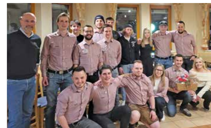
Die Burschenschaft Kötschach plant auch diesen Herbst wieder ein großes Event im Rathaussaal