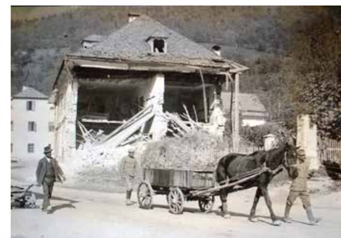
Kötschach 1915-1916: Schulhaus Richtung Strondia

Mit Unterstützung der Marktgemeinde Kötschach-Mauthen konnte das Museum – wie jedes Jahr – von Mitte Mai bis Mitte Oktober zu den regulären Öffnungszeiten für Besucher geöffnet werden. Die Kassatätigkeit und die Aufsicht im Museum wurden von zwei dafür angestellten Mitarbeitern im Wechseldienst übernommen.