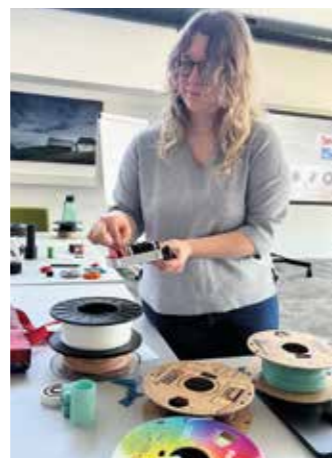
3D Druck - Lehrgang 2

ar 2026 in den Karnischen Werkstätten. Am 13. März fand bereits der nächste Praxistermin statt, bei dem die Teilnehmenden intensiv mit 3D-Scanning und digitaler Modellaufbereitung arbeiteten. Besonders spannend ist die vielfältige Zusammensetzung der Gruppe: Teilnehmende aus Handwerk, Handel, Technik, Tourismus und anderen Branchen arbeiten gemeinsam an ihren Projekten – und das generationenübergreifend. Genau diese Mischung aus Erfahrung, Neugier und unterschiedlichen Perspektiven macht den Kurs besonders lebendig.