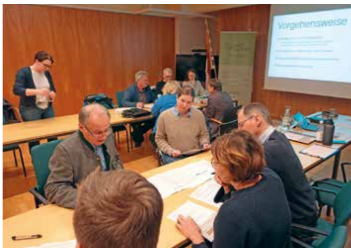
Planungswerkstatt „Lebensraum im Wandel“

Die Ergebnisse fließen nun als qualitative Bedarfserhebung in die Weiterentwicklung der Maßnahme „Klimastadt-Traum“ ein. Klimaanpassung wird damit nicht abstrakt diskutiert, sondern gemeinsam gedacht – von jenen, die die Region morgen prägen werden.