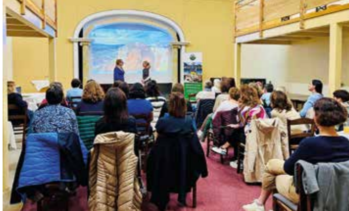
Toller Informationsabend der Gesunden Gemeinden zum Thema „Wechseljahre“ in der Thurner Säge

Trotz dieser Herausforderungen bin ich glücklich, in dieser Region und vor allem