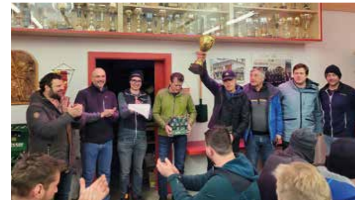
Beim FF-Gemeindeeisstockturnier in Würmlach konnte die FF St. Jakob als Veranstalter auch wieder den Siegerpokal mit nach Hause nehmen