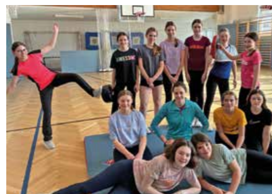
Selbstverteidigungskurs der 3m-Mädchen