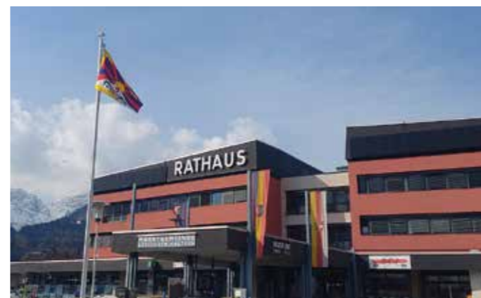
Mittlerweile ein vertrautes Bild, das ein Zeichen setzt: die Flagge Tibets weht für einige Tage im März vor dem Rathaus - in Tibet ist das Hissen der Fahne verboten