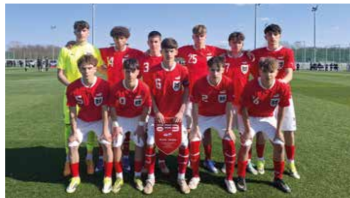
Das österreichische U15-Nationalteam spielt am 25. April in Kötschach-Mauthen gegen Rumänien