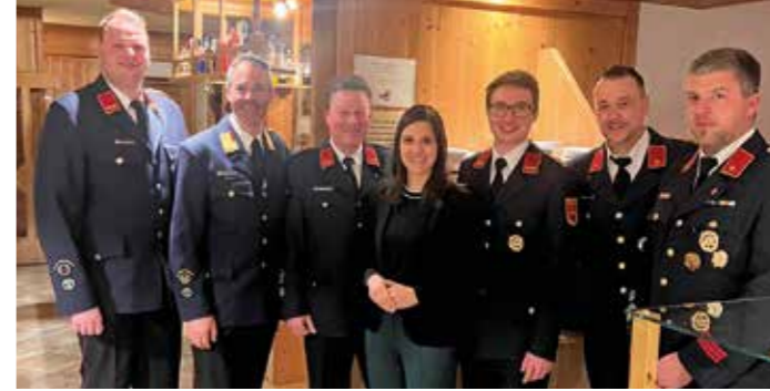
Die letzten Wochen standen mit den fünf Jahreshauptversammlungen unserer Freiwilligen Feuerwehren ganz im Zeichen des Ehrenamtes – herzlichen Dank an alle aktiven Feuerwehrfrauen- und Männer