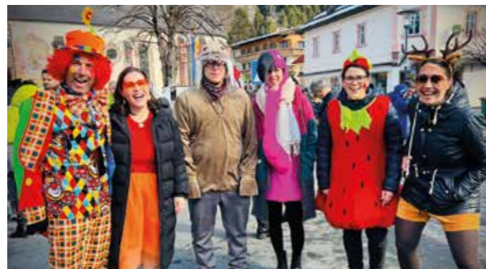
Auch die Lehrer:innen waren voll Elan beim Faschingsumzug dabei