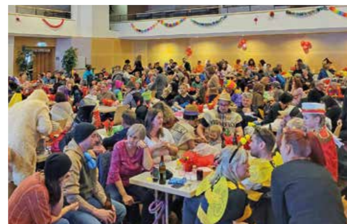
Traditioneller Kinderfasching für wohltätigen Zweck

vielfältig und kostenintensiv, dass wenig Spielraum für zusätzliche Gestaltung bleibt. Dazu zählen unter anderem die Erhaltung von Straßen und Wegen, die Trinkwasserversorgung, die Abwasser- und Abfallentsorgung, die Instandhaltung öffentlicher Gebäude sowie Vorsorgemaßnahmen in Bereichen wie Hochwasser-, Feuer- und Katastrophenschutz.