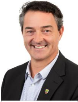
Bürgermeister Jochen Bous