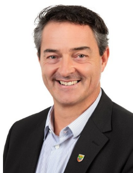
Bürgermeister Jochen Bous