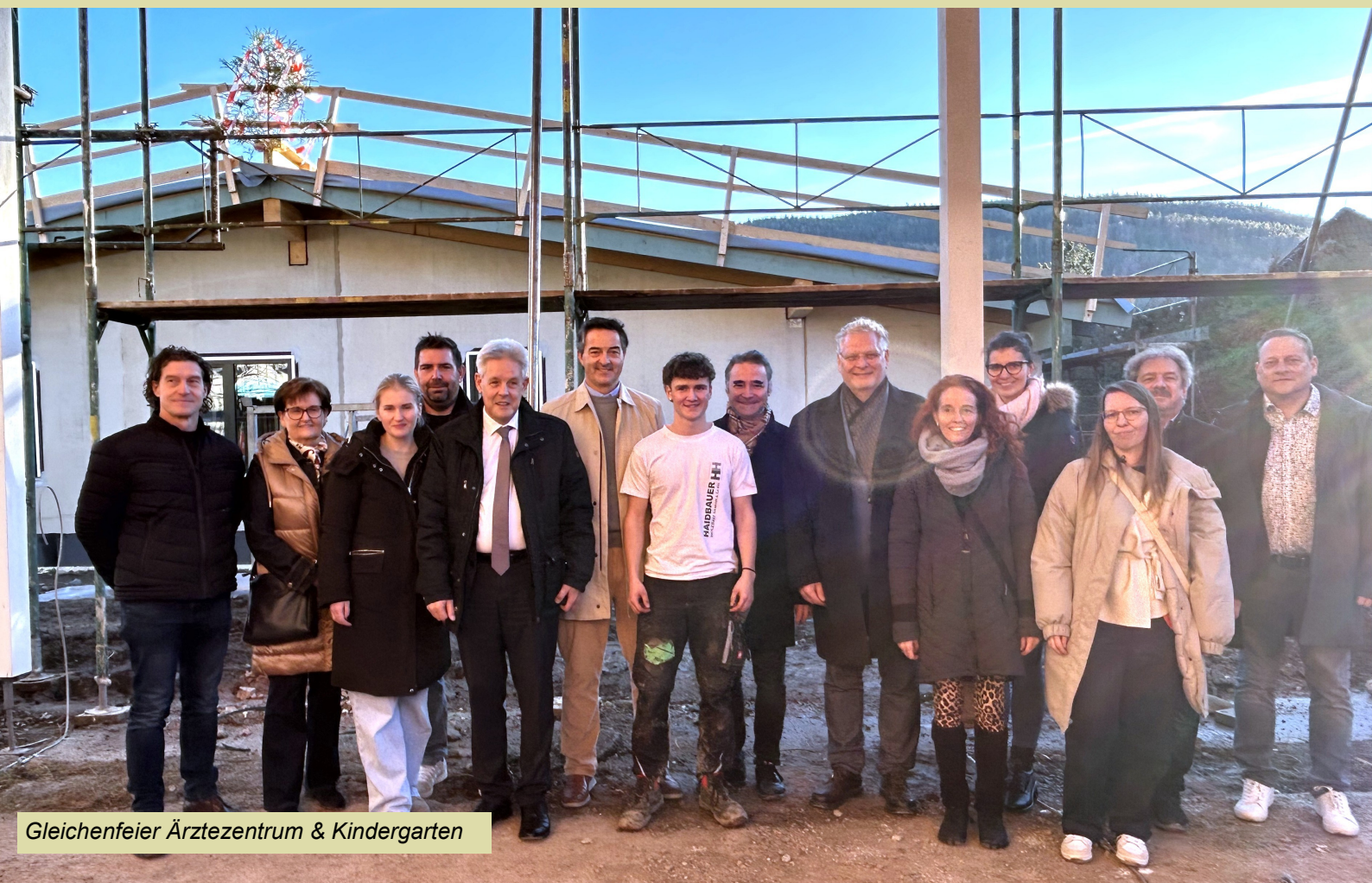
Gleichenfeier Ärztezentrum & Kindergarten

Amtliche Mitteilungen der Marktgemeinde Payerbach