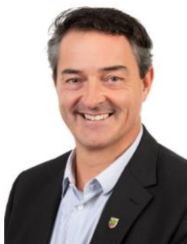
Bürgermeister Jochen Bous