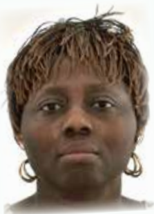
Jessie Boateng Musik-Mittelschule

Alles Gute für deine neue Aufgabe! Wir sind uns sicher, dass dir die Arbeit Freude macht und du unser Team großartig verstärkst!