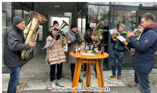
Blasmusiker beim Adventmarkt

Die Umgestaltung der Querung auf der Wolferner Landesstraße ist abgeschlossen und ermöglicht nun ein sichereres Überqueren. Die geplante 50-km/h-Beschränkung soll die Situation weiter verbessern.