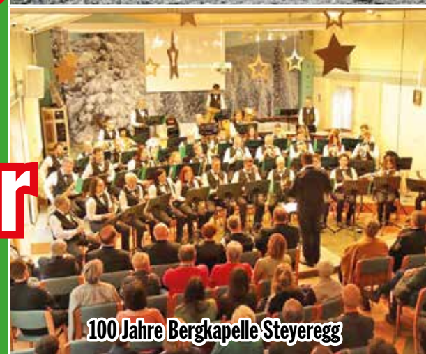
100 Jahre Bergkapelle Steyeregg