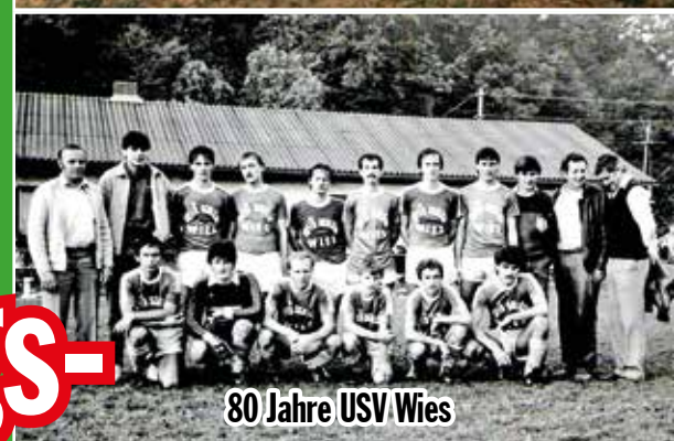
80 Jahre USV Wies