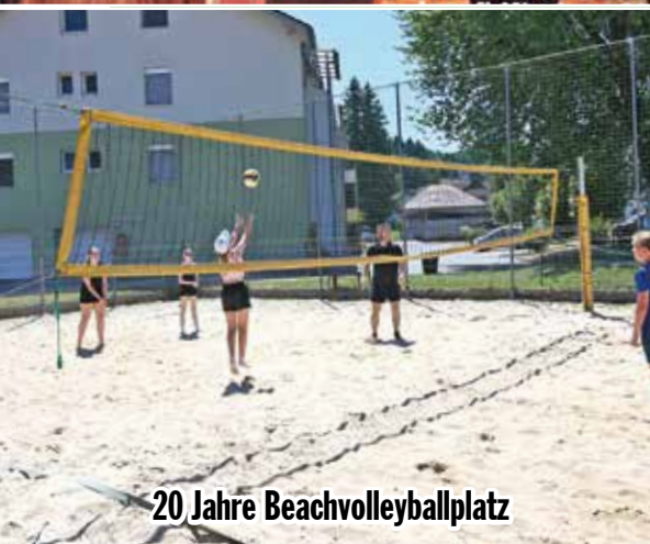
20 Jahre Beachvolleyballplatz