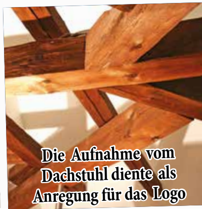
Die Aufnahme vom Dachstuhl diente als Anregung für das Logo