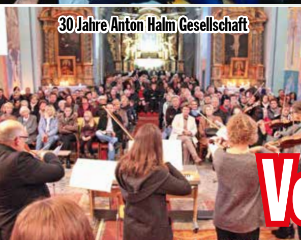
30 Jahre Anton Halm Gesellschaft