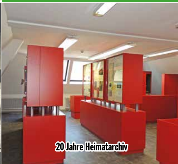
20 Jahre Heimatarchiv