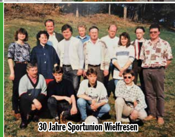
30 Jahre Sportunion Wiefresen