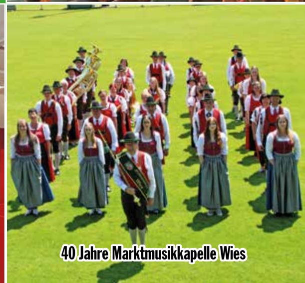
40 Jahre Marktmusikkapelle Wies