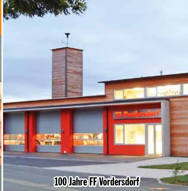
100 Jahre FF Vordersdorf