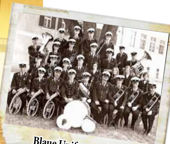
Blaue Uniform 1964