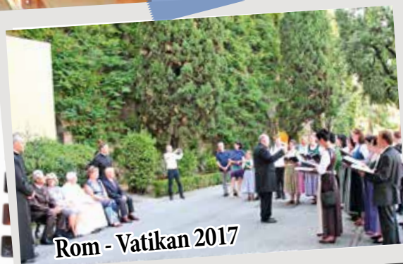
Rom - Vatikan 2017