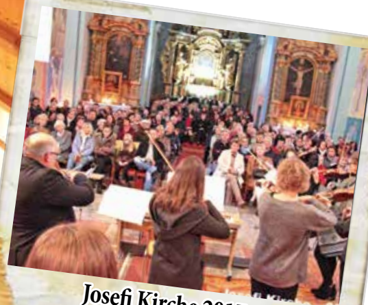
Josefi Kirche 2017