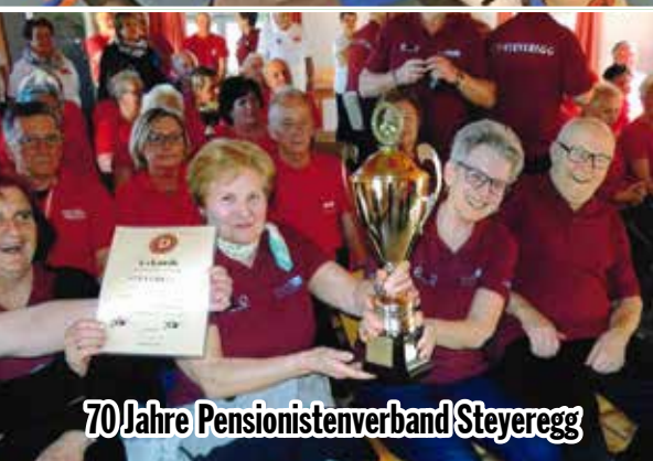
70 Jahre Pensionistenverband Steyeregg