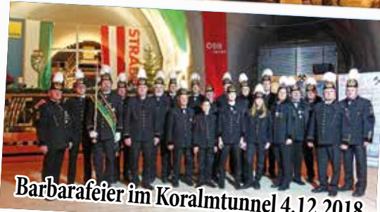
Barbarafeier im Koralmtunnel 4.12.2018