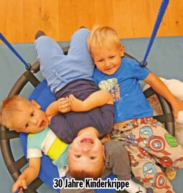
30 Jahre Kinderkrippe