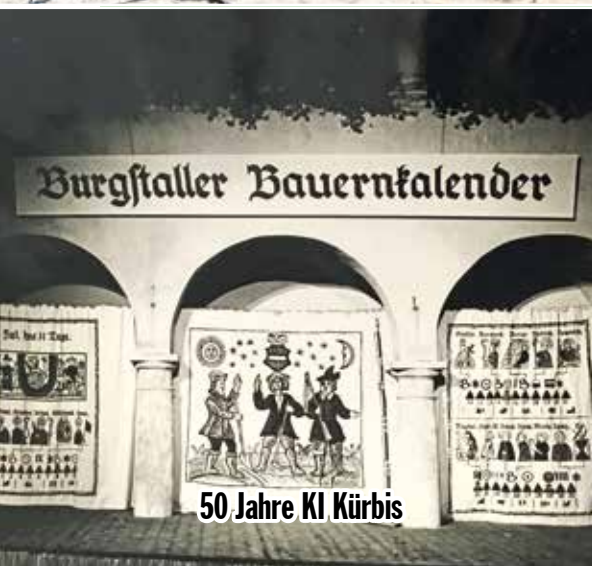
50 Jahre KI Kürbis