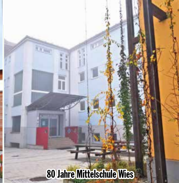
80 Jahre Mittelschule Wies