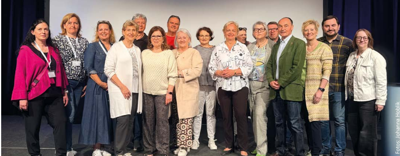
Die Kooperation des Gesundheitservices Brunn und der „Gesunden Gemeinde“ ermöglicht den Brunner Gesundheitstag, an dem zahlreiche Brunnerinnen und Brunner sowie Vertreterinnen und Vertreter der Gemeinden Brunn, Maria Enzersdorf und Perchtoldsdorf teilnehmen.