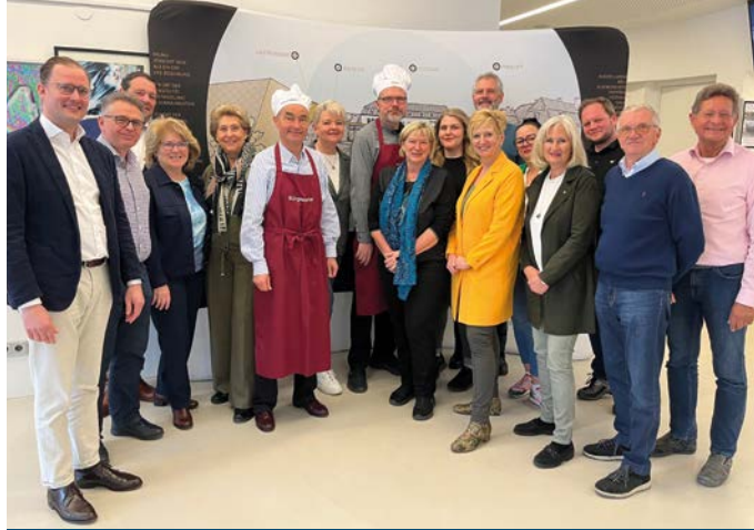
Auch zahlreiche Gemeinderätinnen und Gemeinderäte unterstützten die traditionelle Aktion.