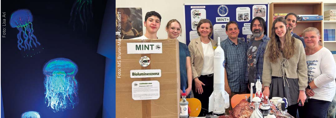
Die Mittelschule präsentierte u.a. ein Weltall- und ein Biolumineszenz-Projekt.