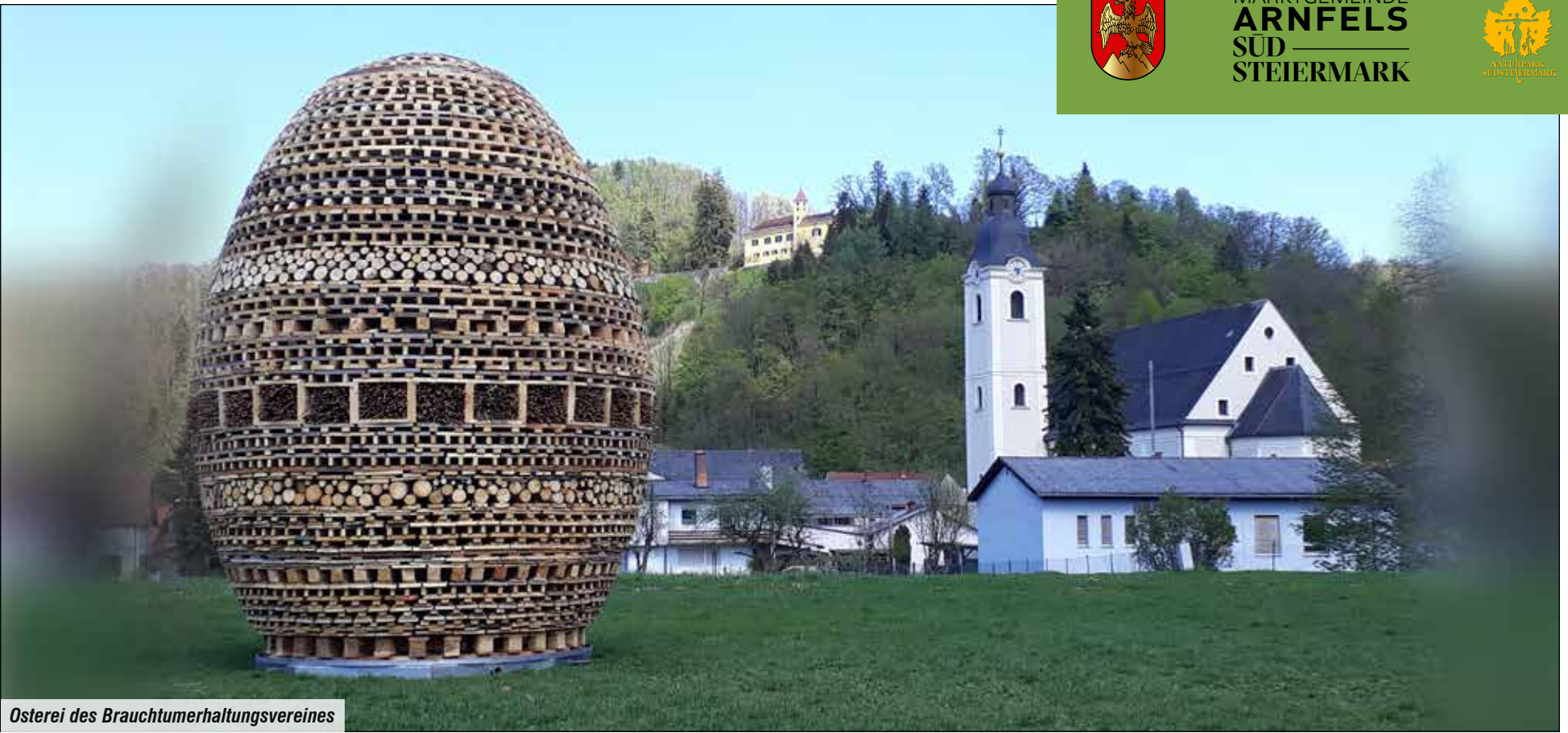
Osterei des Brauchtumserhaltungsvereines