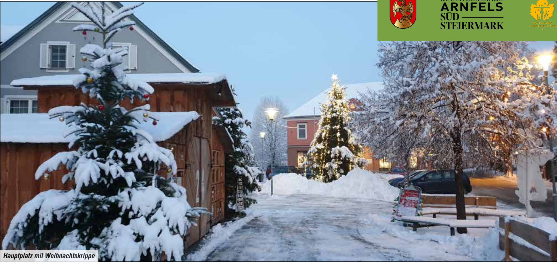
Hauptplatz mit Weihnachtskrippe