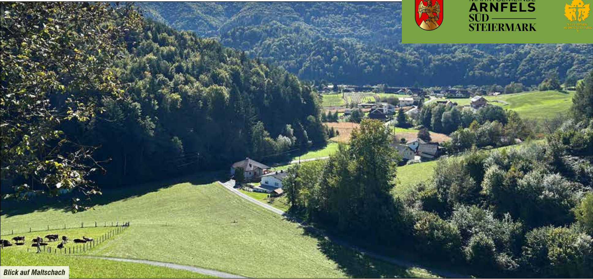
Blick auf Maltschach