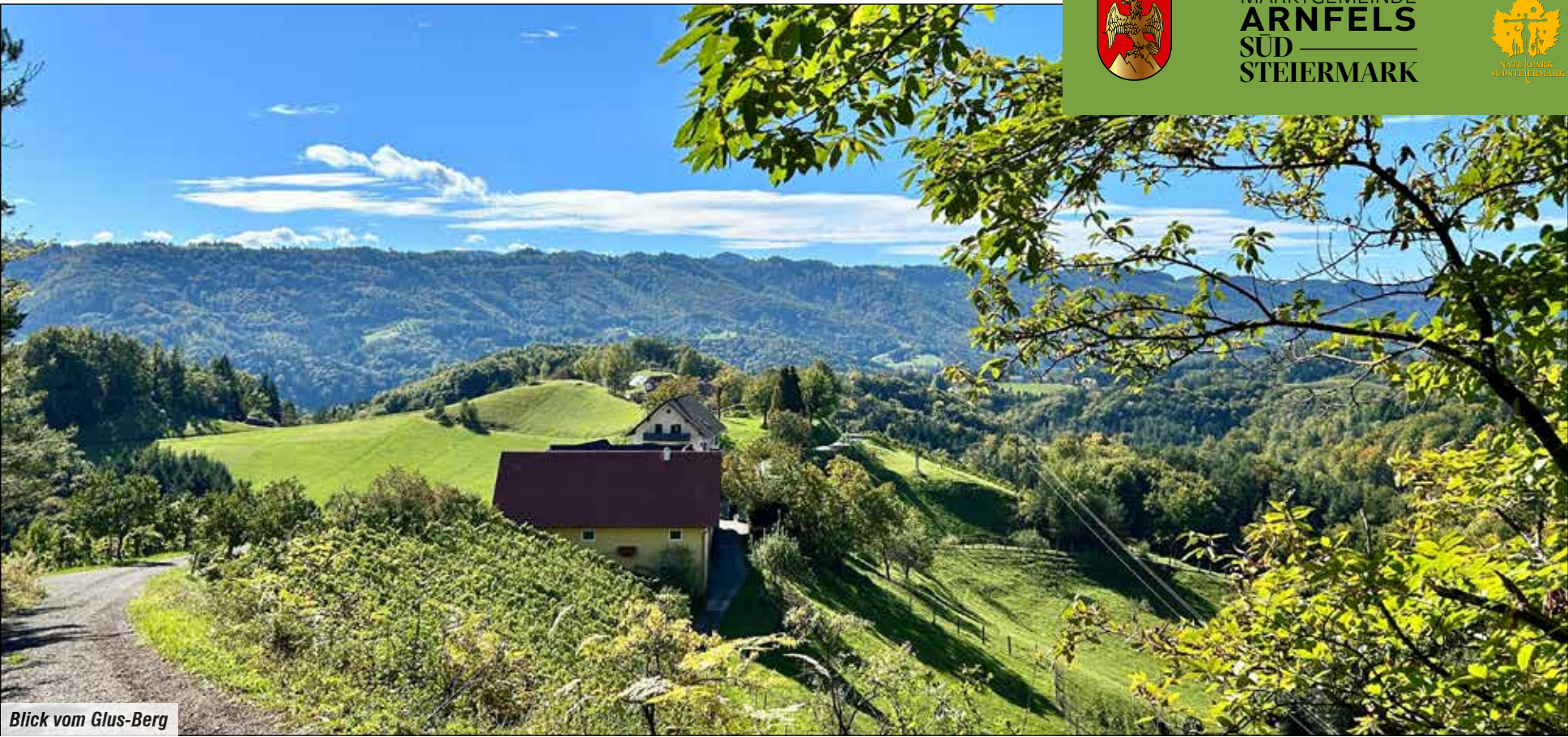
Blick vom Glus-Berg