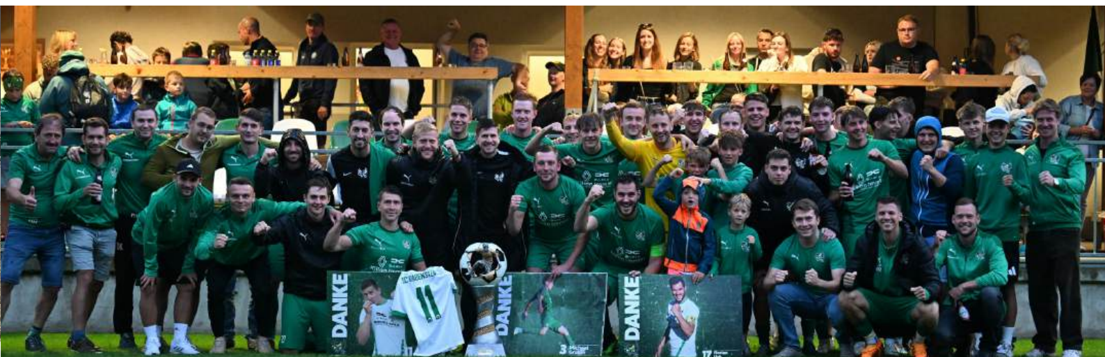
▲ Der SC Rabenstein wiederholte den Titelgewinn beim Dirndltalcup aus dem Vorjahr. Der legendäre Jahrgang 1994 setzte dabei eine letzte Duftmarke.

Trotz regnerischem Wetter ließen sich zahlreiche Zuschauer die großartige Stimmung und viele Tore nicht entgehen. Sportlich dominierte der SC Rabenstein: Nach einem beeindruckenden 7:0-Sieg im Halbfinale gegen Frankenfels setzte sich das Team im „Finale dahoam“ souverän mit 5:0 gegen Kirchberg durch und verteidigte damit erfolgreich den Titel.