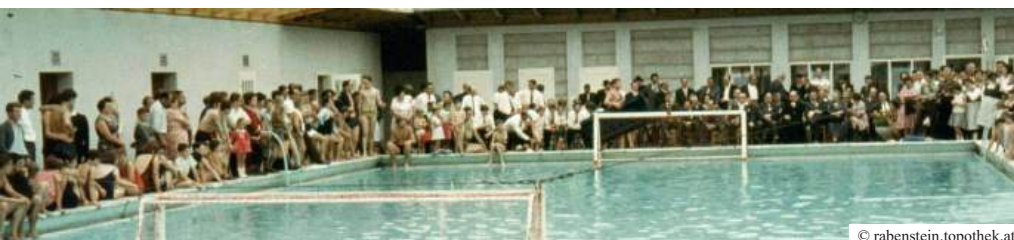
▲ Die offizielle Einweihungsfeier fand am 12. Juni 1966 statt und lockte mit spektakulären Wasserhandballspielen zahlreiche Besucher an.

Seit diesen Maßnahmen erfreut sich unser Pielachtalbad großer Beliebtheit. Besonders einzigartig ist, dass man bei uns in Rabenstein nicht nur im Becken, sondern auch direkt in der erfrischenden Pielach baden kann. So ist das Pielachtalbad bis heute nicht nur ein Ort zur Abkühlung, sondern auch ein beliebter Treffpunkt für Bewegung, Sport und gemeinsame Erlebnisse.