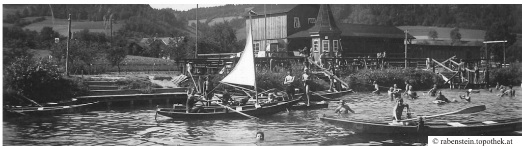
▲ Neben dem Baden in der Pielach konnten dort auch Ruderboote ausgeliehen werden – ein damals einzigartiges Freizeitangebot für die Bevölkerung und Besucher der Dirndltal-Gemeinde.

Nach der Auflösung des Verschönerungsvereines im Jahr 1958 übernahm die Gemeinde das Flussbad. Bereits ein Jahr später starteten umfangreiche Umbauarbeiten, die sich bis 1964 erstreckten. Die Holzbauten wurden durch Betonkonstruktionen ersetzt, ein Schwimmbecken entstand. Nach Abschluss der Arbeiten konnte das Bad 1964 wieder eröffnet werden.