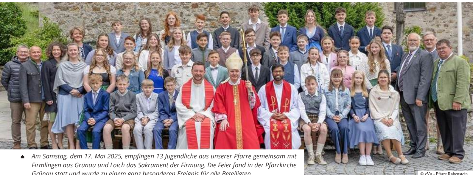
▲ Am Samstag, dem 17. Mai 2025, empfingen 13 Jugendliche aus unserer Pfarre gemeinsam mit Firmlingen aus Grünau und Loich das Sakrament der Firmung. Die Feier fand in der Pfarrkirche Grünau statt und wurde zu einem ganz besonderen Ereignis für alle Beteiligten.