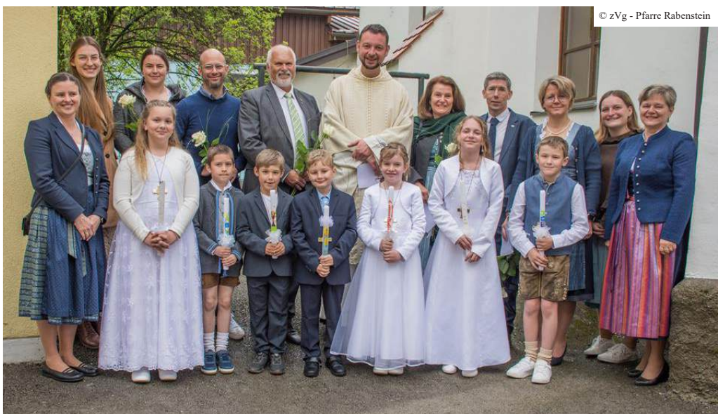
♥ Am Samstag, dem 26. April 2025, feierten die 7 Kinder der 2. Klasse der Volksschule Tradigist ihre Erstkommunion – ein besonderer und festlicher Moment im Leben der jungen Gläubigen.