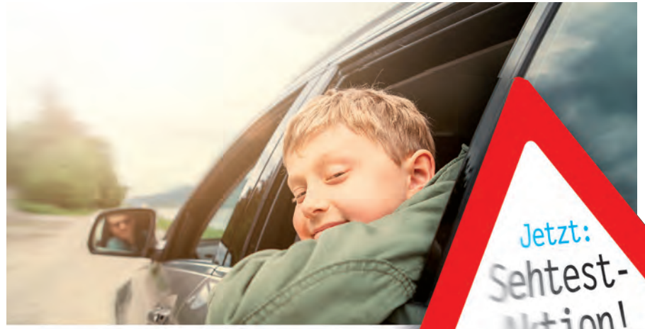
Jetzt zum Sehtest zu Optik Ruck - auch Ihren Liebsten zuliebe.

Der Sommer ist da und für viele geht's mit dem Auto in den Urlaub - stundenlange Autofahrten sind meist unumgänglich. Ein optimaler Sonnenschutz und eine perfekte Sicht sind Voraussetzung, um entspannt und unfallfrei ans Ziel zu kommen. Ihre Augenoptikermeister von Optik Ruck beraten Sie gerne, welches Sonnenschutzglas für Ihre Bedürfnisse ideal ist. Ein kostenloser Sehtest bei Optik Ruck trägt zu mehr Sicherheit im Straßenverkehr bei - gleich jetzt einen Termin vereinbaren und sicher in den Urlaub fahren. Sehtesttermine können Sie gleich online vereinbaren unter www.optik-ruck.at oder telefonisch unter 03155/40695.