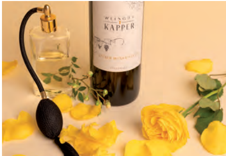
BEZAHLTE ANZEIGE

Von der Verkostung in gemütlicher Kelleratmosphäre bis zum Sommerevent „Grill&Chill“: Machen Sie Urlaub vom Alltag und chillen Sie im Weingarten! Genießen Sie Herzhaftes vom Grill, dazu ein kühles Gläschen Wein, süße Überraschungen, und das alles garniert mit einem grandiosem Ausblick über das Raabtal (Termine r.).