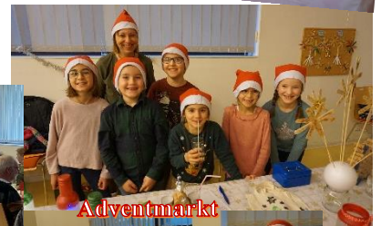
Adventmarkt des Elternvereins