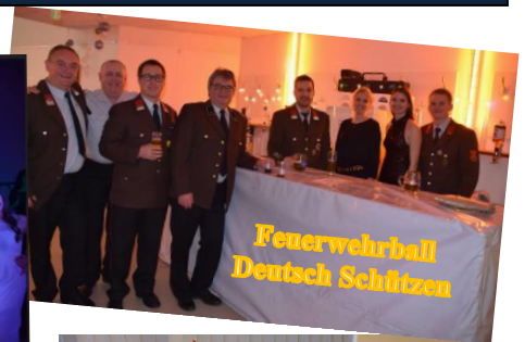
Feuerwehrball Deutsch Schützen