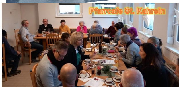
Pfarrcafe St. Kahren