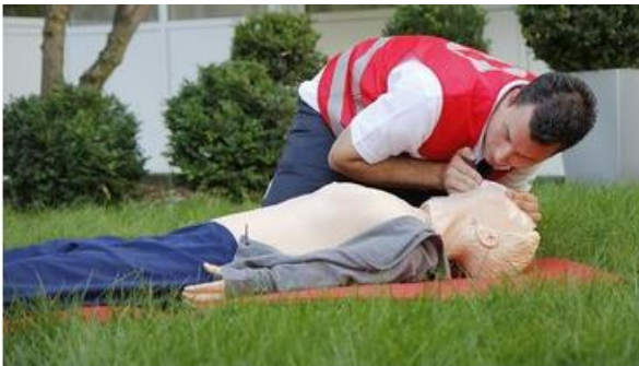
Erste Hilfe rettet Leben!