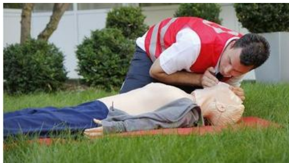
Erste Hilfe rettet Leben!