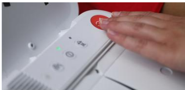
Ein Defi unterstützt im Notfall

Wegen der guten Nachfrage bieten wir gegen Ende des Jahres 2025 einen weiteren 16-stündigen Erste-Hilfe-Kurs in unserer Gemeinde an.