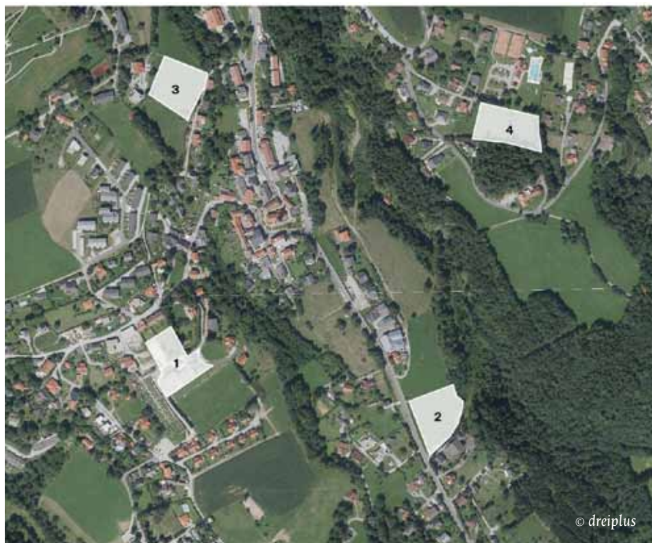
Die vier zur engeren Auswahl stehenden Grundstücke: 1 - Turnsaal, 2 - Diözese, 3 - PVA, 4 - Freizeitzentrum

Nachdem sich der Gemeinderat einstimmig für dieses Projekt ausgesprochen hat, ist nun ein möglicher Bau neben dem Detailvertrag mit der PVA primär von der Finanzierungszusage des Landes abhängig.