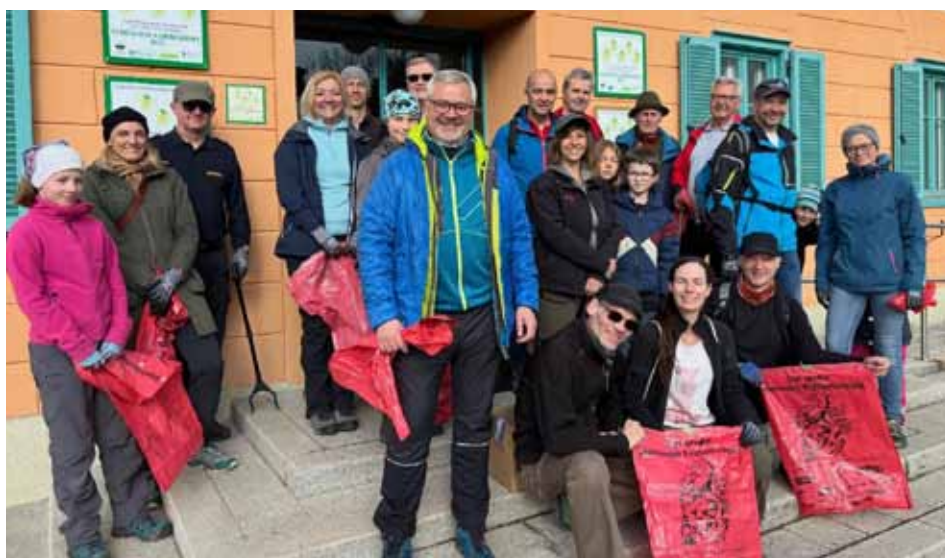
Die freiwilligen und motivierten Abfallsammler trafen sich vor dem Gemeindeamt

Die Gemeinde dankt allen Freiwilligen, die unseren Kurort wieder von umherliegenden Müll befreit haben und die mit ihrem ehrenamtlichen Engagement einen wertvollen Beitrag für eine saubere Steiermark leisten.