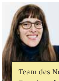
Team des Notariats

28 oder besuchen unsere kostenlosen Sprechstunden (telefon. Voranmeldung notwendig!) in Ihrem Gemeindeamt.