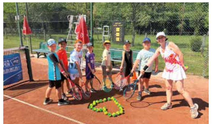
Ein Herz für Tennis