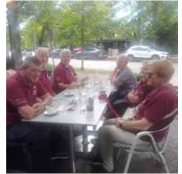
Bilder oben: Graz-Fahrt