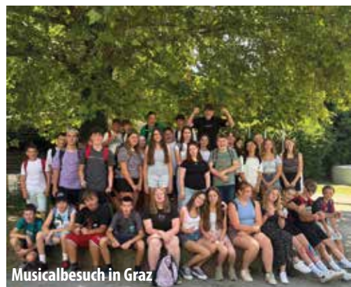
Musicalbesuch in Graz

So können unsere Schülerinnen und Schüler ihre Interessen entdecken, neue Talente entwickeln und ihre Stärken ausbauen.