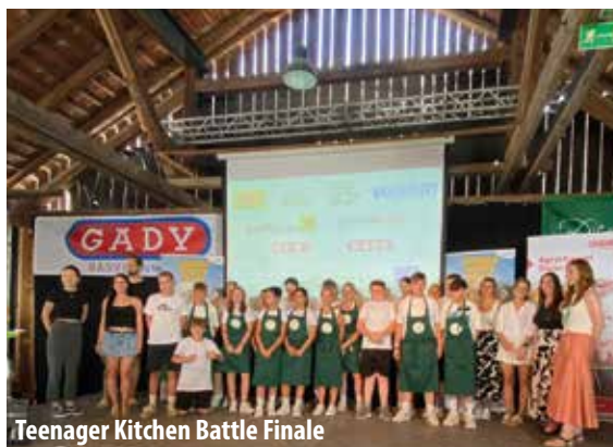
Teenager Kitchen Battle Finale