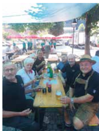
Frühschoppen St. Johann