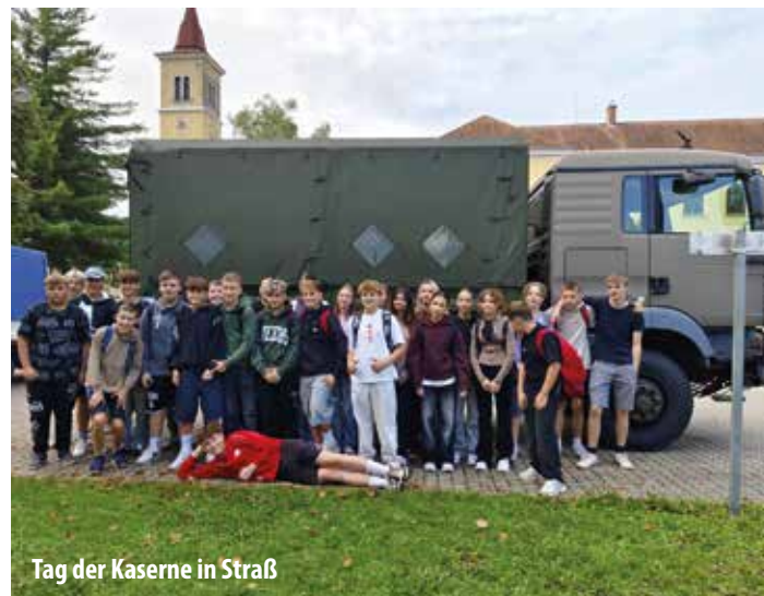
Tag der Kaserne in Straß

Beginn des neuen Schuljahres gefeiert. Ein besonderer Moment war die Begrüßung unserer ersten Klassen: Voller Vorfreude und Neugier wurden die Kinder willkommen