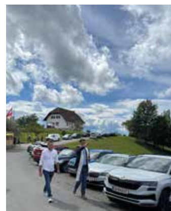
Bilder oben: Jubiläumsfeier