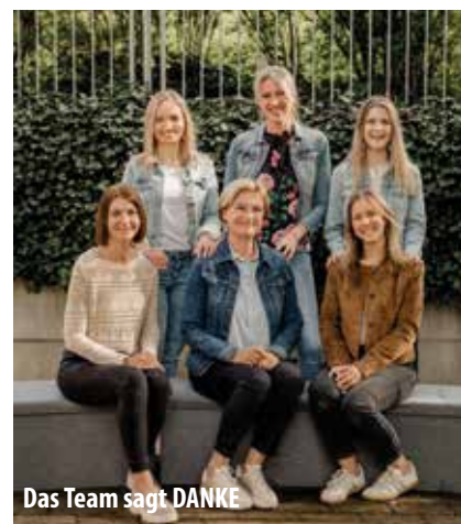
Das Team sagt DANKE

Gemeinsam begannen wir den Tag in einem Morgenkreis. Dort wurde das Buch „Mut murmeln für den ersten Schultag“ von Sarah Welk vorgelesen. Eine Geschichte, die Mut macht und daran erinnert, dass oft schon ein winzig kleiner Funke an Selbstvertrauen genügt, um Großes zu schaffen. So wie an diesem ersten Schultag: Mit einem offenen Herzen, ein wenig Mut und einer guten Portion Neugier kann jedes Abenteuer