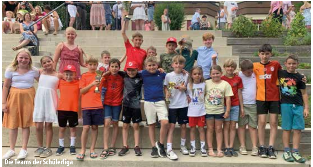
Die Teams der Schülerliga

Auch heuer nominierten sich für unsere Schülerliga junge