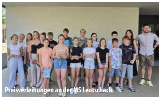
Preisverleihungen an der MS Leutschach