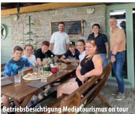
Betriebsbesichtigung Mediatourismus on tour

Unsere Mediatourismus-Gruppe der 4a war am 24. Juni zu Gast beim Familienweingut Germuth – ein großes Dankeschön für die herzliche Einladung! Nach einer spannenden Betriebsbesichtigung und interessanten Einblicken in die Arbeit rund um Weinbau und Buschenschank durften wir eine köstliche Jause auf der wunderschönen Terrasse mit