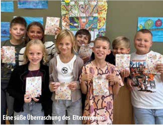
Eine süße Überraschung des Elternvereins