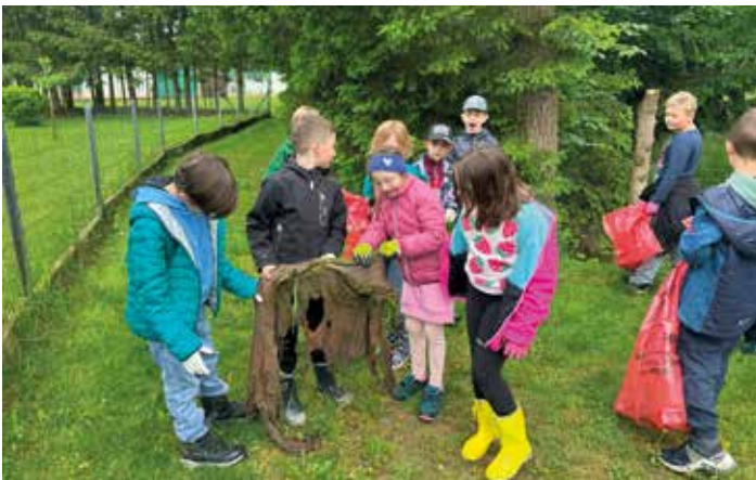
3a Klasse als Müllsammler bei der Frühjahrsputzaktion des Landes Steiermark