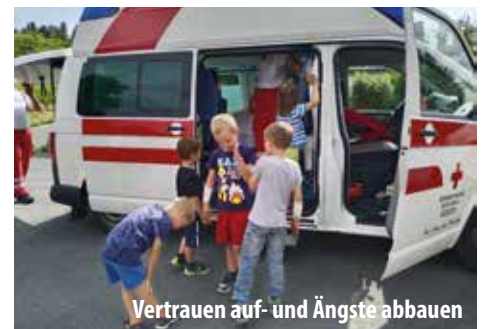
Vertrauen auf- und Ängste abbauen