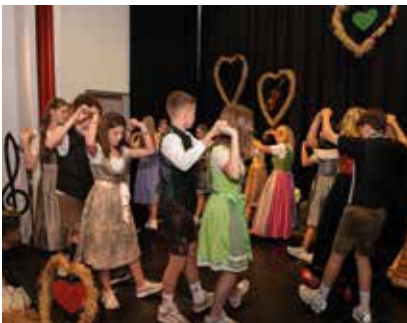
Volksmusikabend - Volkstanzgruppe

wird. Das Ergebnis dieser Zusammenarbeit zwischen Musikschule und Volksschule wurde bei diesem Konzert eindrucksvoll präsentiert. Zahlreiche Solisten, Volksmusikensembles, der Kinderchor und ein Percussionensemble waren im abwechslungsreichen Programm vertreten und verdeutlichten das breite Angebot der Musikschule Leutschach.