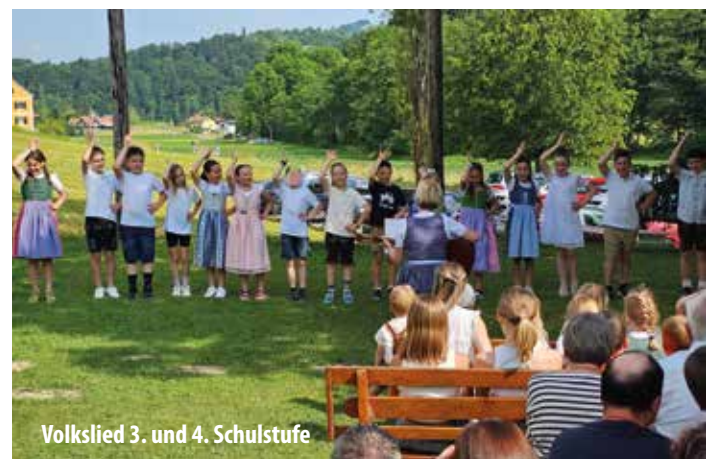
Volklied 3. und 4. Schulstufe