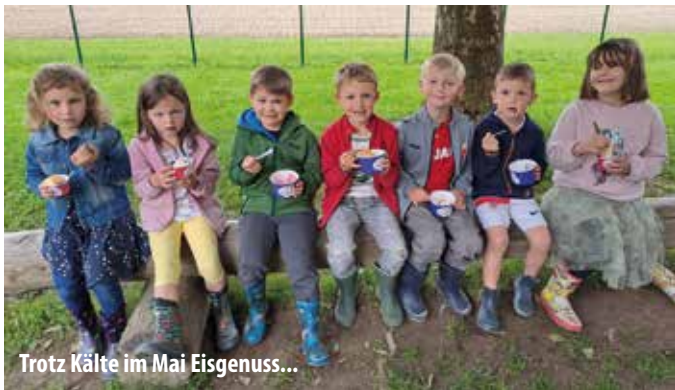
Trotz Kälte im Mai Eisgenuss...