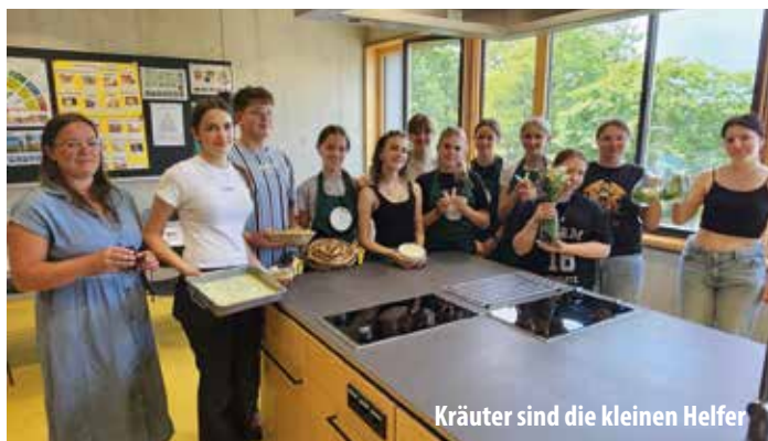
Kräuter sind die kleinen Helfer

Parfum und würziges Kräutersalz sowie Kräuternessig alles aus frischen Wiesenkrautern.