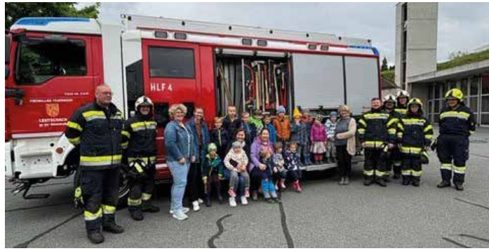
Kindergartenübung mit dem Pfarrkindergarten am 06.05.

der Freiwilligen Feuerwehr Leutschach eine feierliche Veranstaltung zu Ehren des Schutzpatrons, dem Hl. Florian, statt. Der Tag begann früh mit der heiligen Messe. Anschließend versammelten sich die Teilnehmer zu einem gemeinschaftlichen Frühschoppen im Rüsthaus der Feuerwehr Leutschach. Ein besonderer Dank gilt