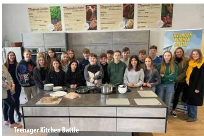
Teenager Kitchen Battle