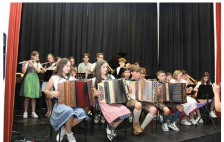
Jubiläumskonzert - Volksmusikensemble