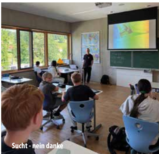
Sucht - nein danke