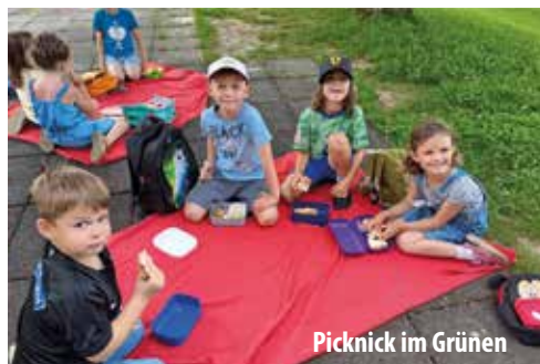
Picknick im Grünen