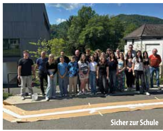
Sicher zur Schule