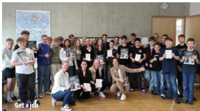
Get a job