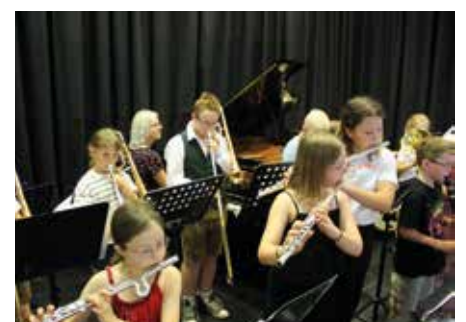
Jubiläumskonzert - Bläserkurs