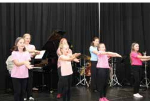
Jubiläumskonzert - Kinderchor