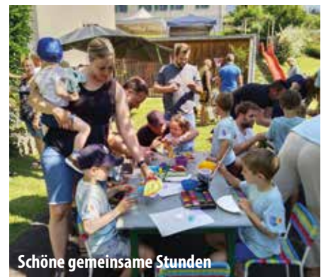
Schöne gemeinsame Stunden