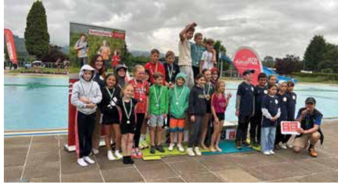
Aquathlon in Knittelfeld

Aus der VS Leutschach startete ein Team aus 10 sportbegeisterten Kindern. Die Aufgabenstellung in der Altersklasse der Volksschule 3./4. Schulstufe bestand aus 50 m Schwimmen im Freistil und einem 450 m Lauf. Das Team erreichte den 2. Platz am Stockerl und darf sich nun „Steirische Vizemeister