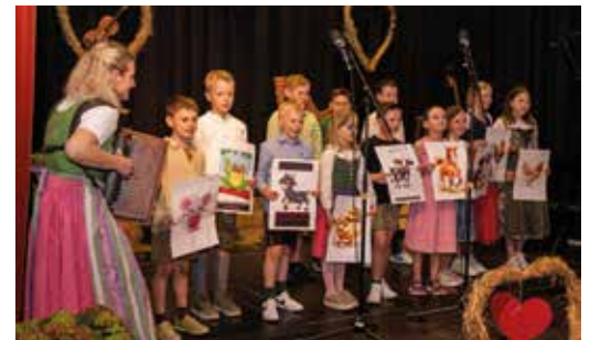
Volksmusikabend - Chor