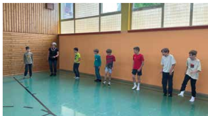
Rebenland-Liners als Tanzlehrer:innen in der VS Leutschach