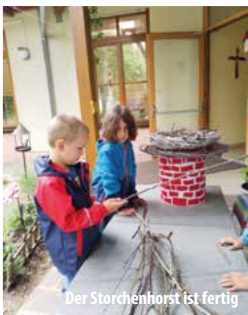
Der Storchhorst ist fertig