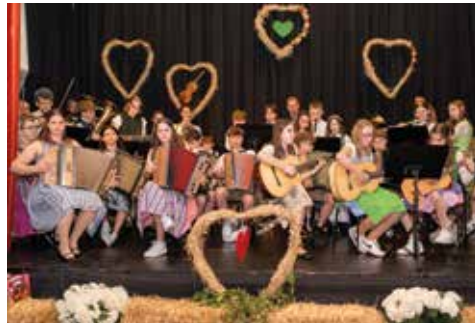
Volksmusikabend - Finale