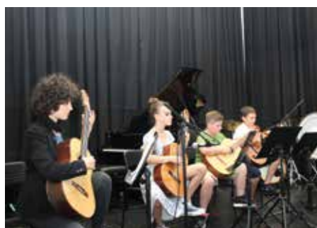
Jubiläumskonzert - Gitarrenensemble