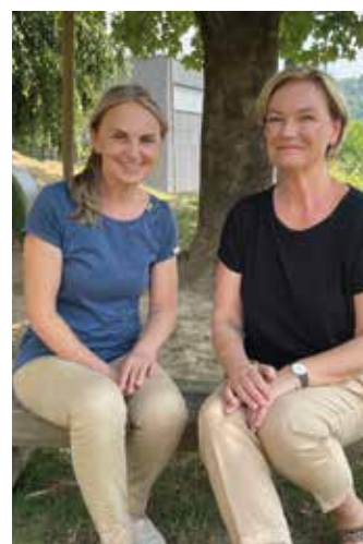
Dir. Claudia Pronegg & Dir. Gabriele Plasch

Diese Entscheidung bringt pädagogische Kontinuität und organisatorische Stabilität für beide Standorte.