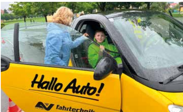
Verkehrsaktion des ÖAMTCs „Hallo Auto“