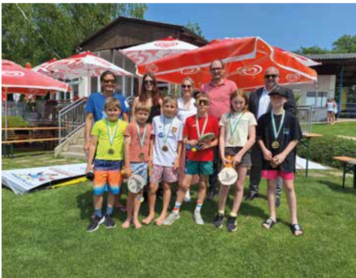
Pinguin Gold 2025 im Bezirk

Die heurige Exkursion der Slowenischgruppen der VS und der MS Leutschach führte uns nach Maribor. In der Kletterhalle nahmen sportliche Trainer:innen die Kinder ordentlich in die Pflicht – nach ca. 90 Minuten mit Laufen, Fangen und Klettern waren sogar bei unseren Dauersportlern Ermüdungserscheinungen zu erkennen.