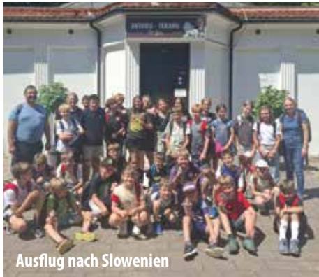
Ausflug nach Slowenien