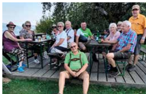
Vor der Almhütte