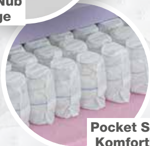
Pocket Spring Komfortkern