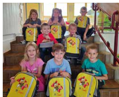
Sumsi-Rucksäcke der Raiffeisenbank

marsch führte die lustige Schar auf den Eichberg. Die Klappnetz, der Weinlehrpfad und wieder zurück zur Schule – eine große Runde war geschafft.