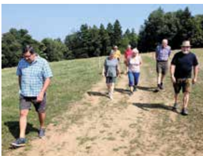
Wanderung auf die Remschniggalm