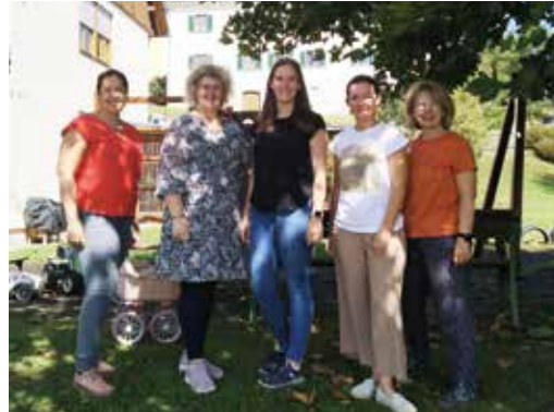
Das neue Team