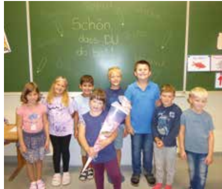
Der 1. Schultag

Ein besonderes Highlight des Tages war das Buch „Lernen macht Spaß“ von Brigitte Weninger und Eve Tharlet. In der Geschichte gründen die Tiere des Waldes ihre eigene Waldschule, in der jedes Tier seine einzigartigen Fähigkeiten lehrt und zugleich von den anderen lernt. Diese liebevoll erzählte Geschichte