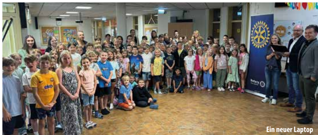
Ein neuer Laptop

Sportlichkeit und Ausdauer waren am Wandertag der Familienklassen gleich am Schulbeginn gefragt. Der Fuß-