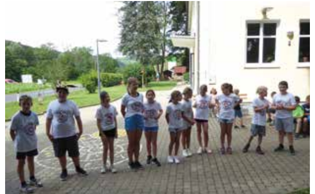
Die Kinder der vierten Klasse verabschieden sich

In der letzten Schulwoche fand unser alljährliches Sportfest statt und bot den