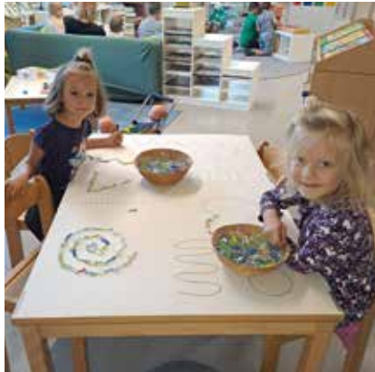
Start ins neue Jahr