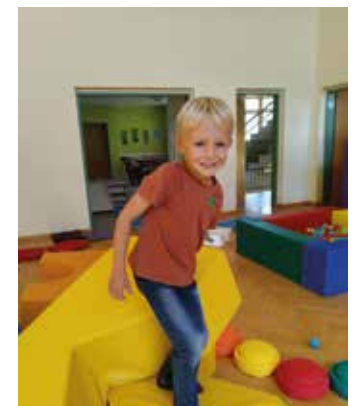
Neues Material testen