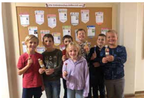
Ein süßes Schreibgeschenk