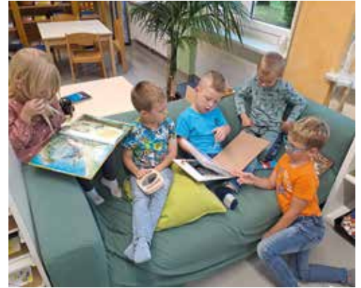
Freunde wieder vereint