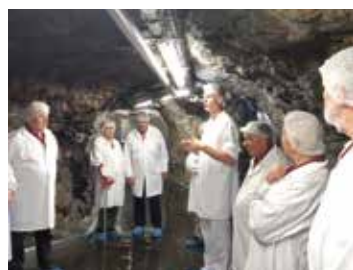
Bi. o. Imkerei Kreiner; Bi. u. Arzberger Käsestollen