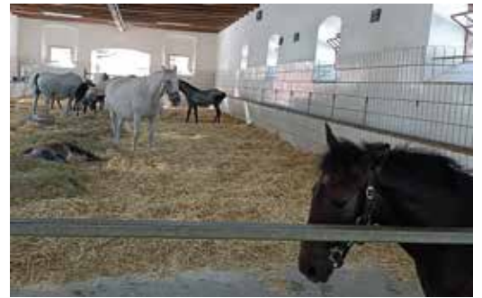
Sommerausflug nach Piber mit Führung durch das Lipizzanergestüt