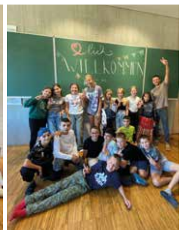
Dürfen wir vorstellen: Links die 1a und rechts die 1b

zige ihrer Art, durfte am 18. September hohen Besuch empfangen. Bildungslandesrat Werner Amon stattete der innovativen Bildungseinrichtung in Leutschach einen Besuch ab, um sich persönlich von der herausragenden Ausstattung und dem zukunftsweisenden Konzept zu überzeugen. Die Schule, deren Gebäude und Campus