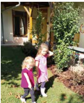
Eine Führung im Garten

Wir freuen uns auf ein kunterbuntes Kindergartenjahr, das Kindergartenteam