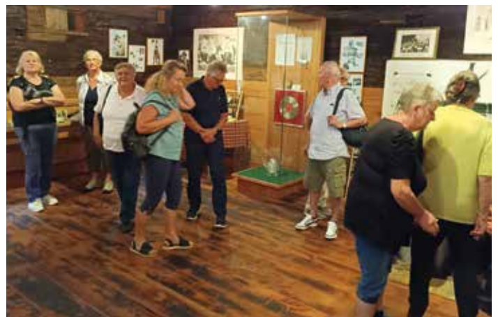
Führung im Kern-Buam-Museum

Alle Helfer beim Schnapsen und sonstigen Arbeiten sowie die Mehlspeisdamen wurden am 28. August zu einer Wanderung und Jause auf der Remschniggalm eingeladen. Es war ein gemütlicher Nachmittag. Beim Bezirkswander-