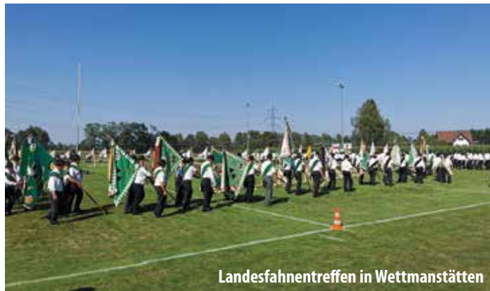
Landesfahnentreffen in Wettmannstätten