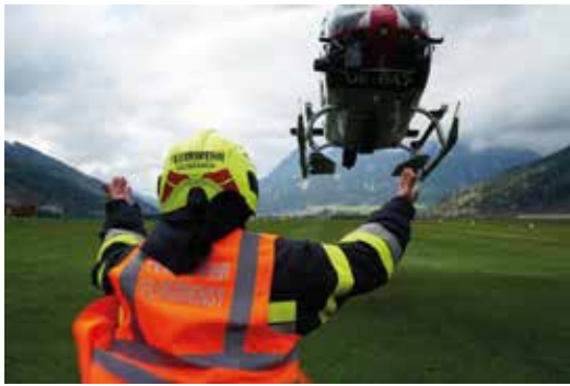
Alexander Postl - Ausbildung zum Flughelfer