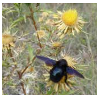
Golddistel (mit Holzbiene)