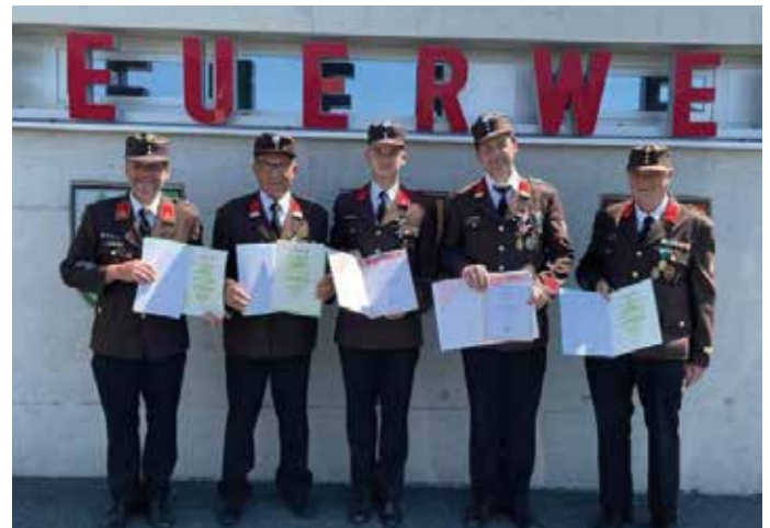
Verdiente Ehrungen und Auszeichnungen