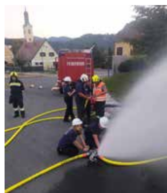
Übung Wasserbezug und Deckungsbreiten bei Flächenbränden