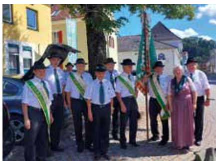
Bezirkstreffen mit Fahnenweihe in St. Georgen an der Stiefing