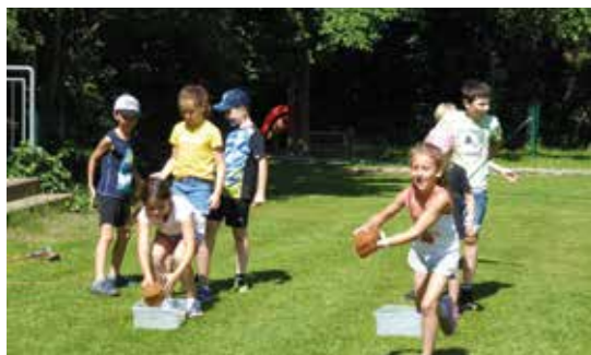
Spass beim Sportfest

Ein herzliches Dankeschön an den Steyr-Club Rebenland für die Verköstigung an diesem Tag. Die Bratwürstel schmeckten ausgezeichnet! Im kühlen Schatten unseres Schulhofes ließen wir den Vormittag gemütlich ausklingen.