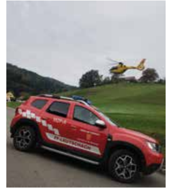
Rettung aus der Klamm