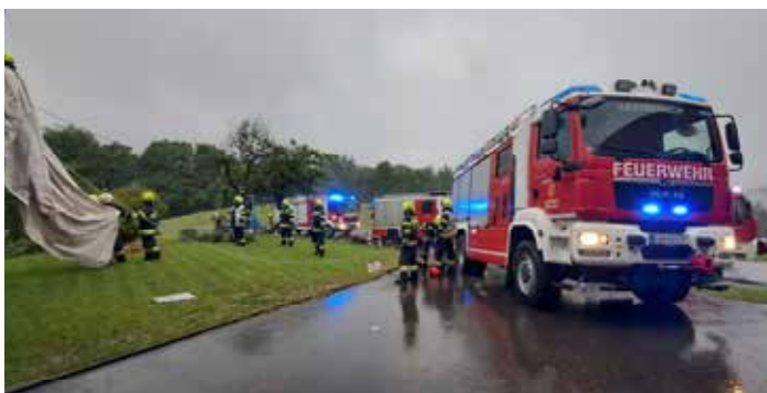
Blitzschlag endet glimpflich