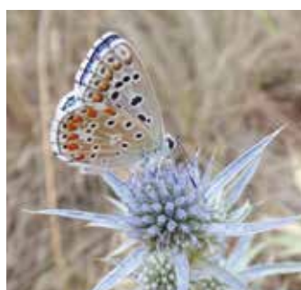
Mannstreu (mit Bläuling)