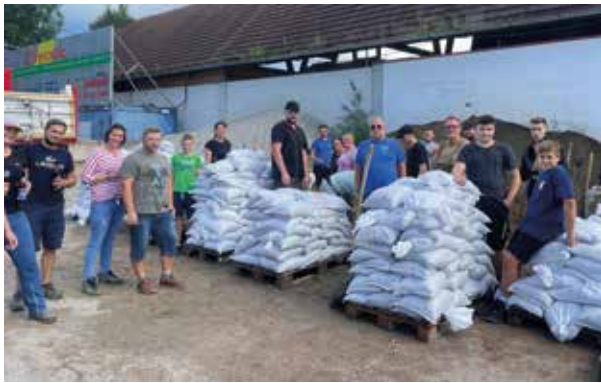
Danke! Viele freiwillige Helfer beim Sandsäcke-schaukeln