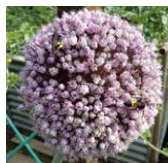
Lauchblüte (mit Dolchwespen)

Gedämmte Fassadensysteme – Schriften - Tapeten Moderne Raum- und Fassadengestaltung - Gerüstung Effektbeschichtungen – Holzschutz – Farbdesignvorschläge