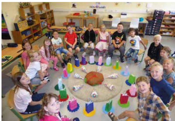
Unser erster Morgenkreis

Auch wir Lehrerinnen wünschen allen Schüler:innen ein spannendes und unvergessliches Schuljahr.