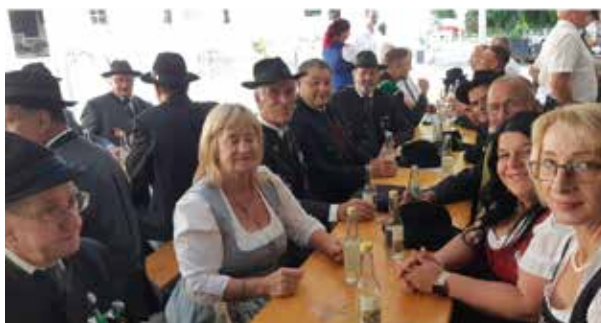
Bezirkstreffen mit unseren Fahnenpatinnen