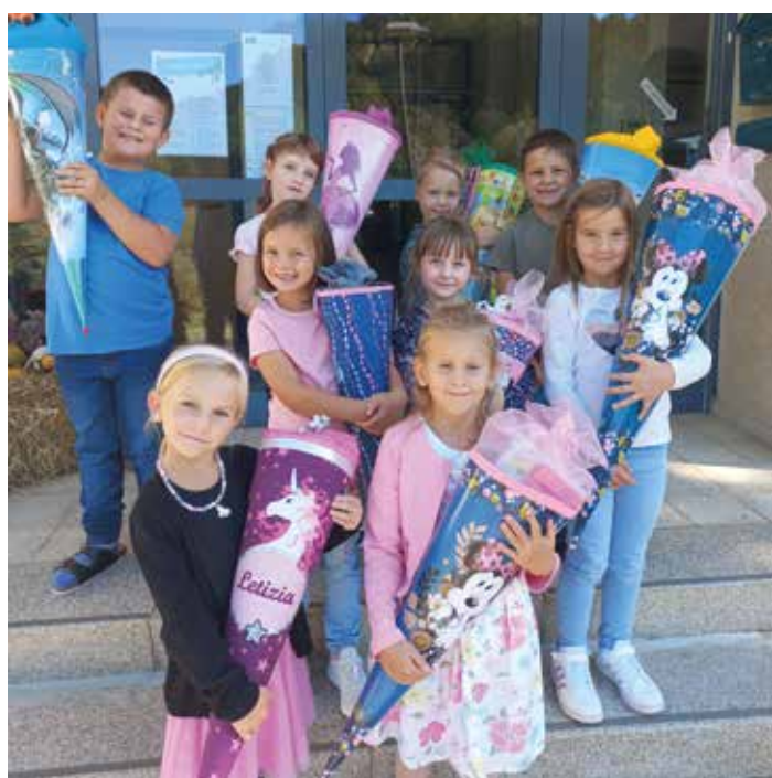
Der 1. Schultag