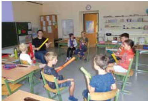
Rhythmus ist angesagt