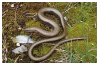
Hardegg, Juli 2018

Obwohl sie einer Schlange gleicht und diese Bezeichnung auch in ihrem wissenschaftlichen Namen ( Anguis = Schlange) vorkommt, gehört sie zur Familie der Schleichen und ist eine Echsenart. Ein wichtiges Unterscheidungsmerkmal zu Schlangen sind die beweglichen Augenlider. Hatte man früher nur zwischen Westlicher und Östlicher Blindschleiche unterschieden, so ergaben wissenschaftliche Untersuchungen, dass es noch eine Italienische, Griechische und die Peloponnes Blindschleiche gibt. Die bei uns vorkommende Westliche Blindschleiche ist von der Iberischen Halbinsel über Frankreich und Großbritannien, in den südlichsten Teilen von Norwegen und Mittelschweden bis zur Ostgrenze bei etwa Kaliningrad verbreitet.