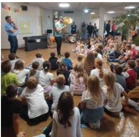
Musikschule in der Volksschule