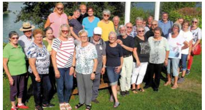
Teilnehmer am Sommerausflug

Unser Sommerausflug ging nach Ferlach, wo wir nach einer Kaffeepause eine ausführliche Führung durch das Büchsenmacher- und Jagdmuseum hatten. Es gab wunder schön verzierte Jagdgewehre zu besichtigen und auch massenhaft Trophäen sowie Tierpräparate zu sehen. Nach einem guten Mittagessen beim Gasthof Singer ober dem Drau-Stausee hatten wir eine Führung in den beiden Kirchen in Maria Wörth mit anschließendem Spaziergang auf der Halbinsel.