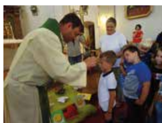
Gott schütze dich!