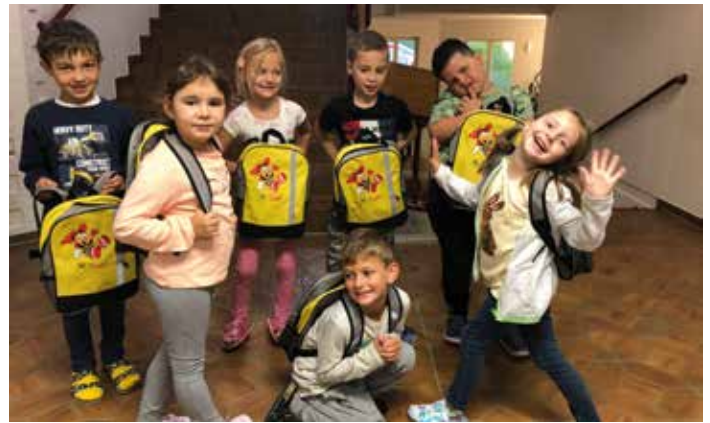
Schulanfänger:innen der Familienklassen