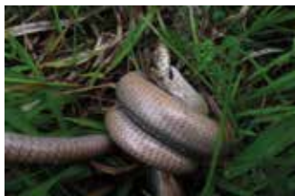
Paarung, Schütt am Dobratsch, Mai 2010

Die Paarung findet Mitte April bis Ende Juni statt. Bei der Kopulation, sie kann mehrere Stunden dauern, beißt das Männchen dem Weibchen in den Kopf oder Nacken. Die Tragzeit der Weibchen liegt bei etwa 11 bis 14 Wochen