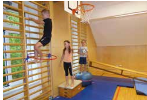
Klettern im Turnsaal