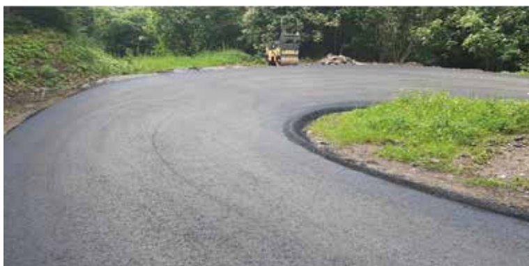
Arnfels-Salzaweg vorher & nachher