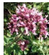
Dost - wilder Majoran