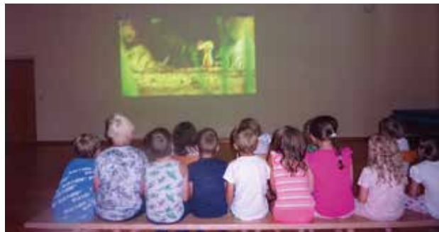
Kinobesuch im Turnsaal