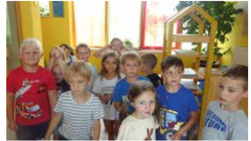
Wo ist der Schatz?