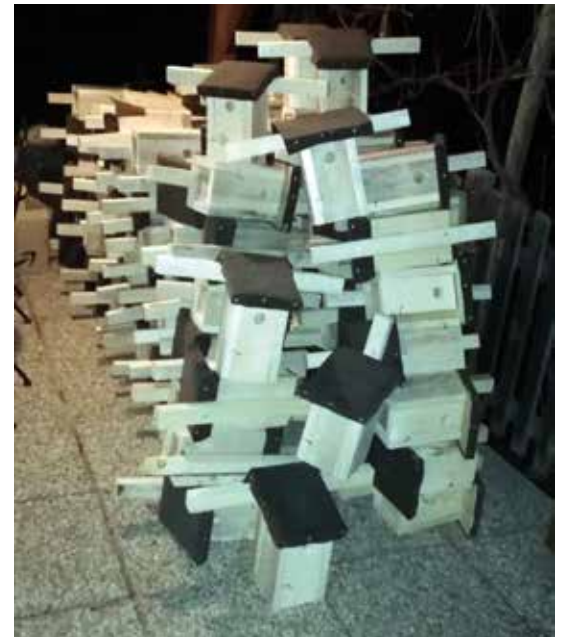
Mehr als 300 Nistkästen wurden heuer gebaut