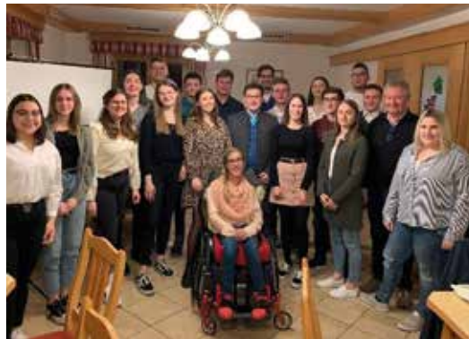
Die gesamte Landjugend Leutschach