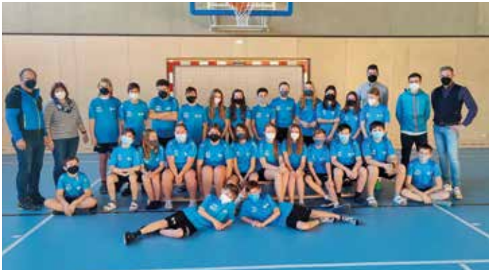
Gemeinsame Dressen für unsere SchülerInnen