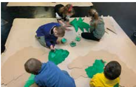
Das Bühnenbild entsteht