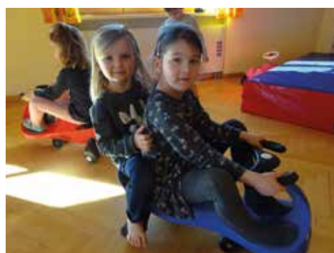
Vorbereitung auf die Rebenlandrallye