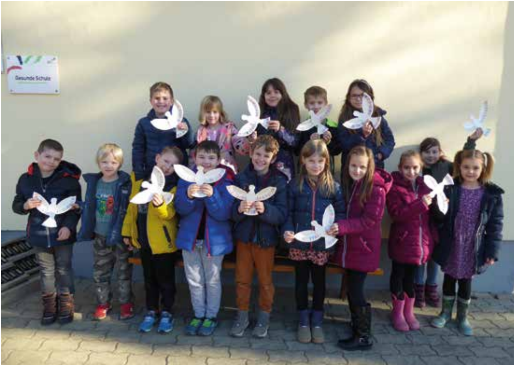
Die SchülerInnen mit den gebastelten Friedenstauben: Wir hoffen auf Frieden!