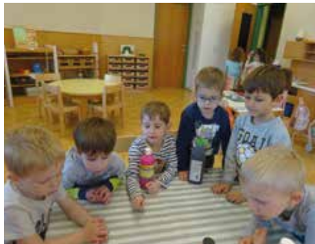
Gemeinsam kreativ sein