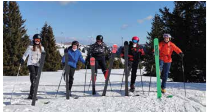
Wintersporttag auf der Winebene