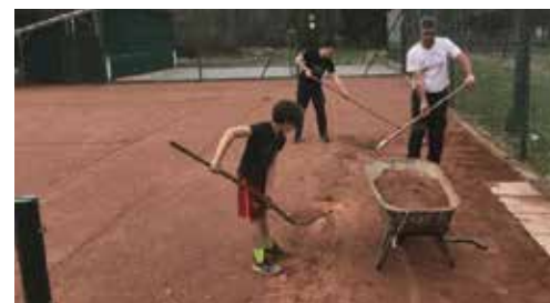
Mitte April ist die Sanierung der drei Tennisplätze geplant

zur Selbstentnahme und Selbstbezahlung im Vereinshaus erhältlich.