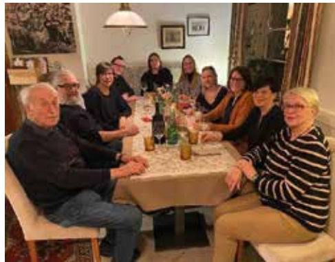
Startup-Feier im Neuen Jägerwirt

Mitte April werden wir unsere 3 Tennisplätze wieder mit der Kärntner Firma Memmer u.a. mit neuen Netzen, sanieren. Neue Linien wurden bereits im Vorjahr eingebaut, sodass diese heuer verbleiben können.