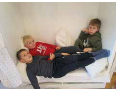
Siesta, chillen oder sich ausruhen - wie immer man es nennen möchte