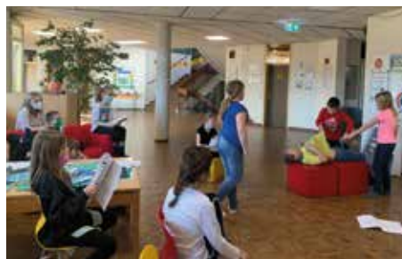
Proben in der Pausenhalle