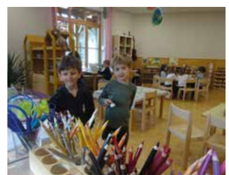
Wir fühlen uns wohl - auch mit den neuen Möbeln