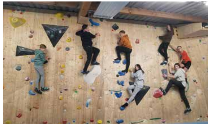
In der Boulderhalle des Alpenvereins in Leibnitz