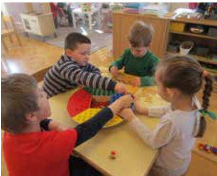
Ausdauer und Konzentration - sehr wichtige Kompetenzen der Schulanfänger

Lösungen für ein Mittagessen und den Sommerbetrieb zu finden. Dafür muss es allerdings auch Bedarf von Seiten der Eltern geben. Wir freuen uns auf die vielen neuen Herausforderungen und wünschen Ihnen einen schönen Start in den Frühling. Bleiben Sie gesund, das Team des Pfarrkindergartens!