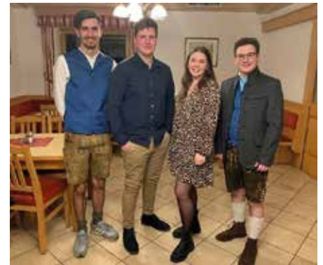
Leibnitzer Bezirksvorstand mit Leiterin und Obmann