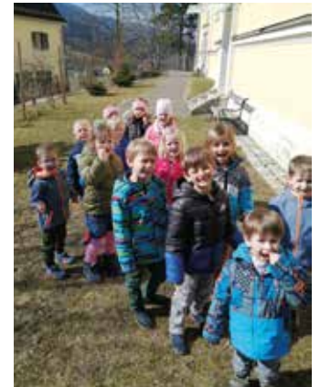
Auf zu den Vogelbeobachtungsplätzen

der Schmetterlingsgruppe möglich. Da unser Pfarrkindergarten ein Halbtagskindergarten ist, kann, aufgrund der von der Gemeinde Leutschach geförderten Randzeiten, eine durchgehende Betreuung von 6.30 Uhr bis 14.30 Uhr angeboten werden. Derzeit laufen Bemühungen,