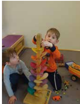
Den Klangbaum zum Klingeln bringen

kommen werden. Wir laden sie und ihre Eltern am Freitag, den 20. Mai 2022 zum Kennenlernen in den Kindergarten ein. Eine persönliche Einladung mit den genauen Zeiten wird natürlich noch zugesandt. Für die „Kleinsten“ der alterserweiterten Gruppe, wird es mehrere Möglichkeiten geben, sich mit dem Kindergartenbetrieb vertraut zu machen. Auch hier werden genaue Terminvereinbarungen folgen. Aktuell ist eine alterserweiterte Gruppe fixiert. Hier werden drei Kinder zwischen eineinhalb und drei Jahren gemeinsam mit 13 Kindern zwischen Drei und Sechs die Blumengruppe vervollständigen. Sollten noch weitere Kinder unter drei Jahren einen Kindergartenplatz benötigen, wäre das heuer auf Grund der niedrigen Kinderzahl auch in