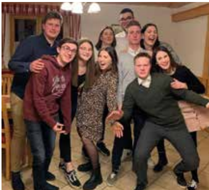
Der Vorstand der LJ Leutschach

Ab dem 14. Lebensjahr können sich neue motivierte Jugendliche bei unseren Mitgliedern melden, um unserer Landjugend beizutreten.