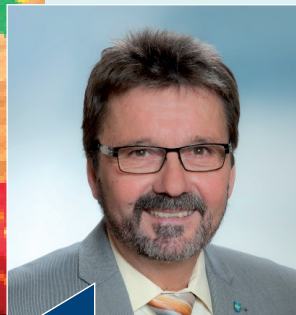
Bürgermeister Gerhard Lentschig