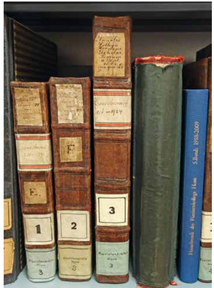
5 Bände Chronik des Piaristenkollegiums Horn 1721-2009

In der früher selbstständigen Gemeinde Breitenreich bestand von 1869 bis 1969 eine Volksschule (das ehemalige