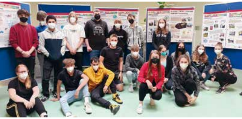
Die Schüler, die dieses Projekt ins Leben riefen und dazu eine Wanderausstellung mitgestalteten.