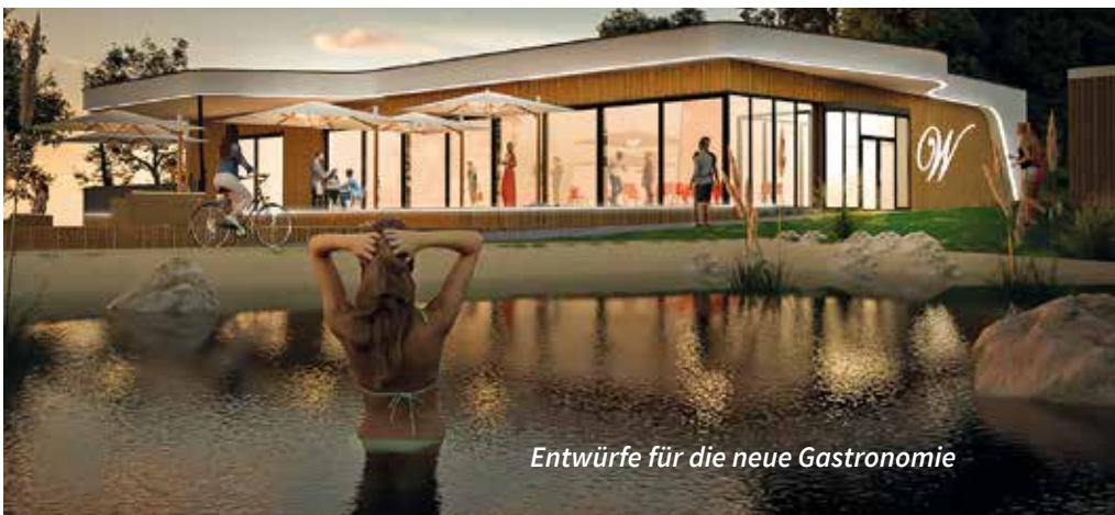
Entwürfe für die neue Gastronomie