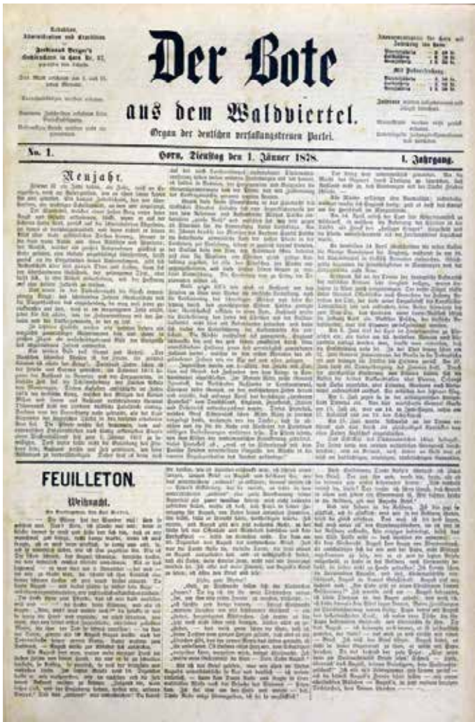
Erste Ausgabe der von der Druckerei Ferdinand Berger herausgegebenen Regionalzeitung