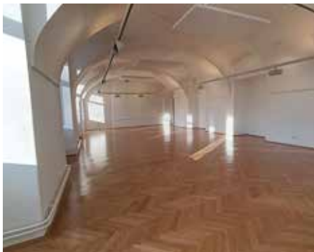
Der Buchstadtsaal: Ein Glanzpunkt im Kunsthaus Horn.

Der Buchstadtsaal im Kunsthaus Horn wurde in den vergangenen Wochen umfassend renoviert und präsentiert sich nun in vollständig modernisiertem Zustand.