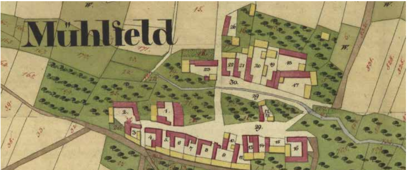
Mühlfeld im Franziszeischen Kataster 1823. Bild zum Mühlfeld-Artikel von Hanns Haas