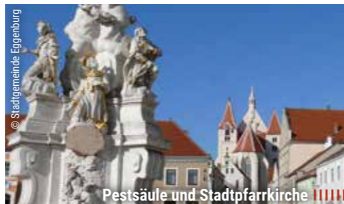
Pestsäule und Stadtpfarrkirche