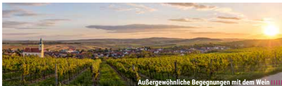
Außergewöhnliche Begegnungen mit dem Wein