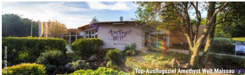
Top-Ausflugsziel Amethyst Welt Maissau