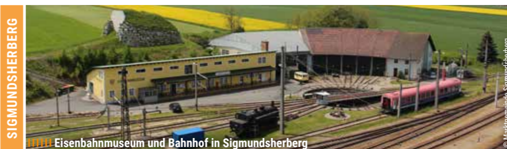
Eisenbahnmuseum und Bahnhof in Sigmundsherberg