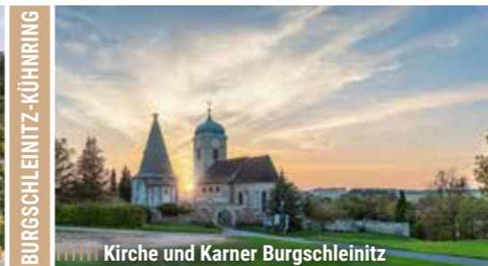
Kirche und Karner Burgschleinitz