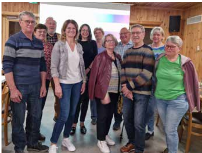
Workshop Digital Überall