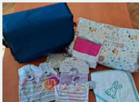
Inhalt einer „Babybag“ für Mädchen

Wir laden alle Eltern herzlich ein, sobald ihr Baby das Licht der Welt erblickt, die „Babybag“ bei uns am Gemeindeamt abzuholen!