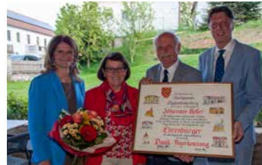
(3) © Stefan Kratzer