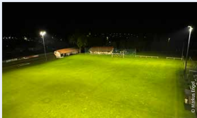
Flutlicht bei Nacht

Als einer der letzten Vereine im Bezirk wurde beim ESV Sigmundsherberg Ende April eine matchtaugliche Flutlichtanlage installiert. Die alten Halogenfluter wurden durch neueste LED-Technologie abgelöst und somit steht einer guten Sicht auch bei Abendspielen nichts mehr im Wege. Bei den Messungen wurde die nötige