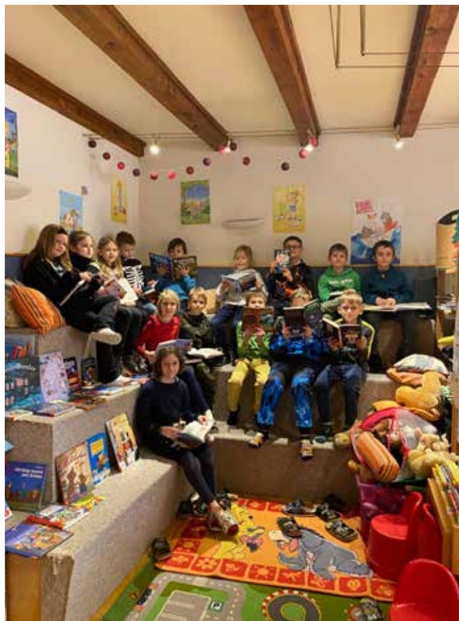
Schüler:innen der Volksschule Sigmundsherberg