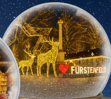
Lichterzauber bis 6. Jänner