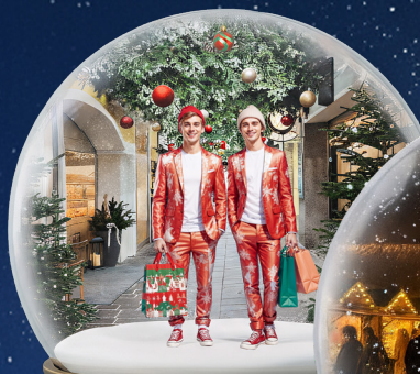
Advent-Butler alle Adventsamstage