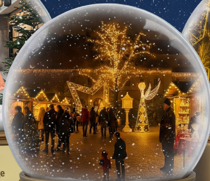
Weihnachtsmarkt immer Fr – So