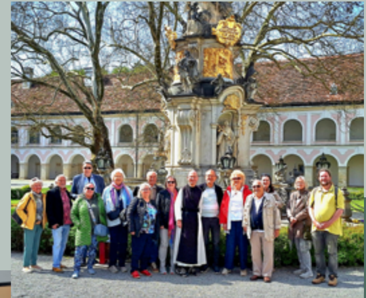
28. April 2026 Tagesausflug nach Stift Heiligenkreuz mit Führung

Anschließend Mittagessen im Kloster-gasthof Heiligenkreuz. Als Abschluss besuchten wir noch den Heurigen Reinisch in Tattendorf. Es war ein schöner und informativer Ausflugstag!