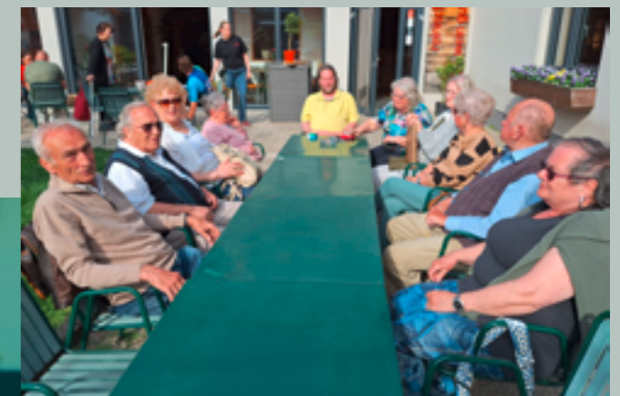
28. April 2026 Heurigenbesuch in Tattendorf, Weingut Reinisch