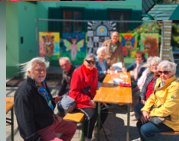
26. April 2026 Pensionistenbesuch offenes Atelier, Künstlerverein hinterm Leithaberg, Gringertgasse 15

Unser nächstes Pensionistentreffen vor den Sommerferien ist am 2. Juni 2026.