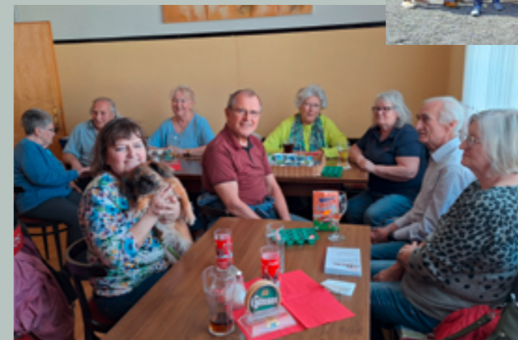
07. April 2026 Pensionistentreff im GH Schmalz/Tameler