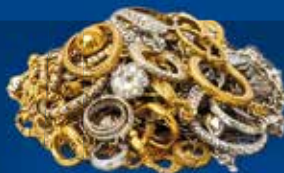
Gold- & Silberschmuck

geofin kauft ab sofort neben Goldmünzen und -barren auch Bruchgold wie Altgold, Goldschmuck und Zahngold an. Auf Wunsch: Barauszahlung sofort.