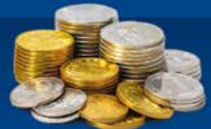
Gold- & Silbermünzen

geofin Finanzberatung GmbH, 8181 Dietmannsdorferstr. 289, Tel. 0664/420 8379 reinhold.schwarz@geofin.at , www.geofin.at