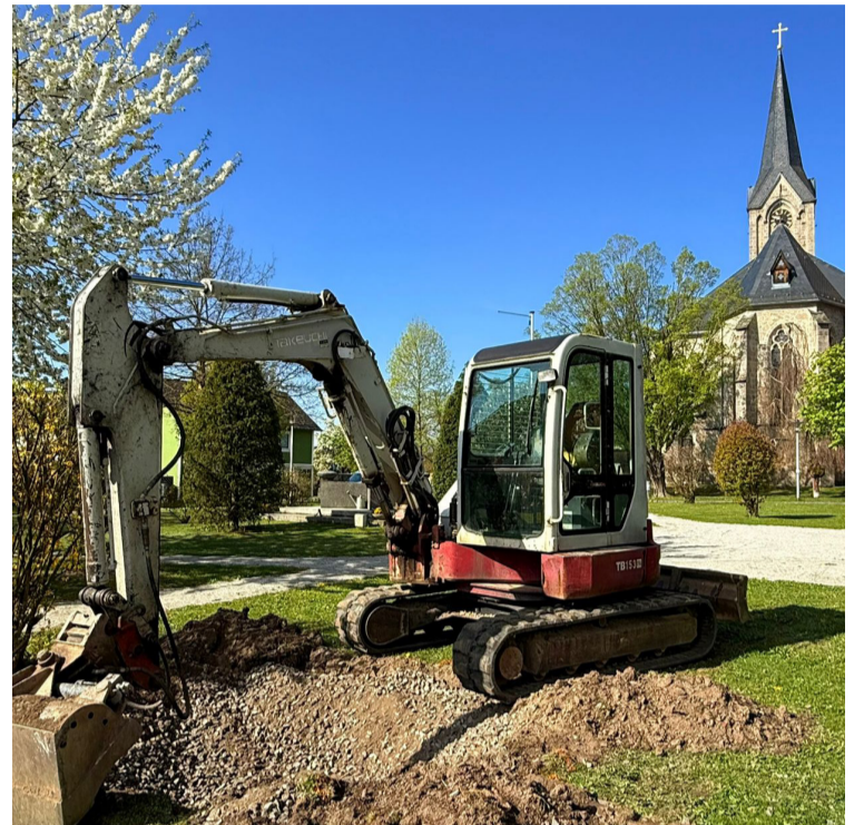
Im April hat der Bauhof der Stadtgemeinde einen neuen Baum im Kirchenpark gepflanzt. Im Rahmen eines Bürgerdialogs soll über eine teilweise Neugestaltung diskutiert werden.