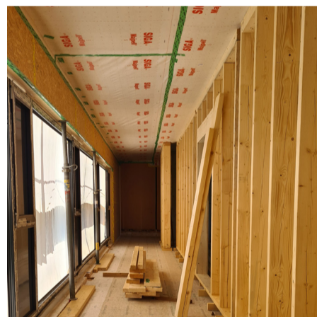
oben: Der Hort inkl. Anbau wurde komplett eingerüstet | unten: Innenansicht des Zubaus