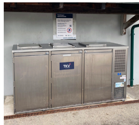
Sammelstelle für tierische Abfälle und Haustiere bis maximal 35 Kilo im Eingangsbereich der Kläranlage

Alternativ kann die Abholung auch online gemeldet werden: https://www.tkv-gruppe.at/falltierabholung