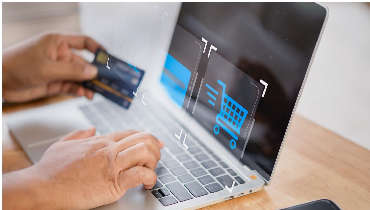
Beim Online-Einkauf ist Vorsicht gefragt: Professionelle Fakeshops wirken oft täuschend echt und zielen auf Zahlungsdaten ab. Ein wachsames Auge schützt vor teuren Betrugsfällen.

So schützen Sie sich im Internet vor gefälschten Angeboten, Datenklau und Trickbetrügnern!