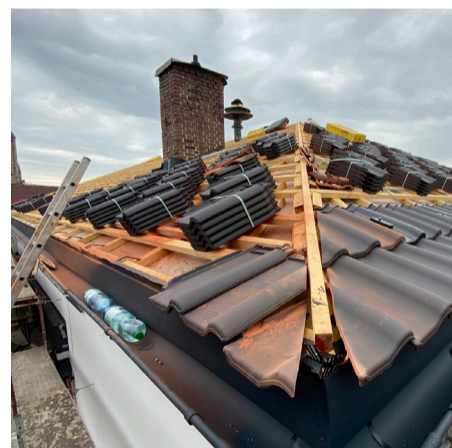
oben: Westansicht des Stadtamts während des Fenstertausches | unten: Neueindeckung des Daches