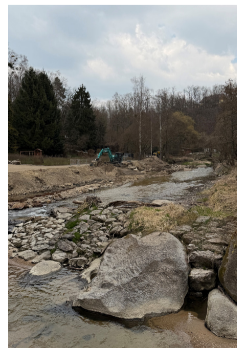
Die Feldaist während der Renaturierungsmaßnahmen

Die umzusetzenden Maßnahmen werden nach den Vorgaben einer verpflichtend eingebundenen ökologischen Bauaufsicht ausgeführt. Entlang der Feldaist konnten im Bereich der Kriehmühle (mit Wartberg) die Maßnahmen bereits abgeschlossen werden.