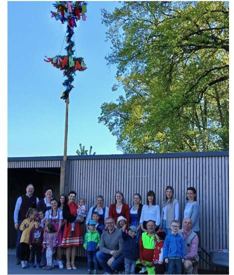
Unterstützung beim Ausschank von Speisen, Getränken und Kaffee.

Ein besonderer Dank gilt auch dem Elternverein Pregarten für die Unter-