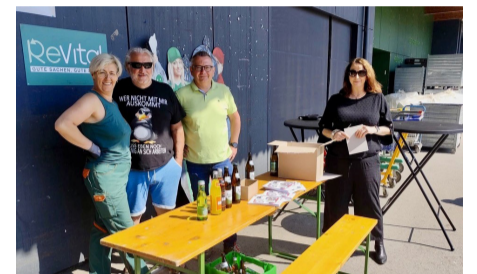
Tag der Abfallwirtschaft im ASZ Pregarten

Auch im Frühjahr stand im Wirtschafts- und Umweltausschuss wieder das Thema Abfallwirtschaft im Mittelpunkt. Unser Ziel ist es, die Abläufe und Hintergründe möglichst transparent zu vermitteln und Bürgerinnen und Bürger aktiv zu informieren.