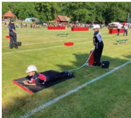
Die Obervogauer Feuerwehrjugend beim Leistungsbewerb in Leibnitz.

vogau, gemeinsam mit der Unterstützung des Ziviltechnikers Hr. Peter Draxler, nach den Vorstellungen und Anforderungen des Wasserdienstes aufgebaut. Für den Umbau investierte die Feuerwehr um die 20.000€ und 500 Arbeitsstunden in Eigenleistung. Das MZF konnte nach der Typisierung rechtzeitig kurz vor dem Hochwasser-einsatz am ersten Augustwochenende angemeldet werden und spulte dann im Einsatz schon 250km herunter. Nach der feierlichen Einstimmung durch die Musikkapelle Spielfeld, fand die Fahrzeugsegnung durch den Pfarrer und Feuerwehrkurat Herrn Robert Strohmaier statt. Zur Überraschung aller anwesenden wurde danach ein Scheck über 3.000€, als Spende vom Theater- und Kulturverein, durch ihren Obmann Hrn. Roland Skoff an HBI Thomas Dworschak überreicht. Anschließend wurden die Ehrungen von Mitgliedern der Feuerwehren Obervogau, Gamlitz, Wagendorf und Ratsch a.d. Weinstraße durchgeführt.