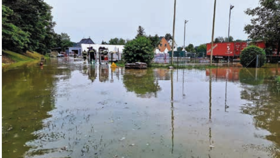
Der Festplatz der FF Spielfeld stand am 4.8.2023 unter Wasser.