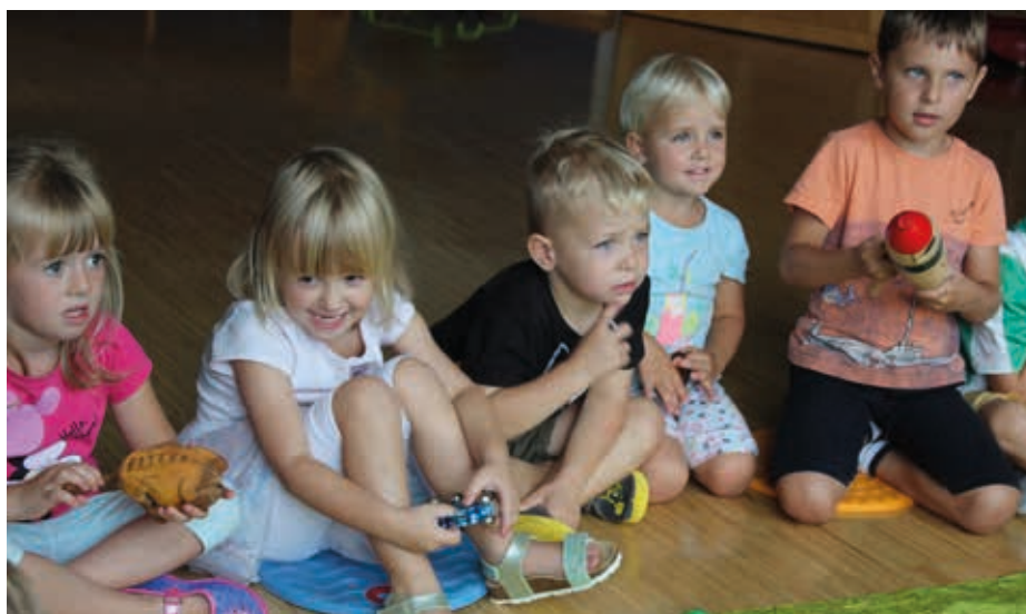
Bei den Kindergartenkindern in Obervogau dreht sich dieses Jahr alles um Kräuter.

Die nächsten Wochen stehen ganz im Zeichen der Herbst- und Erntezeit. Schwerpunktmäßig wollen wir uns in diesem Jahr mit Kräutern beschäftigen, ihre Wirkung mit allen Sinnen erleben, sie riechen, schmecken und verarbeiten. So freuen wir uns auf dieses Jubiläumsjahr und heißen alle neuen Kinder herzlich willkommen!