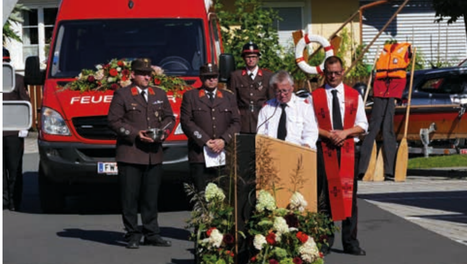
Dorffest mit Fahrzeugsegnung in Obervogau.