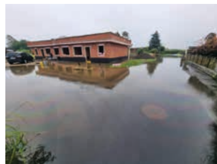
Hochwasser auch in vielen Teilen von Straß.