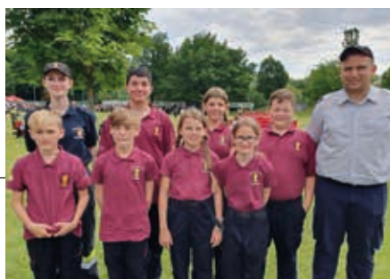
Die Gersdorfer Feuerwehrjugend nahm an mehreren Leistungsbewerben teil.