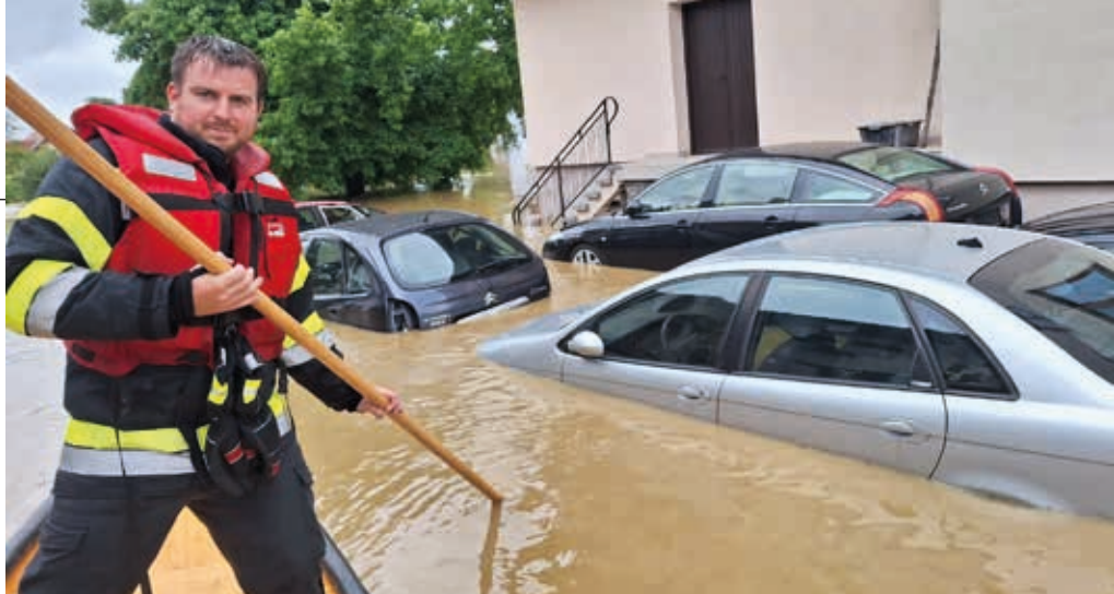
Lichendorf war im Gemeindegebiet am schwersten vom Hochwasser betroffen.

Am 04.08.2023, um 06.12 Uhr, wurde die FF Lichendorf zum ersten Mal aufgrund von Überschwemmungen im Ortsgebiet alarmiert. Bei der ersten Kontrollfahrt konnte der extrem hohe Wasserstand im Schwarzaubach wahrgenommen werden. Nur kurze Zeit später trat der genannte Bach über und überschwemmte die angrenzenden Grundstücke der Li-