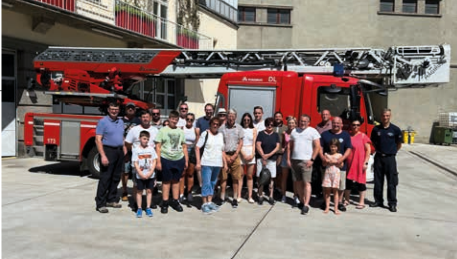
Die Vogauer Feuerwehr besuchte die Berufsfeuerwehr in Wien-Favoriten.

ersten Einsätze mit Pumparbeiten bei den betroffenen Wohnhäusern. Den ganzen Tag über arbeiteten unsere Einsatzkräfte mit Pumpen und Saugern gegen die Wassermengen. Am Abend wurden bei einem KHD-Einsatz, gemeinsam mit dem Bundesheer der Kaserne Straß 50 Paletten Sandsäcke abgefüllt. Diese wurden an die Krisenpunkte innerhalb des Bezirkes ausgeliefert. Die Lage blieb über das Wochenende, aufgrund der andauernden Niederschläge, angespannt. Am Samstag um 06.00 Uhr in der Früh folgten die nächsten Einsätze, diese dauerten bis in die Nachtstunden an. Auch am Sonntag folgten weitere Pumparbeiten in den Wohnhäusern. Nach diesen anstrengenden Tagen folgte am Montag der Reinigungstag. Alle Fahrzeuge wurden gewaschen und innen gereinigt, Schläuche wurden gespült, Pumpen gereinigt und wieder gängig gemacht, Werkzeug und Schutzbekleidung gewaschen.