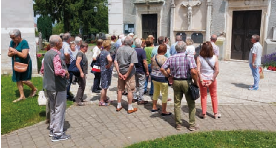
Ausflug des Seniorenbundes nach Frauenberg und Schloss Seggau.