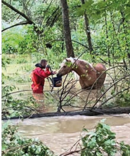
Rettung eines Pferdes aus dem Hoch-wassergebiet der Sulm durch Kräfte der Freiwilligen Feuerwehr Obervogau.

Als wären an diesem Wochenende nicht bereits genügend Feuerweh-reinsätze gewesen, wurde die FF Li-chendorf am 8. August 2023, um 00:50 Uhr, als Unterstützung zu einem