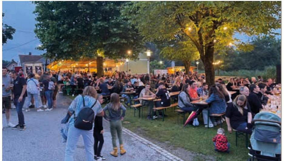
Trotz bescheidenem Wetter kamen zahlreiche Gäste und Nachbarfeuerwehren zum dies-jährigen Teichfest nach Gersdorf.

Am Samstag, den 17. Juni fand in Leibnitz und am 8. Juli 2023 in Voitsberg der Feuerwehr-Jugendleistungsbe- werb statt, der die Vielseitigkeit und das Engagement der jungen Feuerwehrfrauen und -männer hervorhob. Diese Tage waren ein unvergessliches Ereignis, sowohl für die teilnehmenden Jugendlichen als auch für