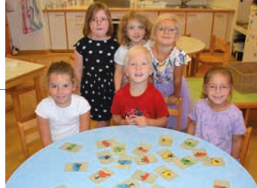
Start ins neue Kindergartenjahr.

24 Kinder besuchen in diesem Jahr unseren Naturpark-Kindergarten in Vogau. 14 Kinder sind halbtags angemeldet und 10 Kinder besuchen die Ganztagsgruppe. Die ersten Tage waren sehr aufregend und spannend für unsere 11 „Neulinge“. Unsere Kinder,