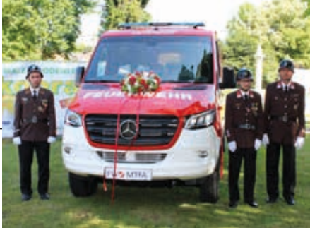
Fahrzeugsegnung in Lichendorf.