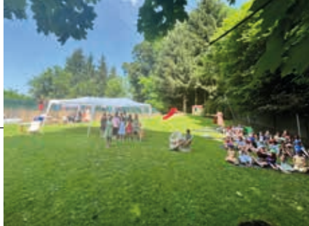
„Ich bin ich“ lautete das Motto des Sommerfestes in Spielfeld.

Bei strahlendem Sonnenschein feierte die Volksschule Spielfeld gemeinsam mit dem Kindergarten das Sommerfest. Das Motto des Festes war „Ich bin Ich“. Die Kinder aus dem Kindergarten spielten die Geschichte des kleinen Ich bin Ich nach und wurden bei den Liedern von den Volksschulkindern begleitet. Außerdem präsen-