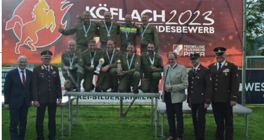
Vize-Landessieger hinter Allerheiligen wurden die Wettkämpfer der FF Weitersfeld.