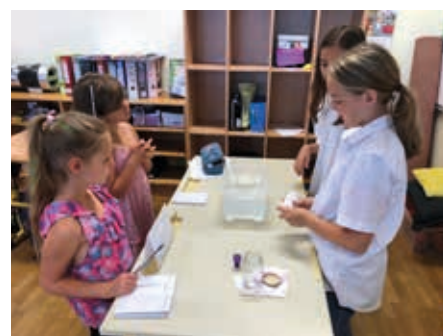
Forschertage: die Großen zeigen den Kleinen, wie es geht.

Am Montag in der letzten Schulwoche schlüpften die Schüler:innen der 4a der Volksschule Straß erstmals selbst in die Lehrer:innenrolle und bereiteten für die 1a Klasse einige Experimente vor. Zunächst wurden die Kleinen von den großen Schüler:innen begrüßt, danach wurde der Forscherkreislauf präsentiert und schließlich noch die wichtigsten Forscherregeln besprochen. An den Stationen zum Thema „Luft und Wasser“ konnten die Kinder der 1a dann die wichtigsten Eigenschaften dieser Elemente entdecken und erforschen.