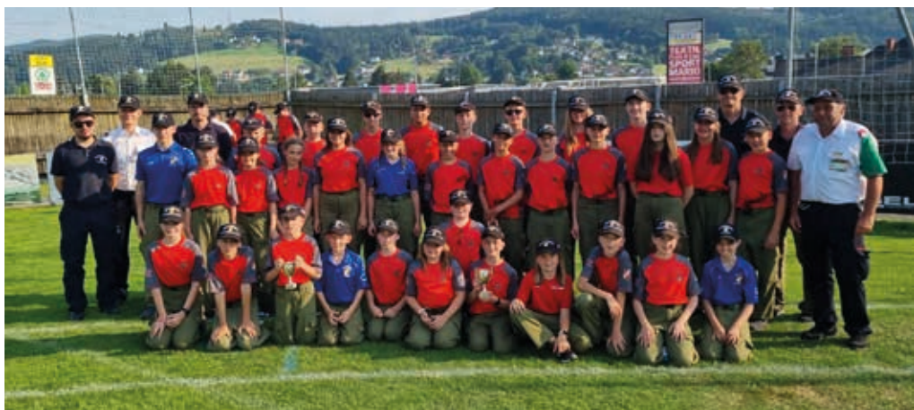
Erfolgreiche Teilnahme der Lichendorfer Feuerwehrjugend in Voitsberg.