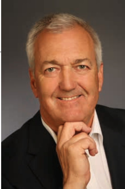
BÜRGERMEISTER REINHOLD HÖFLECHNER