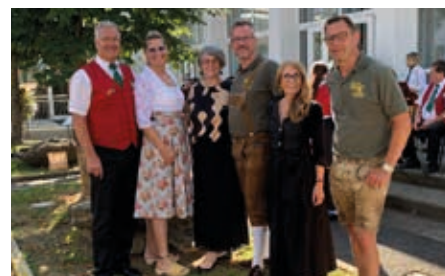
Der Straßer Pfarrgemeinderat bedankt sich bei den zahlreichen Gästen beim diesjährigen Pfarrfest.