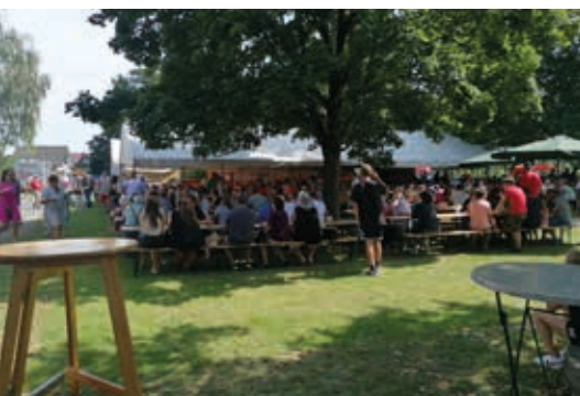
Das 14. Dorffest der FF Weitersfeld Ende August war gut besucht.

Nach unzähligen Trainingseinheiten und einigen Wettbewerbsteilnahmen als Vorbereitung, stand für die Bewertungsgruppe der FF Weitersfeld an der Mur am 23. und 24.06. das große Saisonfinale – der 57. Landesfeuerwehrleistungsbewerb in Köflach – am Programm. Wenngleich die Trainingsleistungen berechtigten Grund zum Optimismus gaben, war es gerade hier unbedingt notwendig, etwaige Nervosität abzulegen und gleichzeitig voll konzentriert und vor allem fehlerfrei zu arbeiten. Fehler wurden an diesem Tag zwar gemacht, jedoch nicht von der Bewertungsgruppe Weitersfeld an der Mur. Mit einer Lösch-Angriffszeit von 41,66 sec. und einer tadellosen Staffellaufzeit von 57,39 sec. erreichte die Weitersfelder Bewertungsgruppe den ausgezeichneten 2. Endplatz, was zugleich den Vize-Landessieger hinter der B-Gruppe aus Allerheiligen/Wildon bedeutete. Im abschließenden Parallelbewerb – hier treten die besten 7 B-Gruppen der Steiermark zum direkten Vergleich an – konnte die Angriffszeit auf fehlerfreie 40,88 sec. verbessert werden. Letztendlich bedeutete diese einwandfreie Zeit den Gesamtsieg im direkten Vergleich der Top 7.