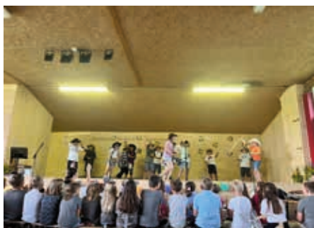
Aufführungen beim Sommerfest der Volksschule Lichendorf.

Am Sportplatz in Lichendorf feierten die Kinder und Eltern mit den Lehrerinnen einen Abschluss des heurigen Schuljahres. Die Organisation wurde von den Eltern der 3. Schulstufe mit äußerst großem Engagement durchgeführt. Nach den großartigen Darbietungen der einzelnen Klassen sowie der IKU - Gruppe konnte man das Fest in vollen Zügen genießen. Bei Speis und Trank, Musik und Tanz fand dieses Ereignis einen gemütlichen Ausklang.