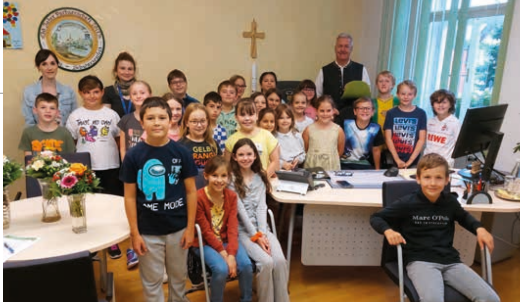
Die dritten Klassen der Volksschule Straß erhielten einen Einblick in die Aufgaben des Gemeindeamtes in Straß.