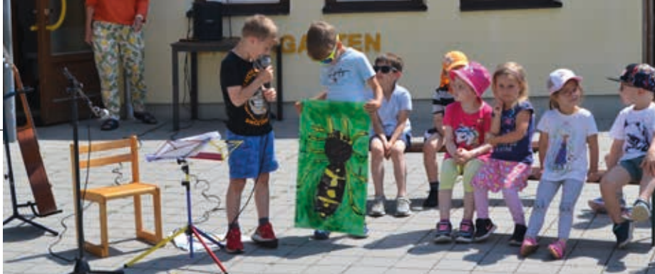
Ihre tollen Tierplakate präsentierten die Vogauer Kinder beim Sommerfest.

„Auf der Blumenwiese hinterm Haus“ und „Unter meinen Füßen da krabbelt etwas“ konnten sich die Kinder auch musikalisch und darstellerisch präsentieren. Beim Buchstaben-Theater zum Lied „Auf der Mauer auf der Lauer“ zeigten unsere Schulanfänger ihre Kenntnisse im phonologischen Bereich und im Buchstabieren. Für Kinder, Personal und Eltern war es ein spannendes Sommerfest, sodass gemeint wurde: „Heute haben wir Erwachsene von den Kindern viel lernen können und bei diesem spielerischen