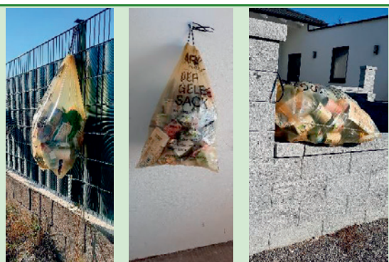
Gelber Sack: Hochgehängt oder hochgelegt und für Igel außer Reichweite.

Die Igel erwachen bald aus dem Winterschlaf. Bei der nächsten Sack-Abholung kann man mit diesen einfachen Handgriffen helfen. Danke!