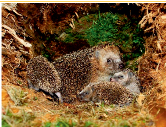
Eine Igelmutter versorgt etwa 4 bis 6 Säuglinge [2].

Am nächsten Tag werden die gelben Säcke abgeholt. Im Sack gefangene Igel haben keine Chance. Wird eine säugende Igelmutter abtransportiert, sind auch ihre Jungen verloren.