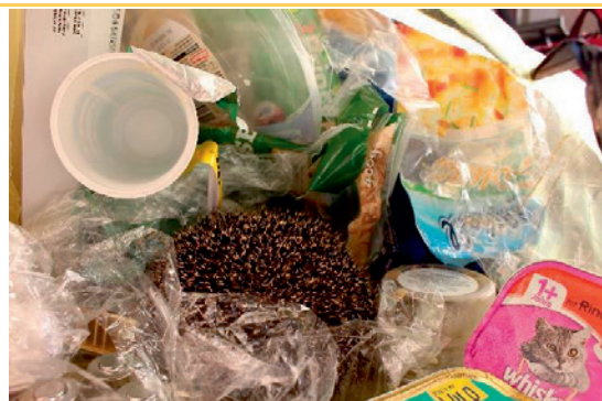
Igel im gelben Sack sind fast unsichtbar. Bei Abtransport des Sacks wird der Igel „mitentsorgt“.