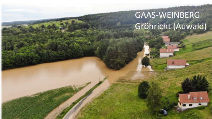
GAAS-WEINBERG Gröhricht (Auwald)