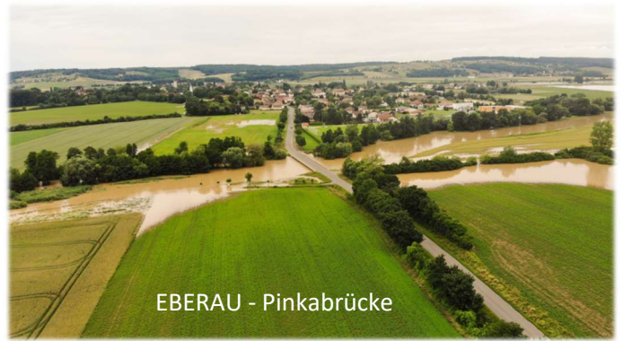
EBERAU - Pinkabrücke