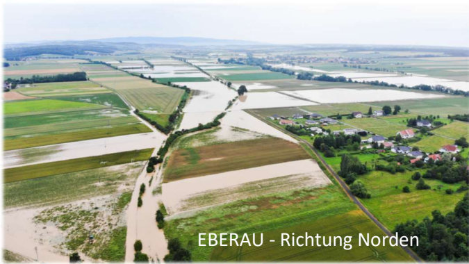
EBERAU - Richtung Norden