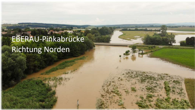
EBERAU-Pinkabrücke Richtung Norden