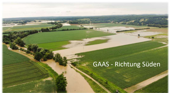
GAAS - Richtung Süden