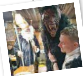
Der Krampus holt die "Schwindler"