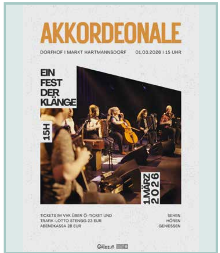
Text: Angelika Reich