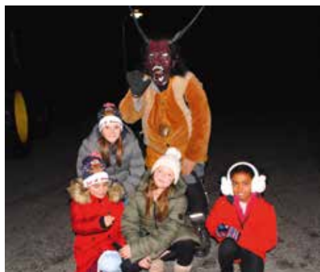
FREIWILLIGE FEUERWEHR HOCHENEGG