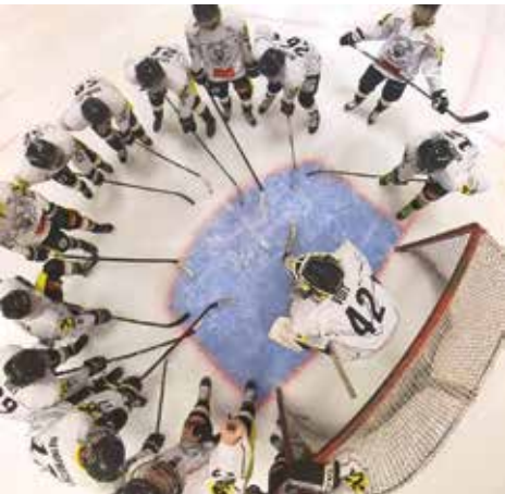
EC WHITE TIGERS ILZ