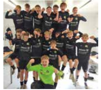
Jubelnde Siegerteams: U10, U11 und U14, U16 in der Landesliga