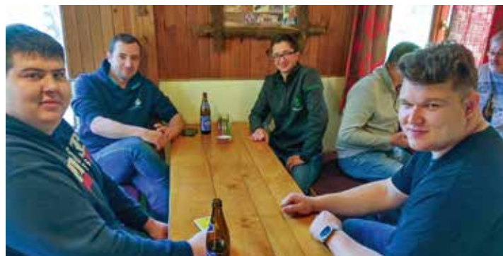
Alle hatten Spaß beim Schnapsen