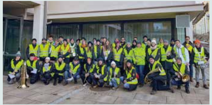
Ankündigung Musikverein Ilz