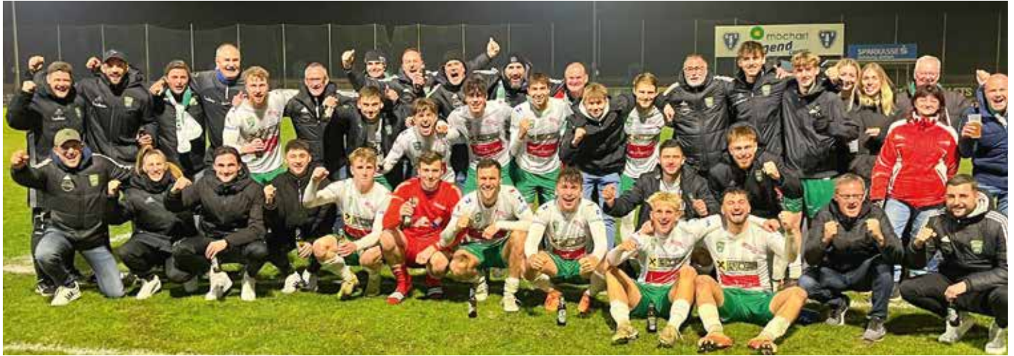
Text & Fotos: Ilzer SV