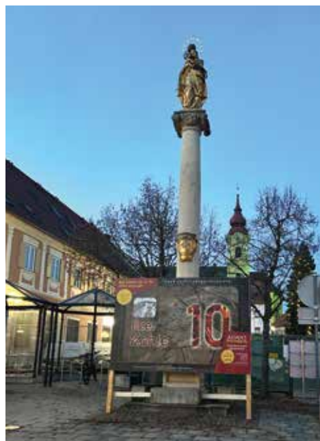
Der Ilzer Kohle-Adventkalender 2025