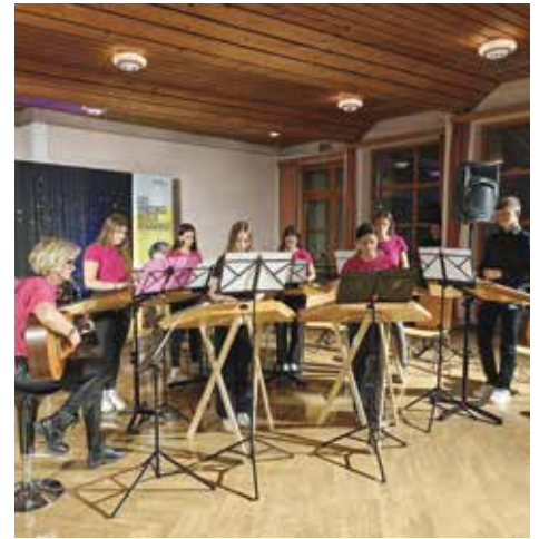
Text & Fotos: Musikschule Ilz