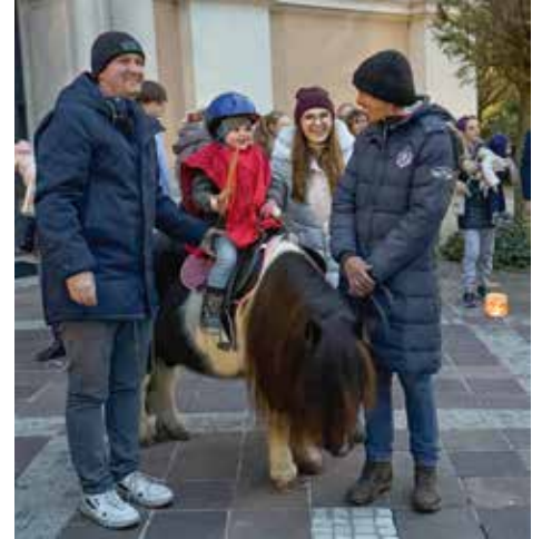
Im November leuchteten die Kinderkrippen- und Kindergartenkinder in Ilz Sankt Martin auf einem echten Pony den Weg.

Gemeinsam erleben wir eine Zeit voller Licht, Wärme und Vorfreude auf Weihnachten.