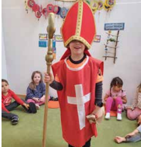
KINDERGARTEN UND KINDERKRIPPE ILZ